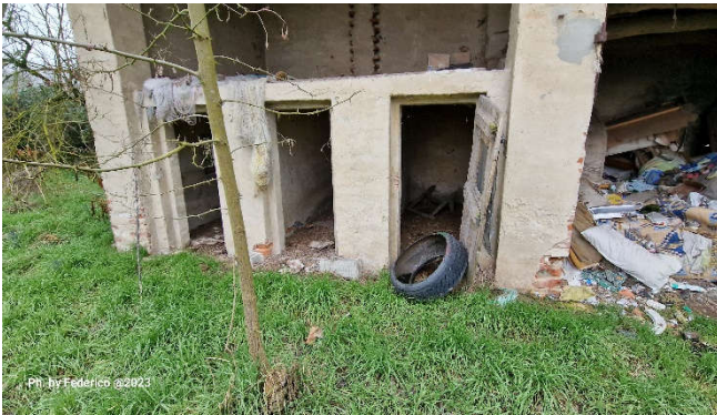
11. Esterno fabbricato