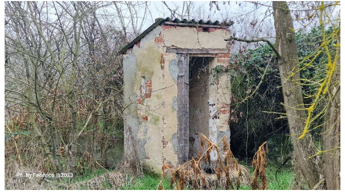
10. Servizio igienico