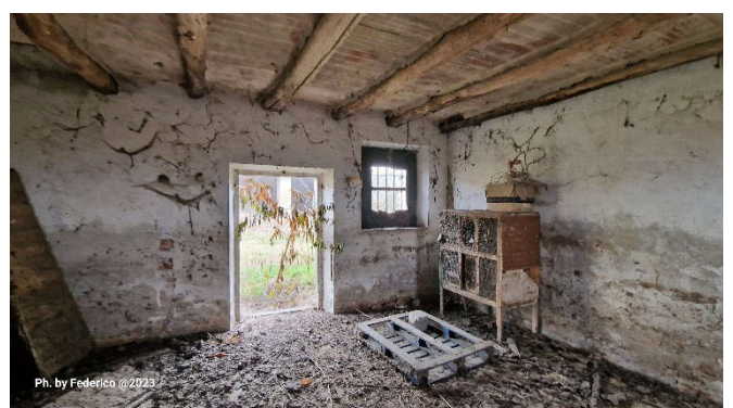
16. Interno mangiatoia