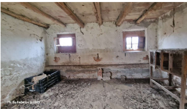
15. Interno mangiatoia