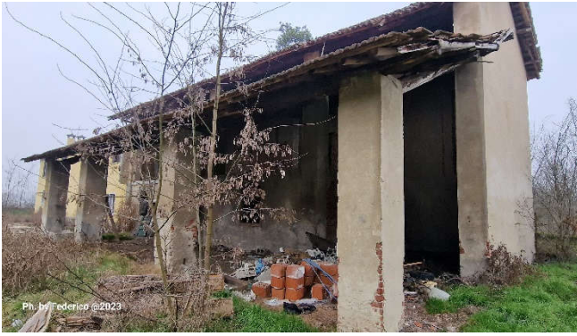
9. Esterno fabbricato