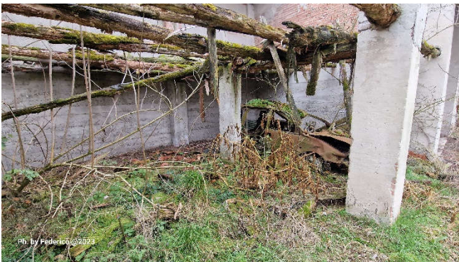
13. Particolare degrado