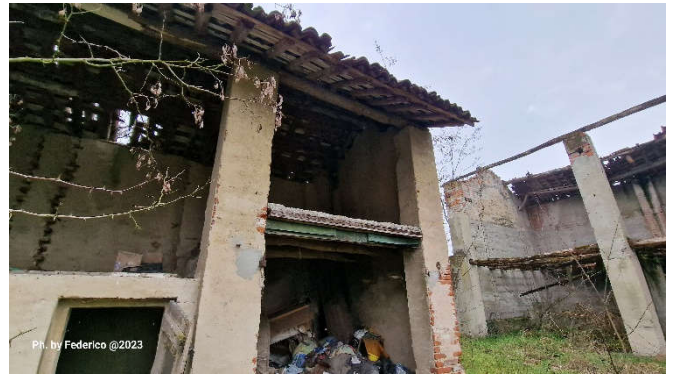
12. Esterno fabbricato con dettaglio copertura