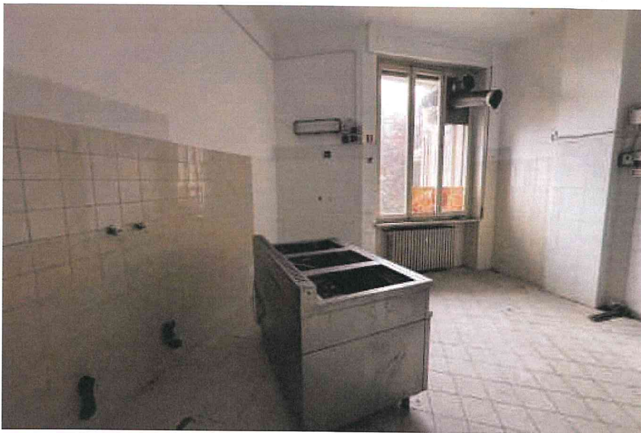
Sopra e sotto - interno del locale cucina del ristorante-pizzeria - (foto del 25.10.24)