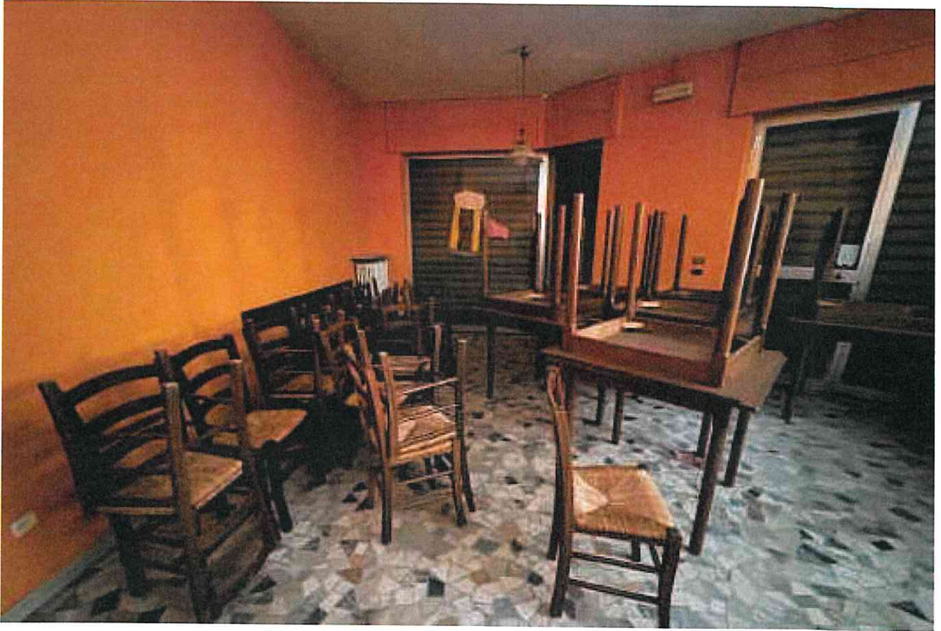
Sopra e sotto - interno del salone ristorante-pizzeria - (foto del 25.10.24)