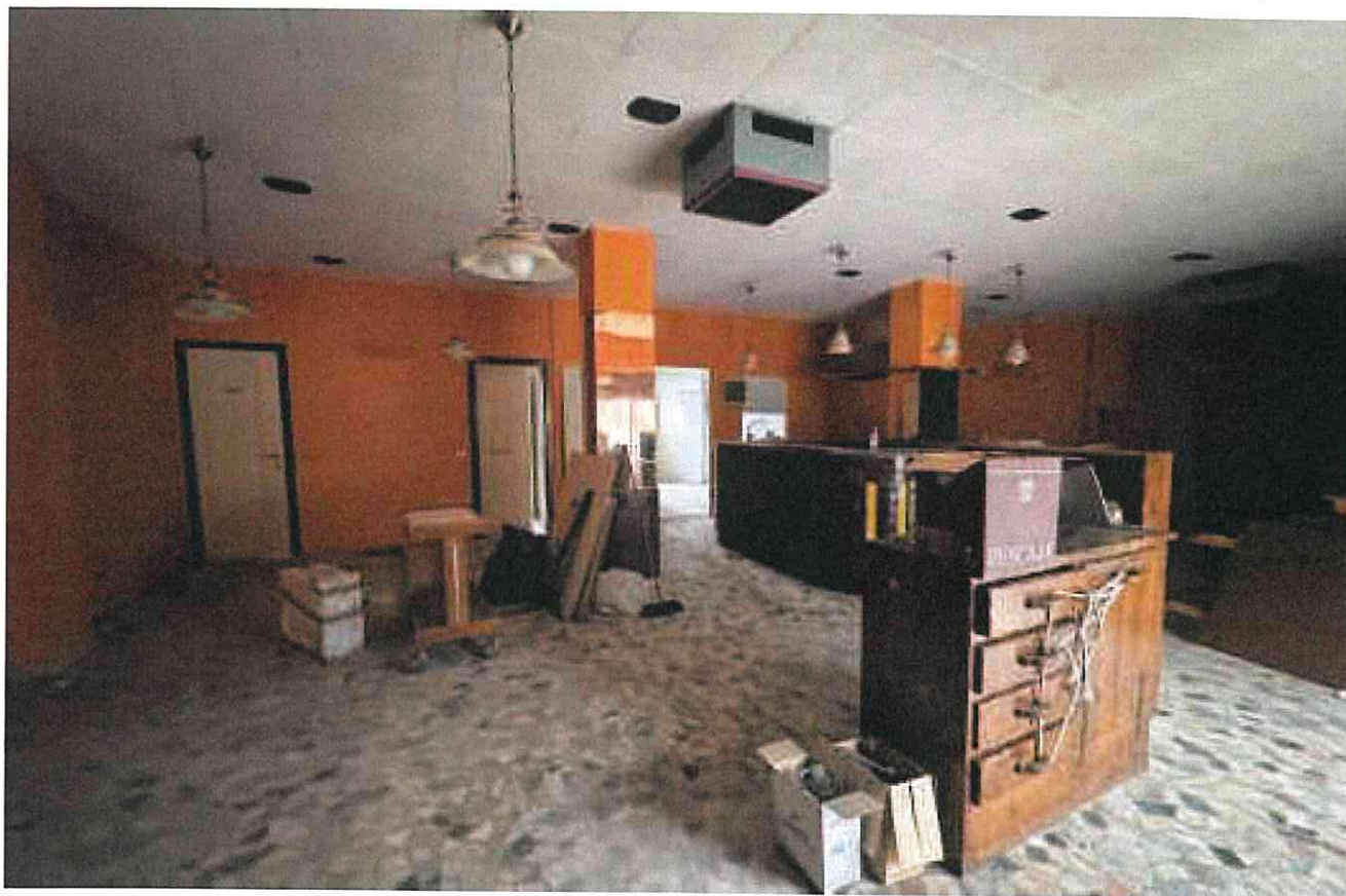
Sopra e sotto - interno del salone ristorante-pizzeria - (foto del 25.10.24)