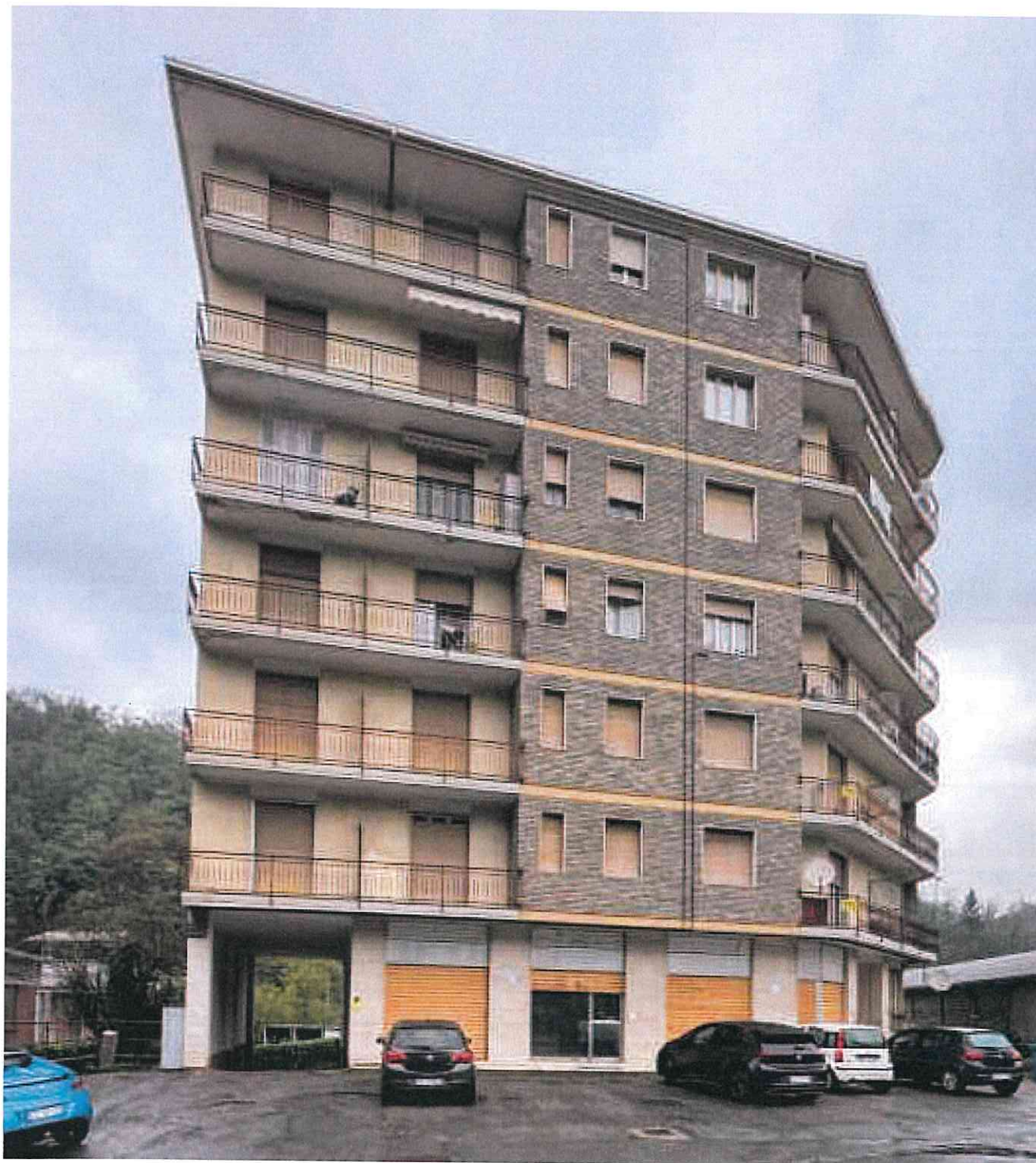
Le vetrine dell'immobile commerciale pignorato su fronte strada del condominio - (foto del 25.10.24)

Luca Villani Architetto Volto dei Centori n° 17 - 13100 Vercelli - Telefono 0161/215556-215150 e-mail: luca.villani@studiovillani.it - Cod. Fisc.: VLL LCU 60D18 L750H - P. I.V.A.: 01434900021 - Iscritto all'Albo professionale dell'Ordine degli Architetti della Provincia di Vercelli al n° 221 dal 13.02.1986 - Iscritto alla Cassa Nazionale di Previdenza ed Assistenza per gli Ingegneri ed Architetti al n° 321285 C - Iscritto all'Albo dei Consulenti Tecnici del Tribunale di Vercelli al n. 96 dal 06.12.1989