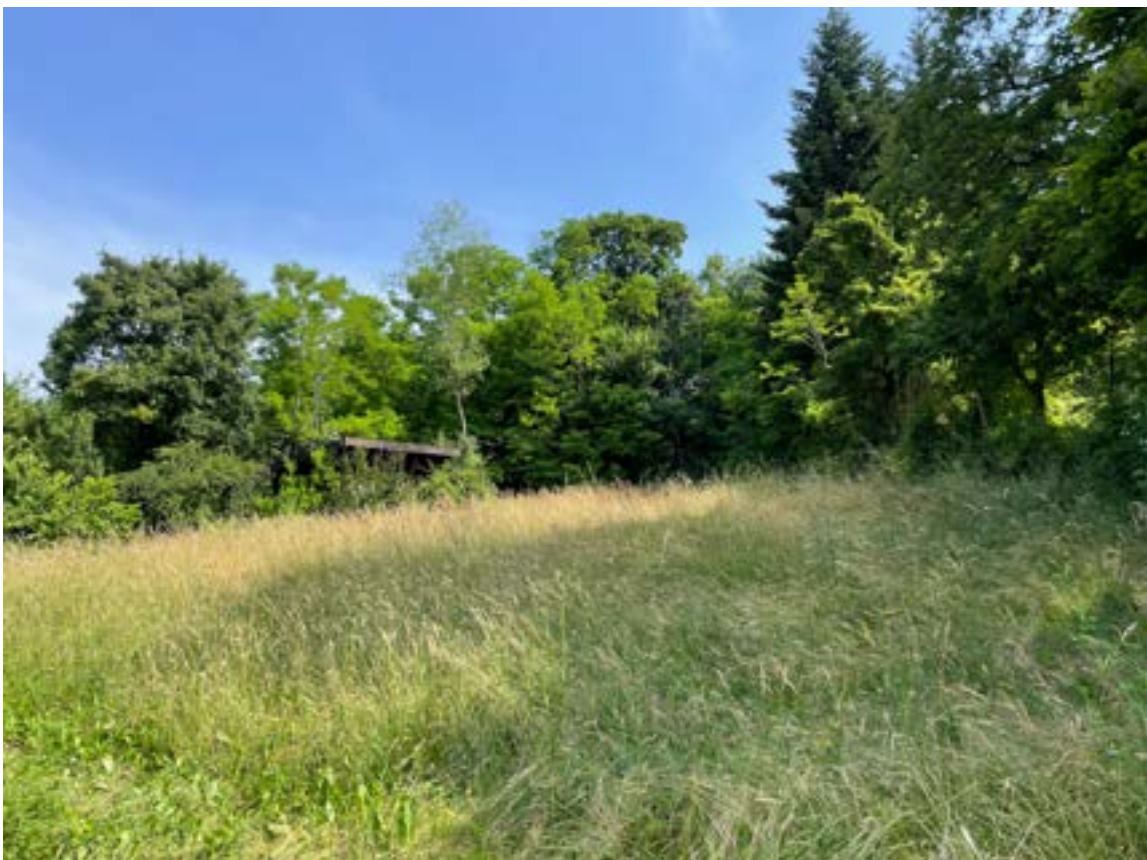
FOTO 32 – Bene 5 (Terreno fg. 24, mapp. 20): vista dalla strada comunale