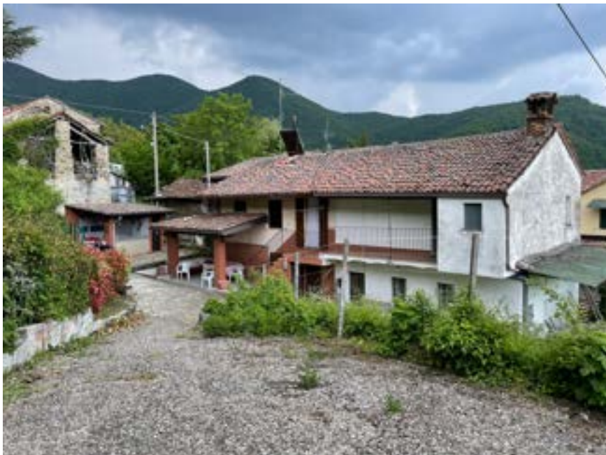
FOTO 1 – BENE 1 e 2: vista dal passaggio carraio (fg.24-mapp.360)