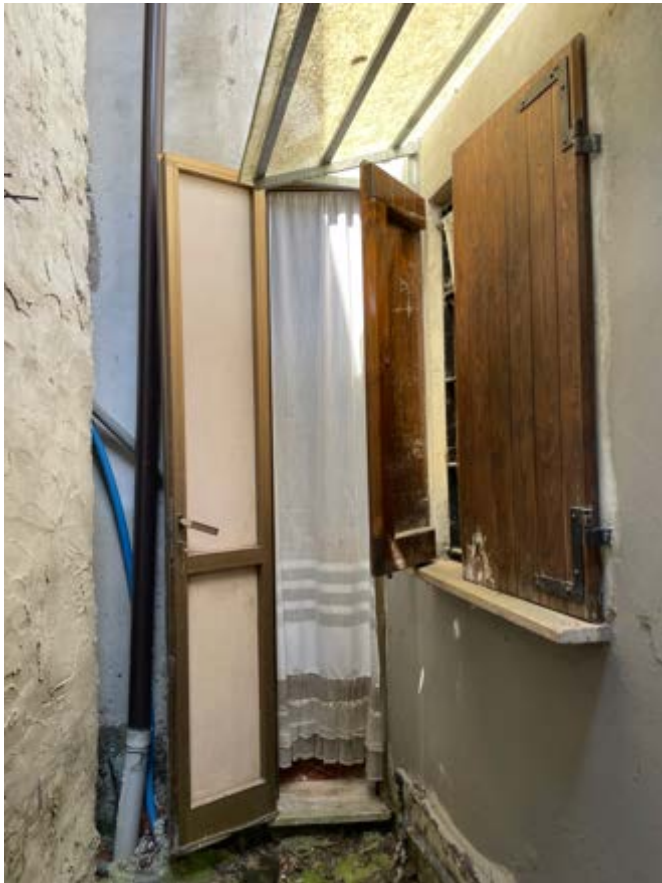
FOTO 21 - cavedio