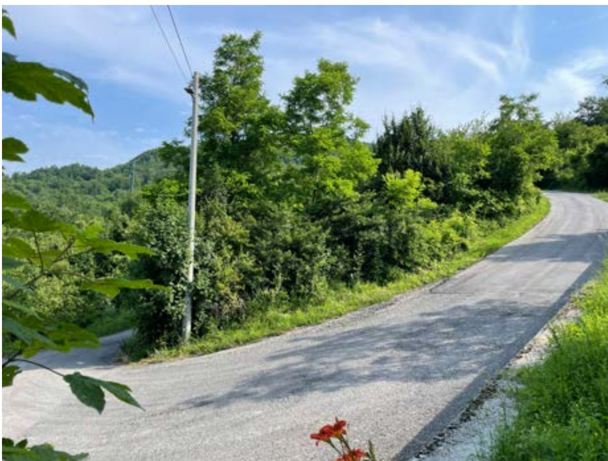
FOTO 30 – Bene 4 (terreno fg. 24, mapp. 138): vista taglio strada nuova