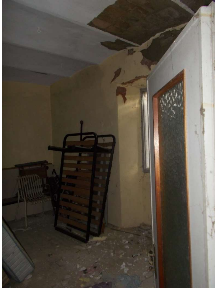
5. Particolare interno locali abitativi