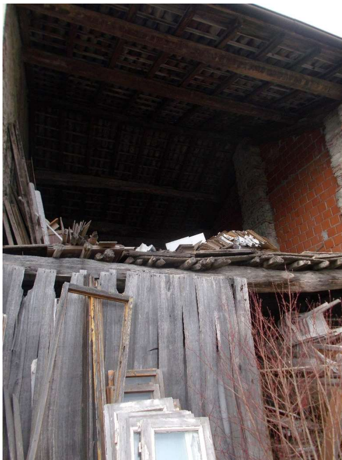
3. Particolare rustico attiguo il fabbricato abitativo