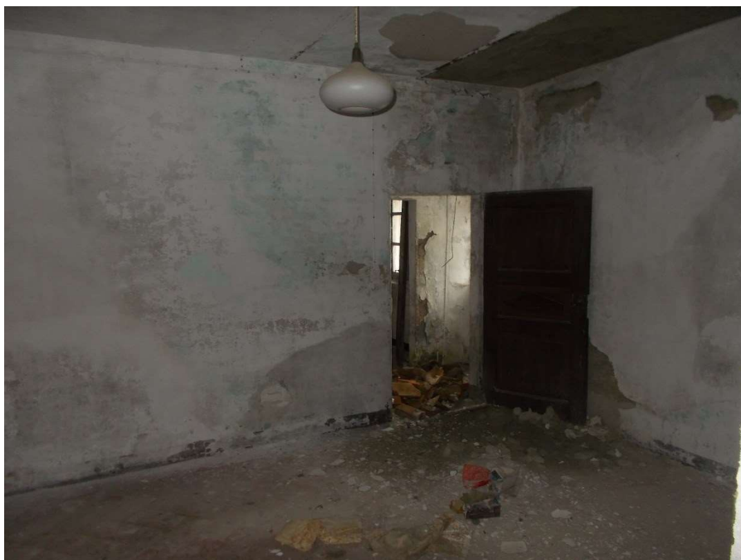
4. Particolare interno locali abitativi