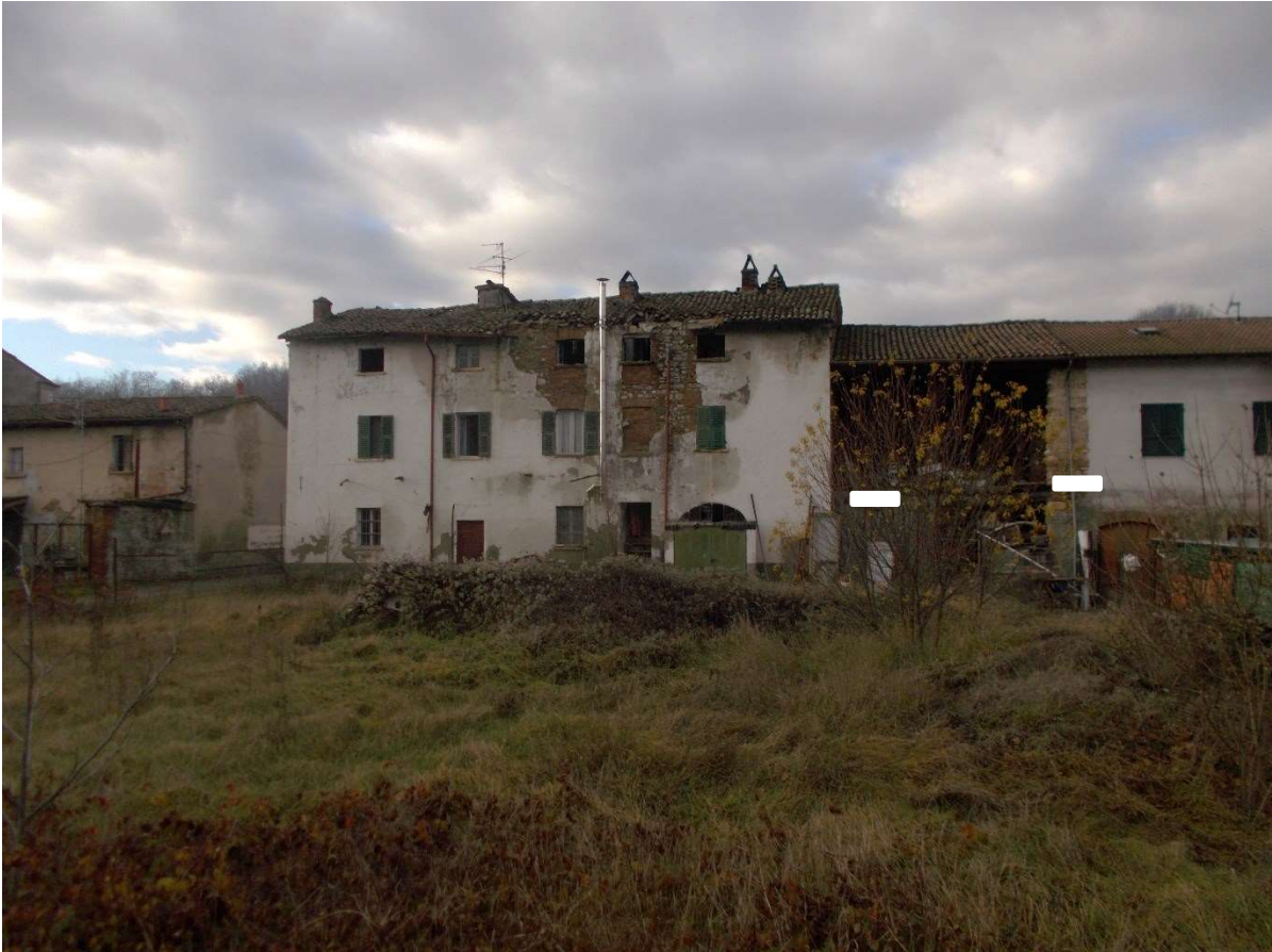
1. Fabbricato ad uso civile abitazione con rustico attiguo e sedime cortilizio - particolare prospetto est