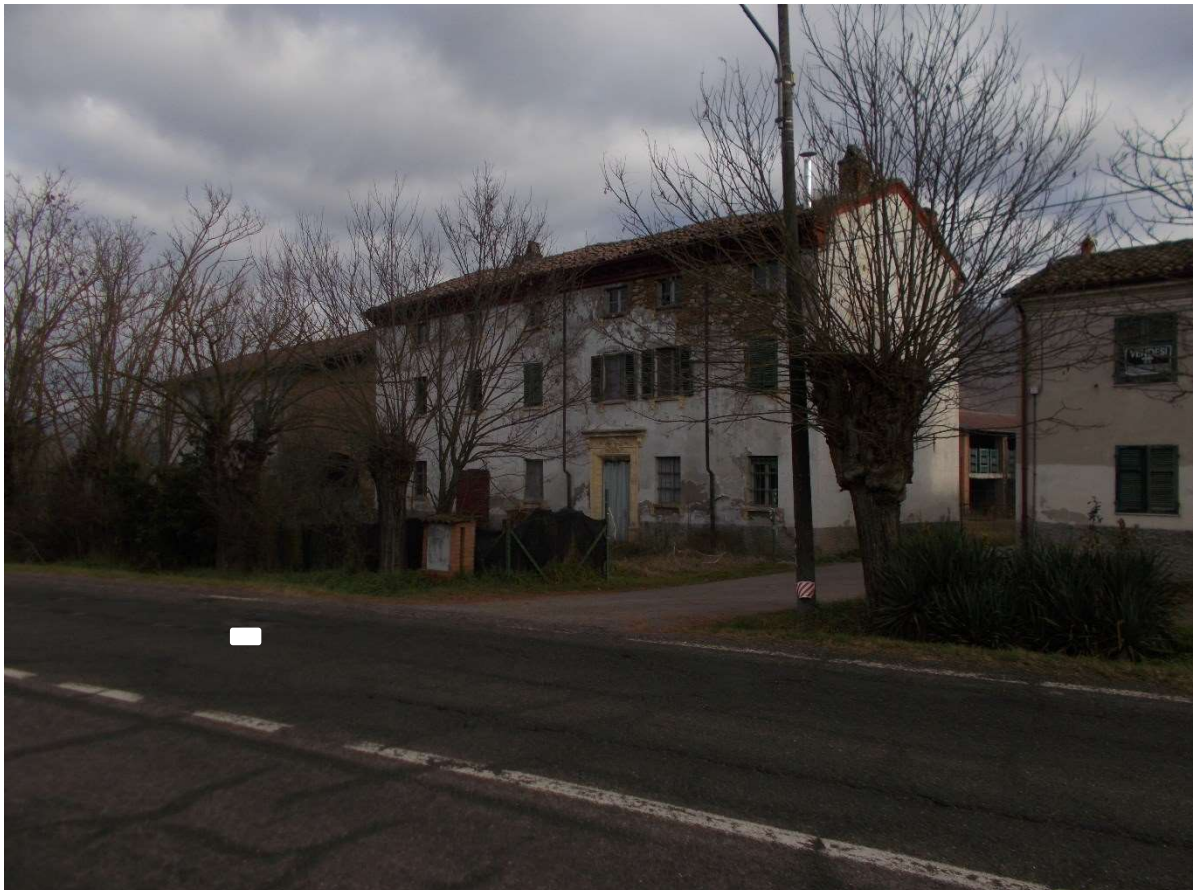
2. Fabbricato ad uso civile abitazione con sedime cortilizio - particolare prospetto ovest