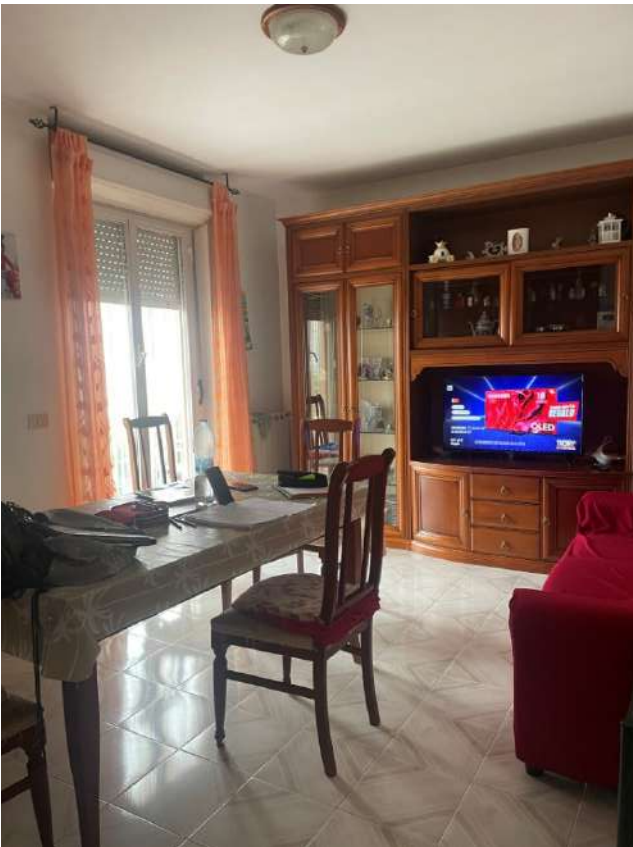
Figura 6. LOTTO UNICO: Immobile pignorato al F. 8, P.IIa 22, Sub. 16 ubicato in San Ferdinando di Puglia (BT) alla Via Palmiro Togliatti n. 62 (soggiorno/pranzo).