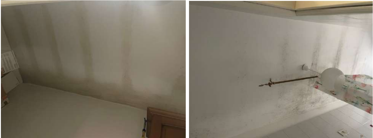
Figura 13. LOTTO UNICO: Immobile pignorato al F. 8, P.IIa 22, Sub. 16 ubicato in San Ferdinando di Puglia (BT) alla Via Palmiro Togliatti n. 62 (efflorescenze, fioriture e macchie di umidità).