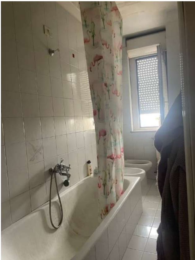
Figura 10. LOTTO UNICO: Immobile pignorato al F. 8, P.IIa 22, Sub. 16 ubicato in San Ferdinando di Puglia (BT) alla Via Palmiro Togliatti n. 62 (bagno).