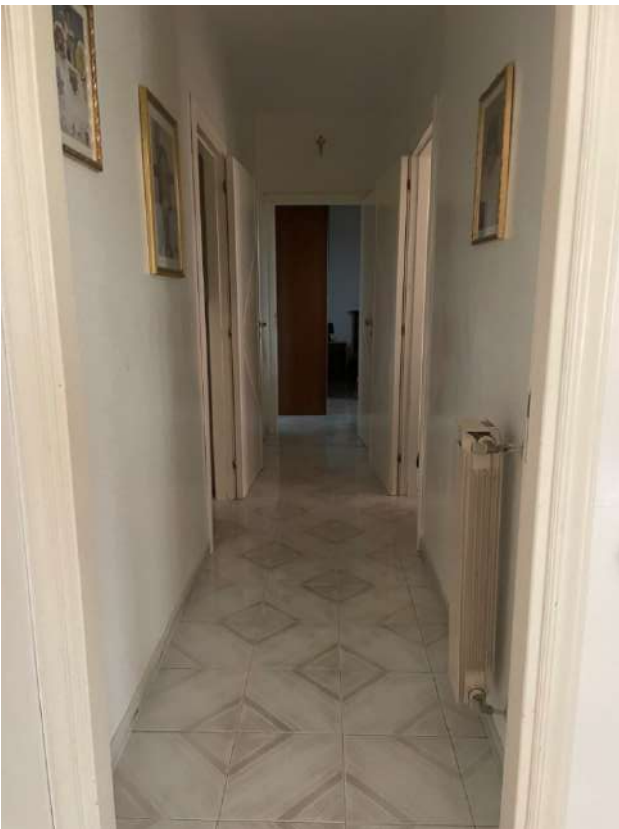
Figura 8. LOTTO UNICO: Immobile pignorato al F. 8, P.IIa 22, Sub. 16 ubicato in San Ferdinando di Puglia (BT) alla Via Palmiro Togliatti n. 62 (disimpegno).