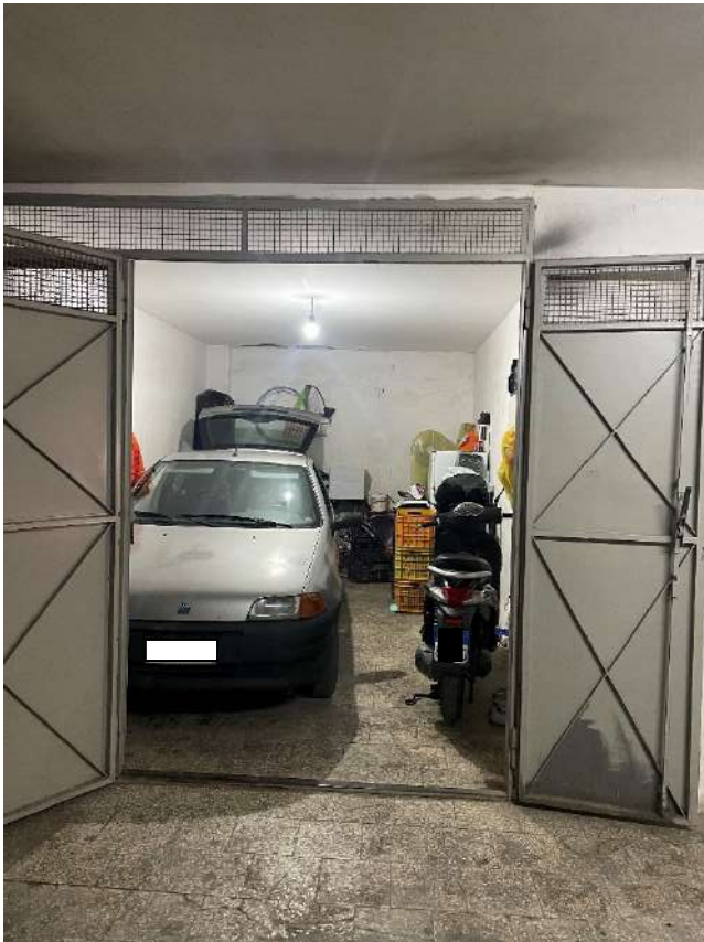
Figura 16. LOTTO UNICO: Immobile pignorato al F. 8, P.IIa 22, Sub. 51 ubicato in San Ferdinando di Puglia (BT) alla Via Palmiro Togliatti (interno box-auto).