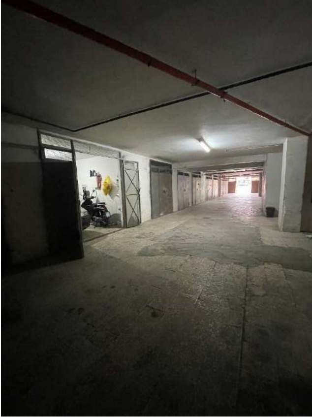
Figura 15. LOTTO UNICO: Immobile pignorato al F. 8, P.IIa 22, Sub. 51 ubicato in San Ferdinando di Puglia (BT) alla Via Palmiro Togliatti (corsia di manovra).