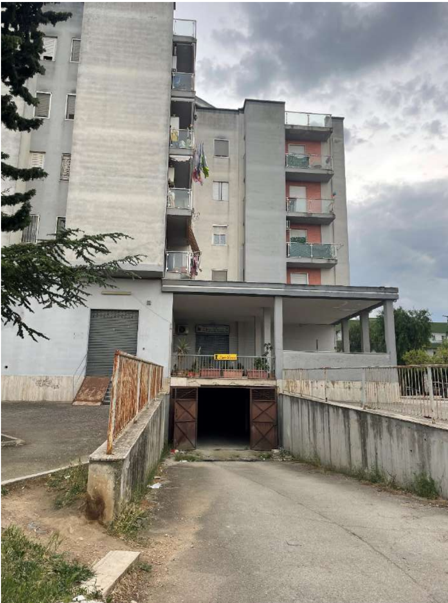
Figura 14. LOTTO UNICO: Immobile pignorato al F. 8, P.IIa 22, Sub. 51 ubicato in San Ferdinando di Puglia (BT) alla Via Palmiro Togliatti (accesso carrabile dalla rampa di discesa prospiciente Via P. Togliatti).