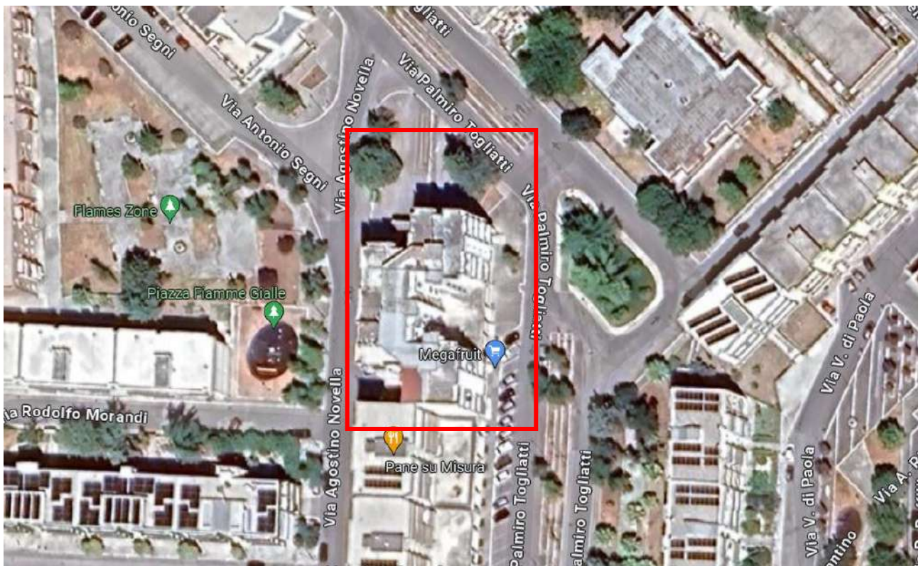
Figura 2. LOTTO UNICO: Ortofoto degli immobili pignorati al F. 8, P.lla 22, Sub. 16 e 51 ubicati in San Ferdinando di Puglia (BT) alla Via Palmiro Togliatti.