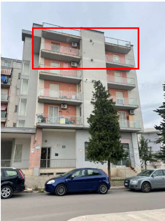
Figura 4. LOTTO UNICO: Fabbricato in cui si trova l'immobile pignorato al F. 8, P.IIa 22, Sub. 16 ubicato in San Ferdinando di Puglia (BT) alla Via Palmiro Togliatti n. 62.