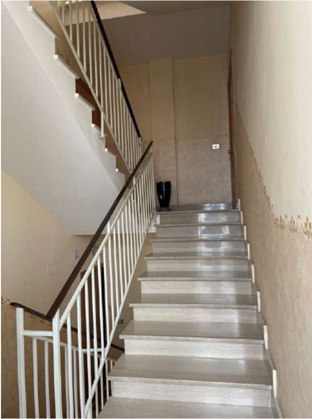
Figura 5. LOTTO UNICO: Immobile pignorato al F. 8, P.IIa 22, Sub. 16 ubicato in San Ferdinando di Puglia (BT) alla Via Palmiro Togliatti n. 62 (ingresso dal pianerottolo).