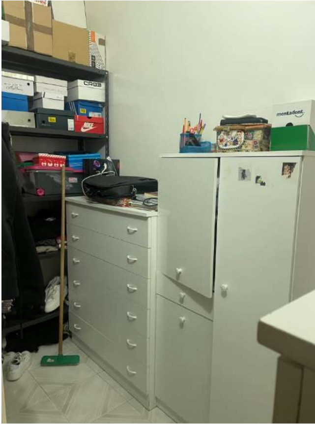
Figura 9. LOTTO UNICO: Immobile pignorato al F. 8, P.IIa 22, Sub. 16 ubicato in San Ferdinando di Puglia (BT) alla Via Palmiro Togliatti n. 62 (ripostiglio).