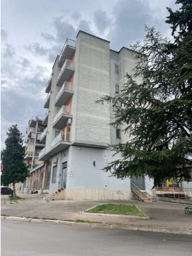
Figura 3. LOTTO UNICO: Fabbricato in cui si trovano gli immobili pignorati al F. 8, P.IIa 22, Sub. 16 e 51 ubicati in San Ferdinando di Puglia (BT) alla Via Palmiro Togliatti.