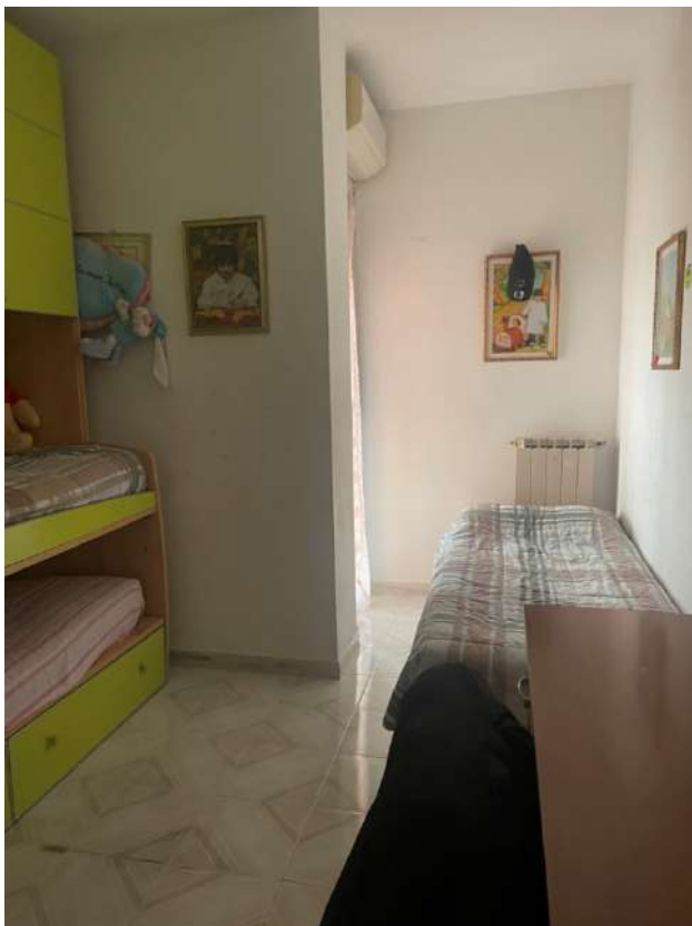
Figura 11. LOTTO UNICO: Immobile pignorato al F. 8, P.IIa 22, Sub. 16 ubicato in San Ferdinando di Puglia (BT) alla Via Palmiro Togliatti n. 62 (cameretta).