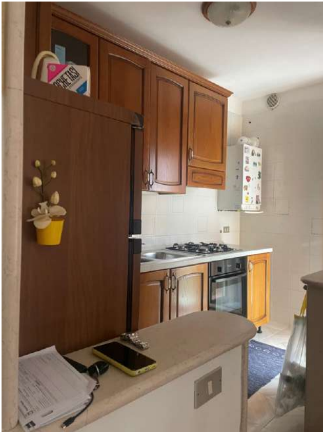
Figura 7. LOTTO UNICO: Immobile pignorato al F. 8, P.IIa 22, Sub. 16 ubicato in San Ferdinando di Puglia (BT) alla Via Palmiro Togliatti n. 62 (cucinino).