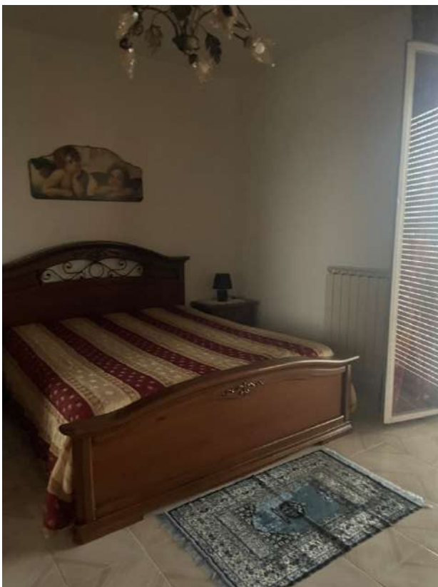
Figura 12. LOTTO UNICO: Immobile pignorato al F. 8, P.IIa 22, Sub. 16 ubicato in San Ferdinando di Puglia (BT) alla Via Palmiro Togliatti n. 62 (camera).