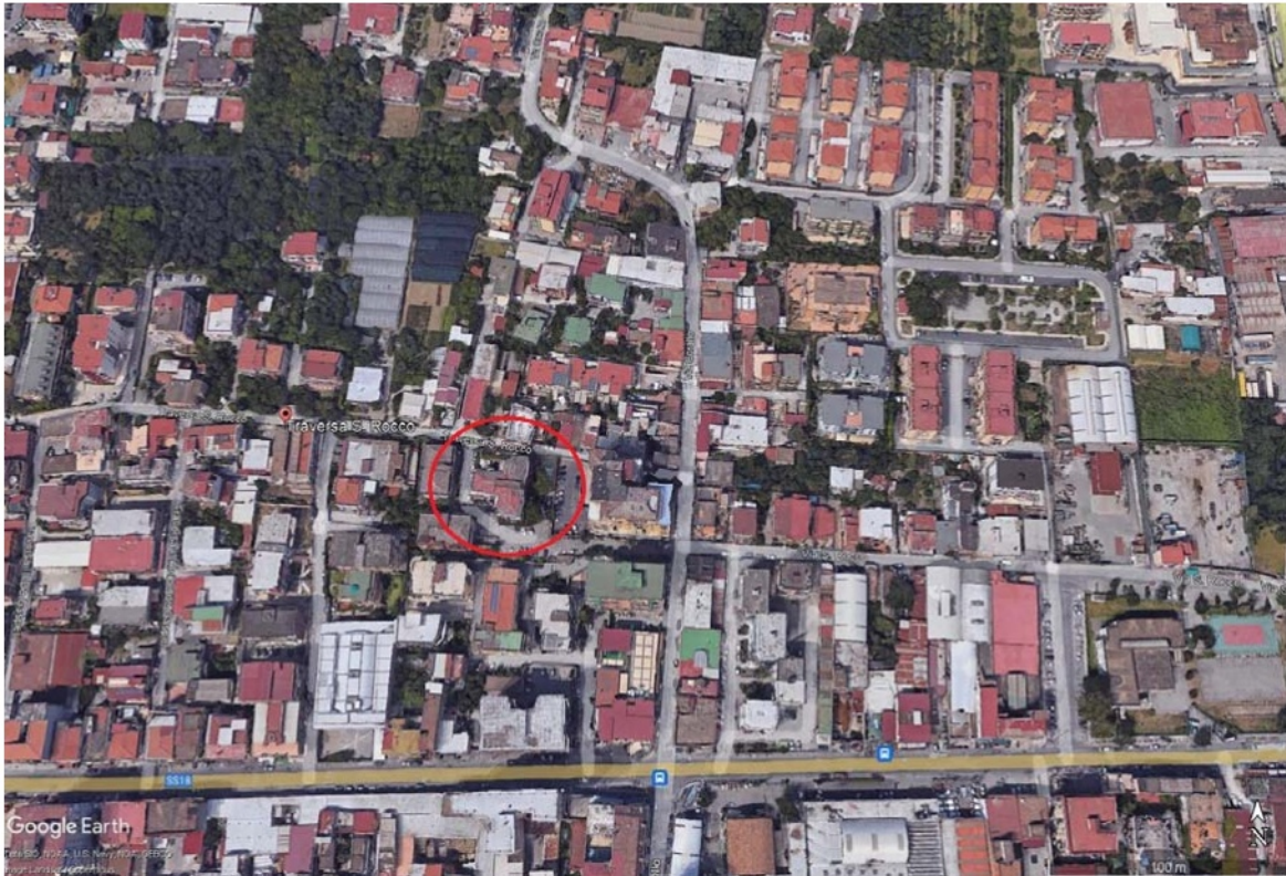
Ortofoto con indicazione del sito di ubicazione dei beni immobili in oggetto.