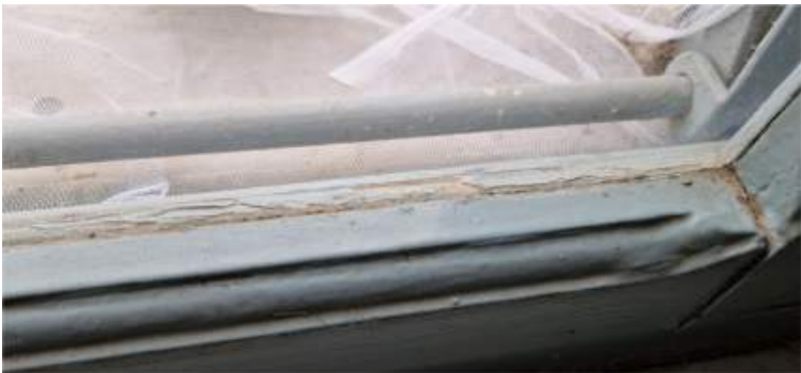
Particolare dei serramenti in legno