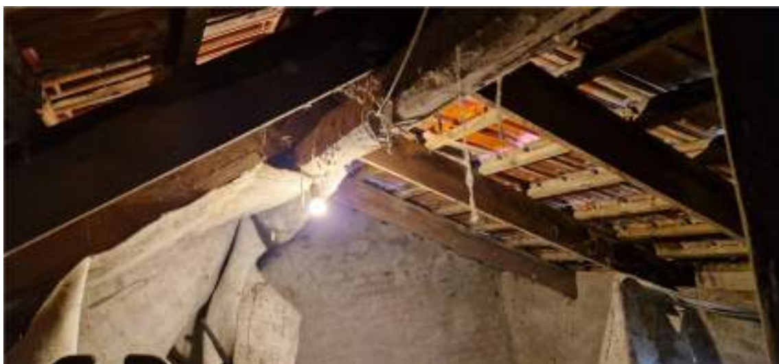
Viste del sottotetto