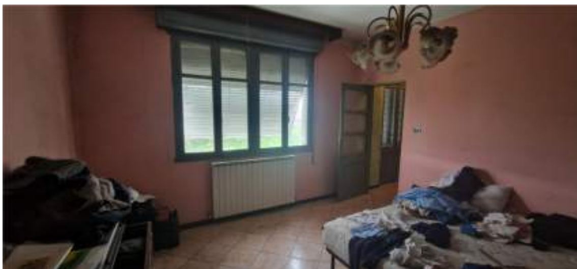
Vista della camera ad Est