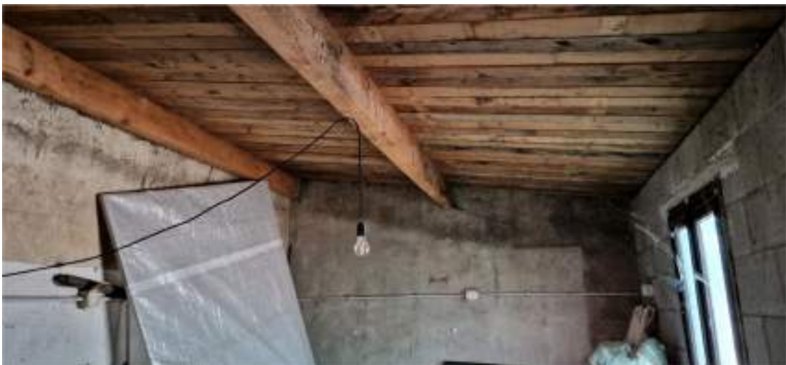
Viste del deposito adiacente all'abitazione