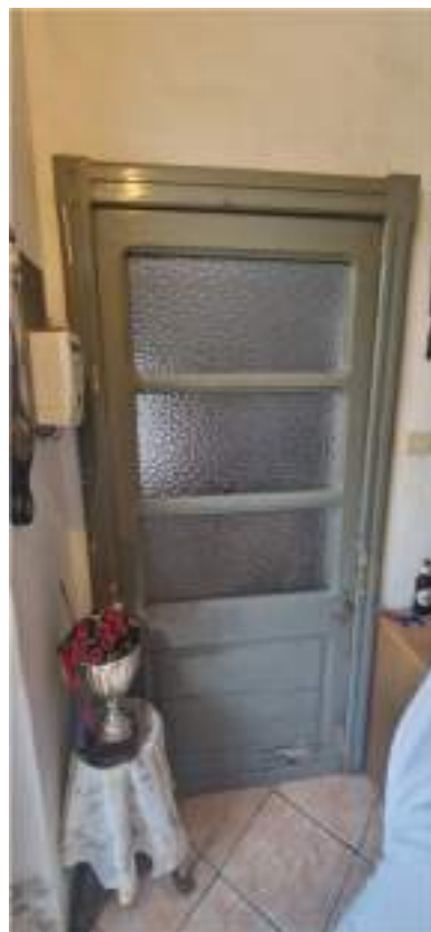
Particolare porta interna