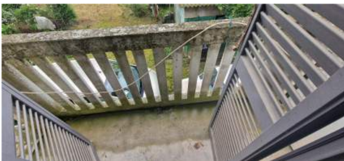
Vista del balcone