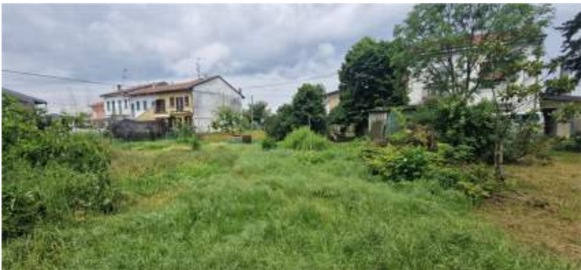
Vista del terreno a margine dell'edificio