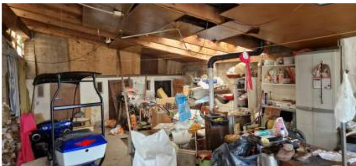
Viste della tettoia ad Est