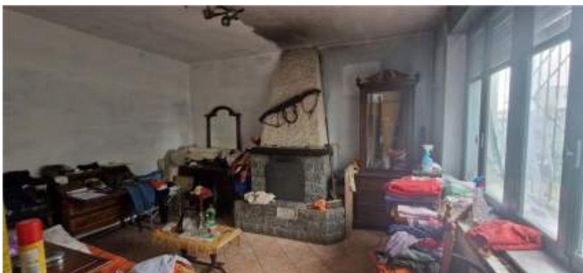
Vista della camera a piano terreno