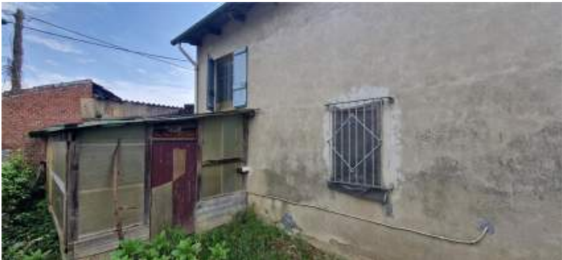
Vista del locale sgombero a Nord