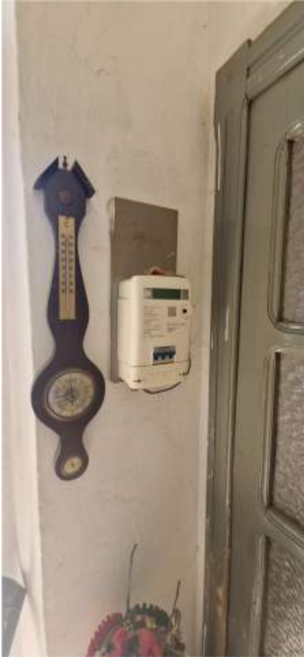
Vista del quadro elettrico