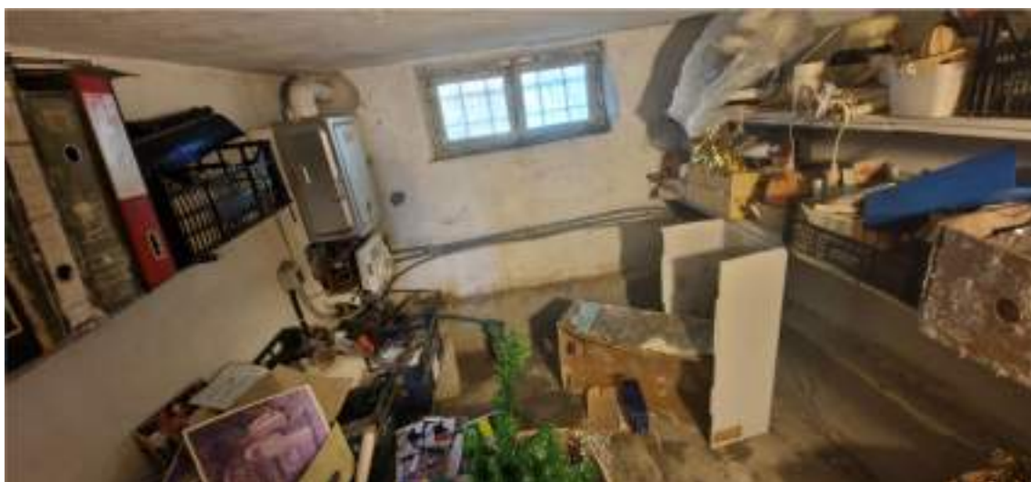
Vista della centrale termica