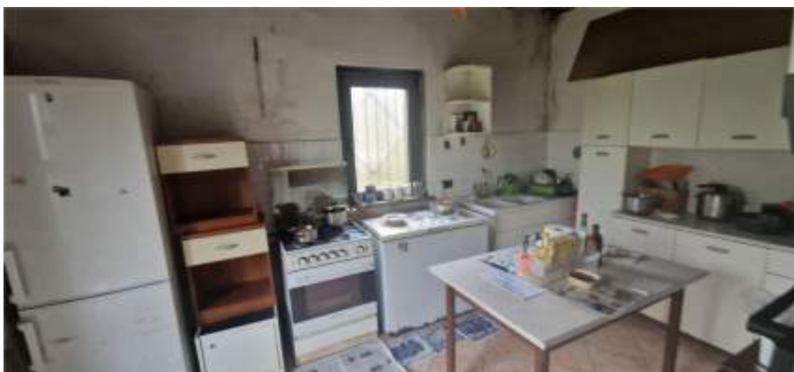
Vista della cucina