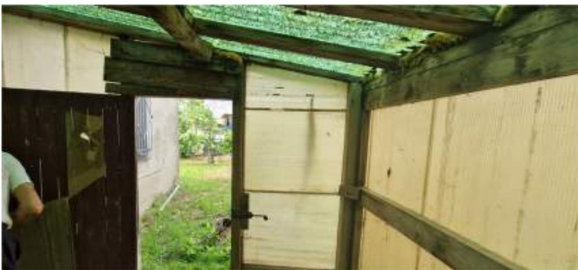
Viste del locale sgombero a Nord