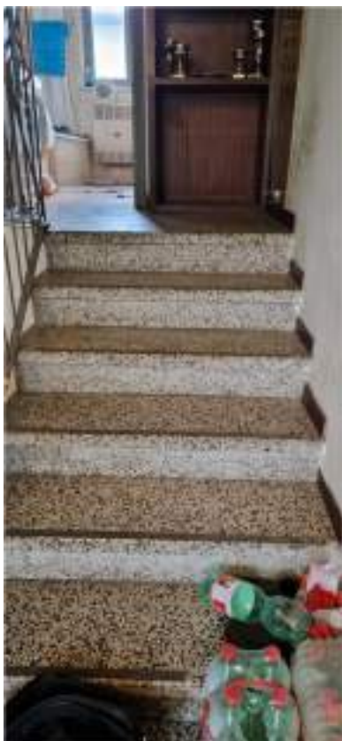
Scala di accesso ai livelli superiori