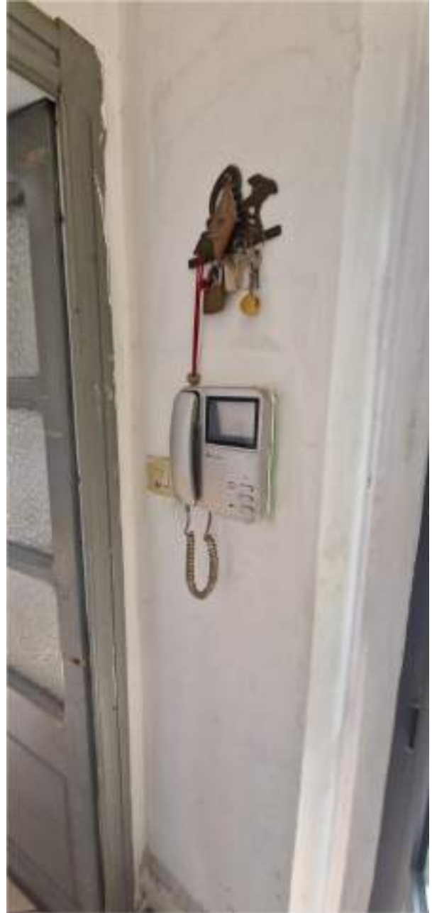
Vista del citofono