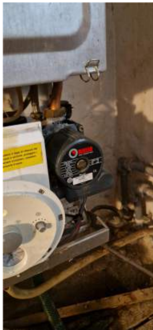
Viste del generatore di calore