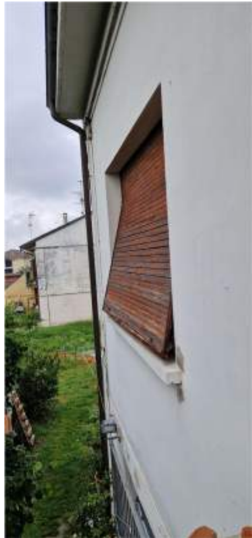
Vista degli avvolgibili