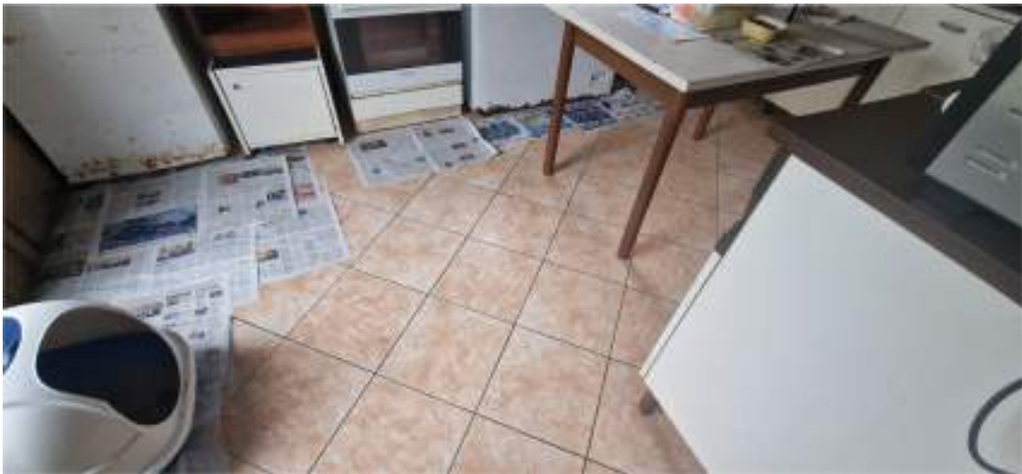
Pavimentazione interna dei locali