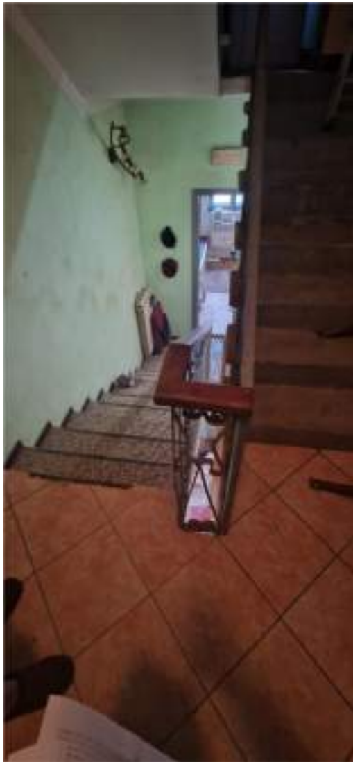
Vista del vano scale