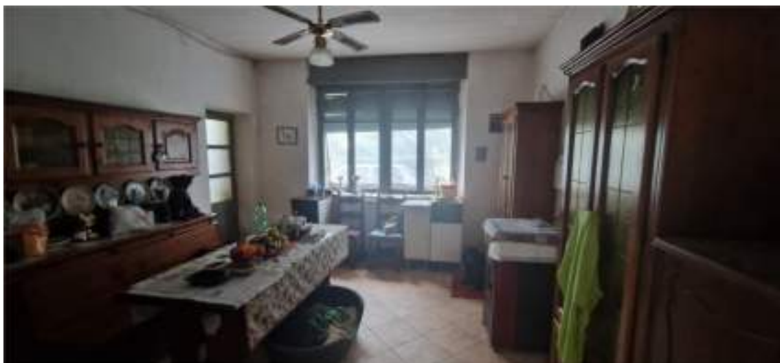
Vista del soggiorno