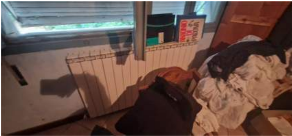
Vista della tipologia di radiatori