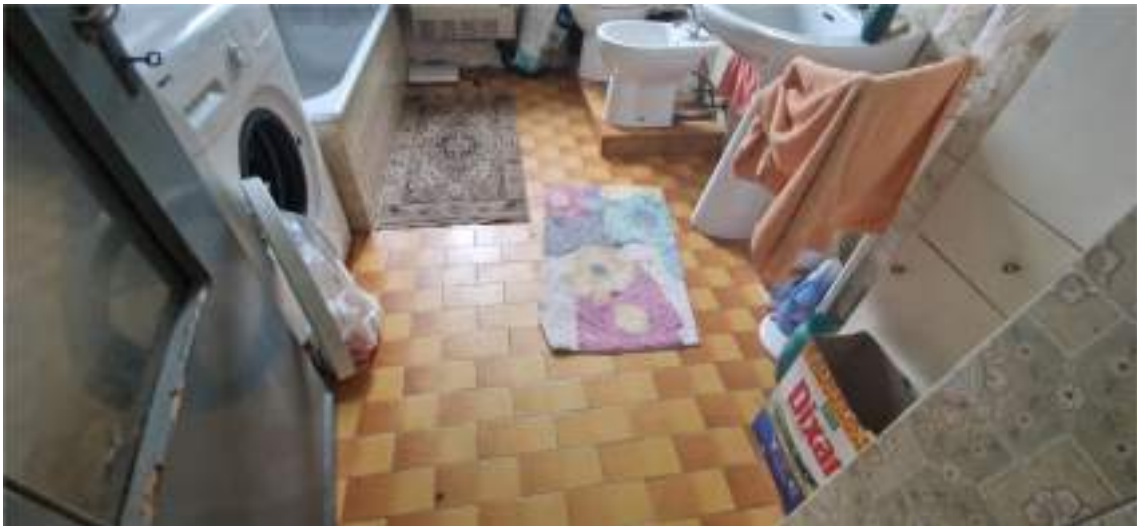
Pavimentazione del bagno