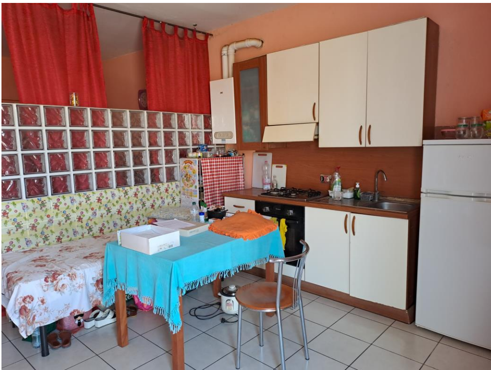
4. Vista del monocale