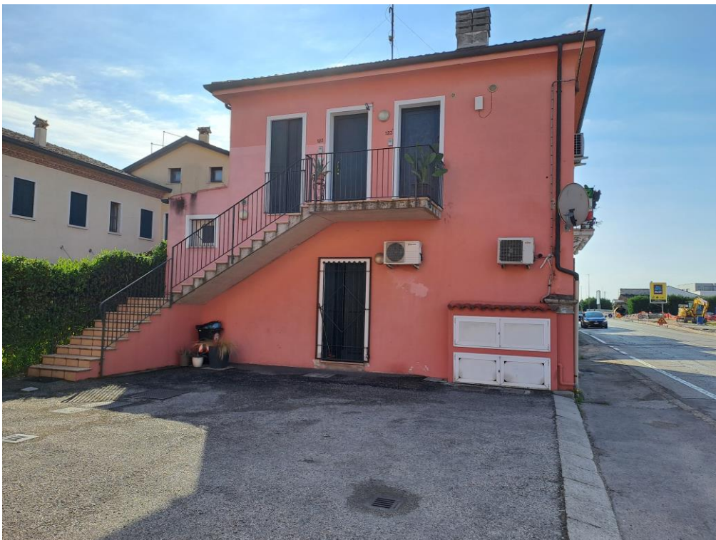
2. Vista generale da Sud – Ovest e del posto auto