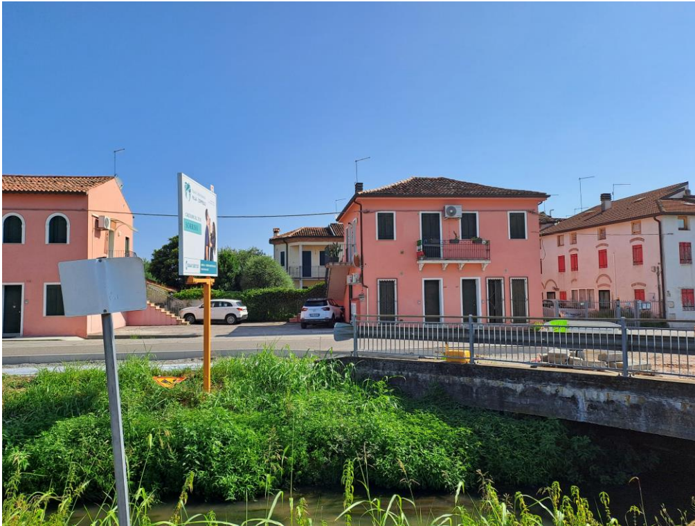
1. Vista generale da Sud