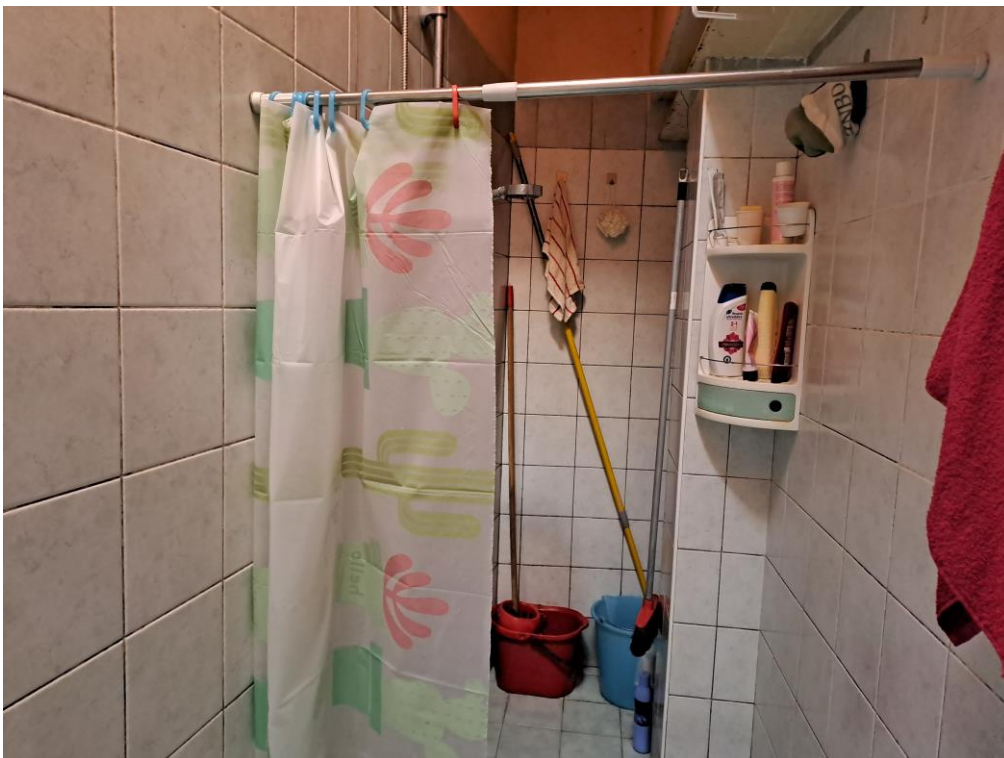
8. Vista del servizio igienico