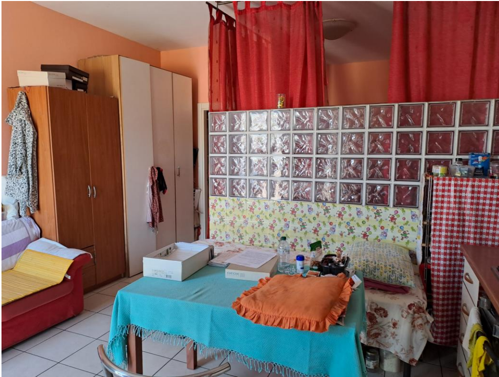
5. Vista del monolocale