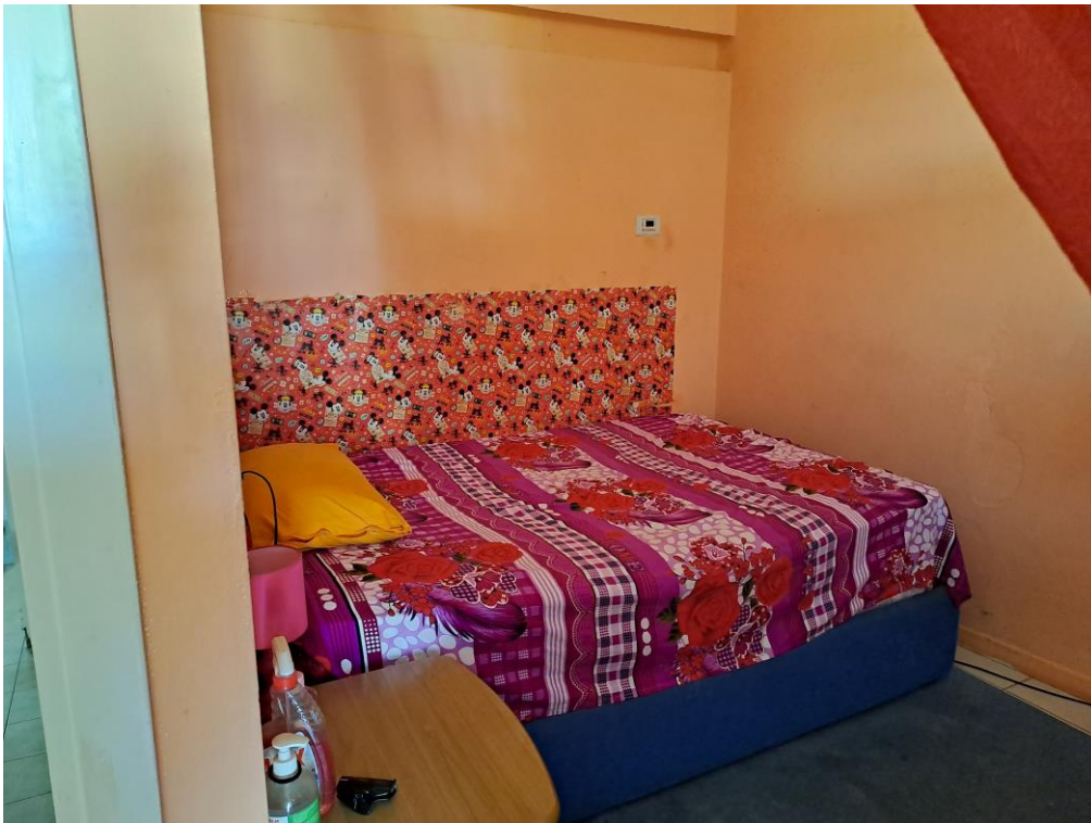
6. Vista del monolocale