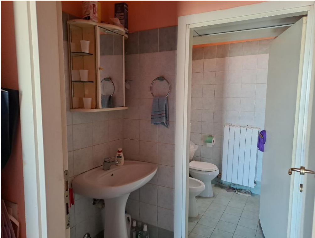
7. Vista dell'antibagno