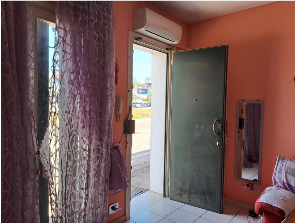
3. Vista del monocale