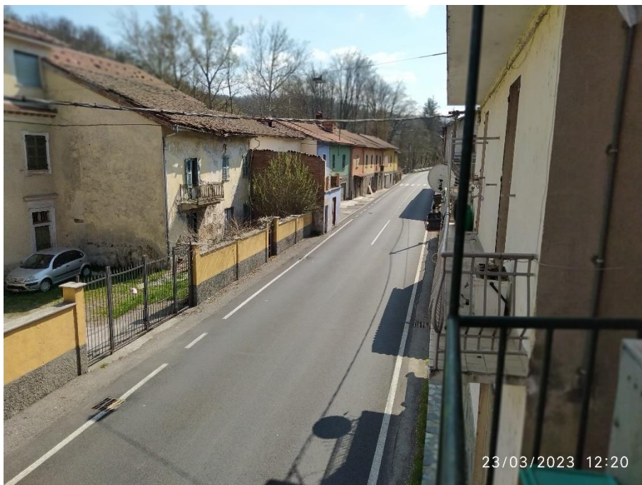
122043 - Piana Crixia, via Chiarlone 27 – vista dal balcone in direzione di Deگو

DOCUMENTAZIONE FOTOGRAFICA - TRIBUNALE DI SAVONA E.I. n°152/2022 R.G.