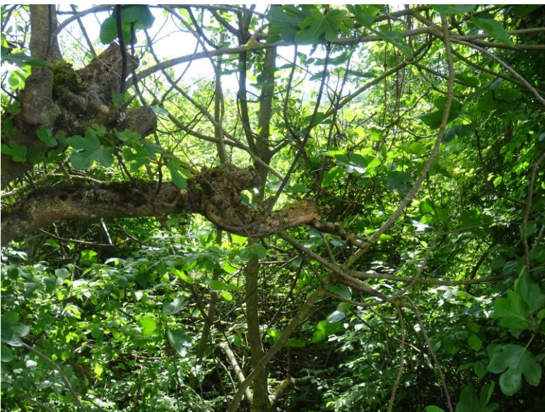
Fotografia n. 27 (mappale 80)