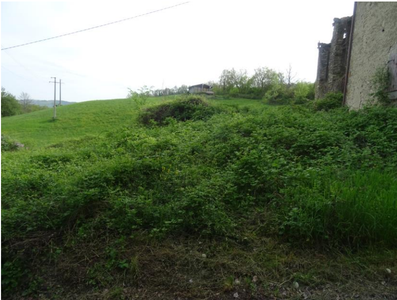
Fotografia n. 5