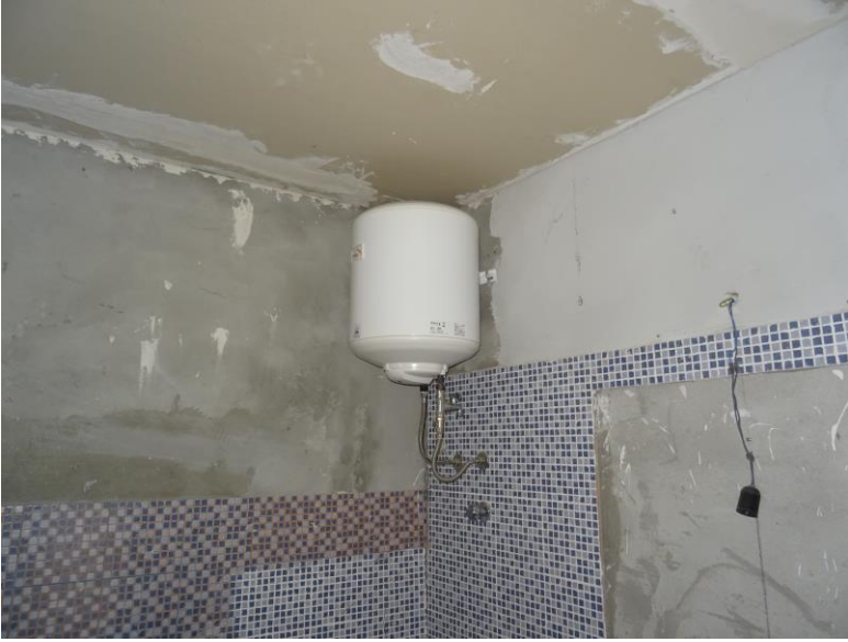
Fotografia n. 19