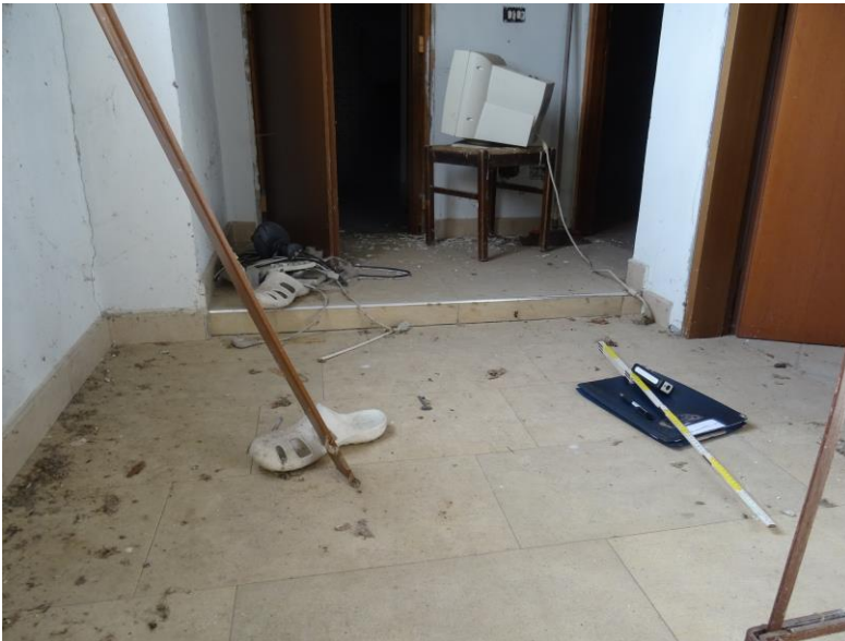
Fotografia n. 16