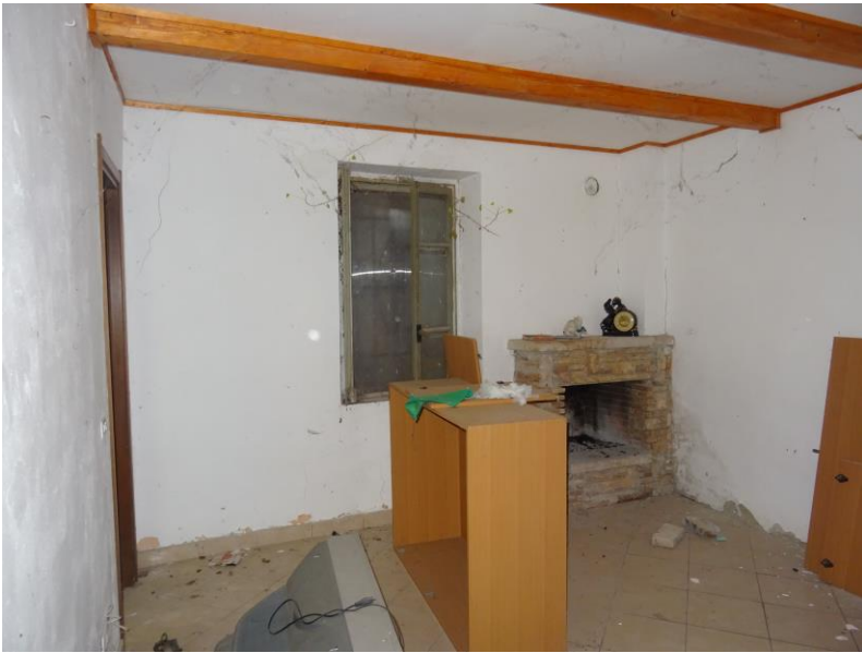
Fotografia n. 13