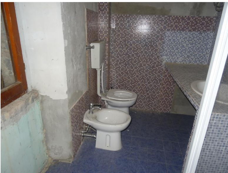
Fotografia n. 18