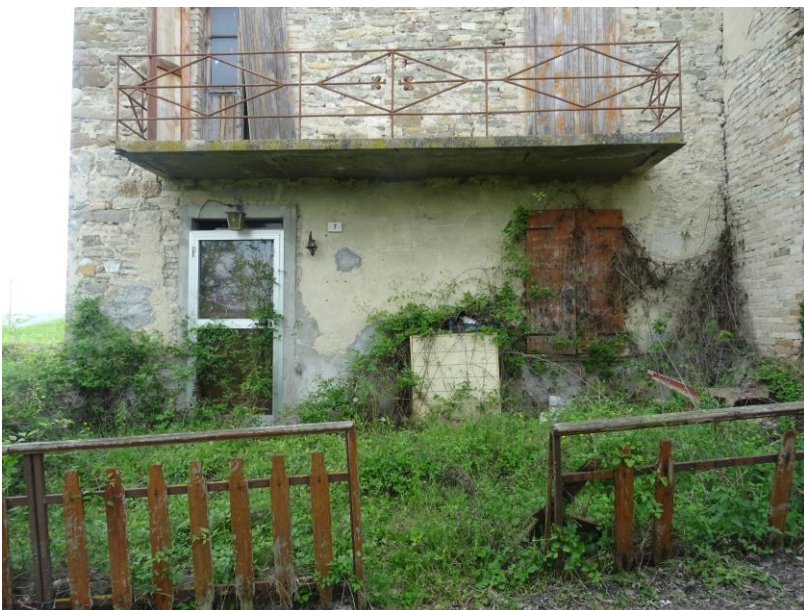
Fotografia n. 3