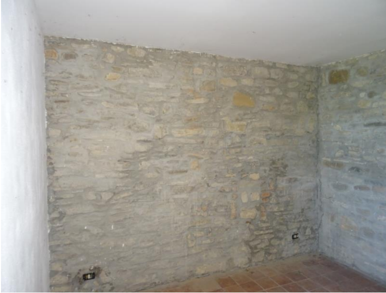
Fotografia n. 22