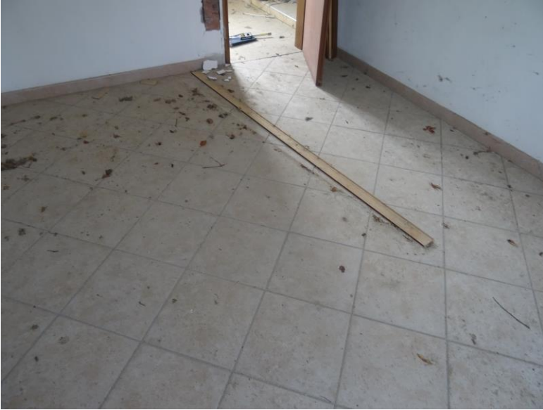
Fotografia n. 25