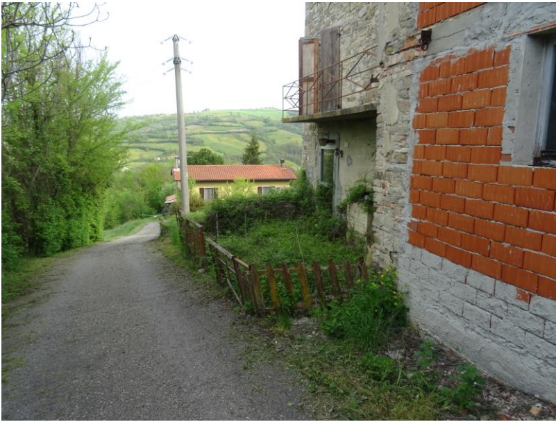
Fotografia n. 7