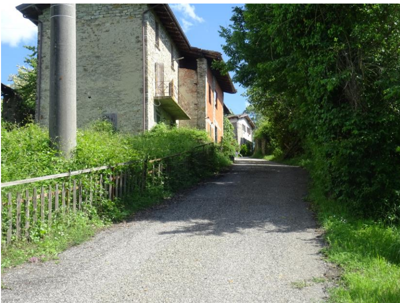
Fotografia n. 9