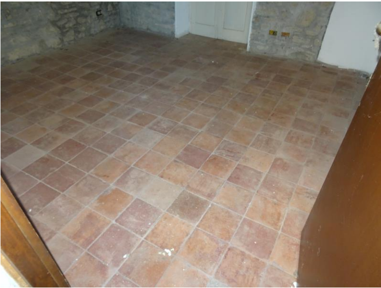
Fotografia n. 21