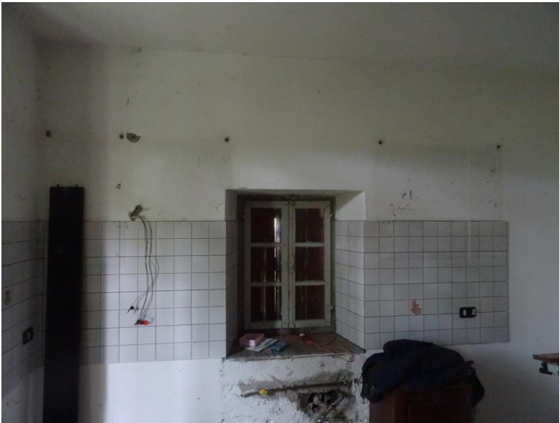
Fotografia n. 10