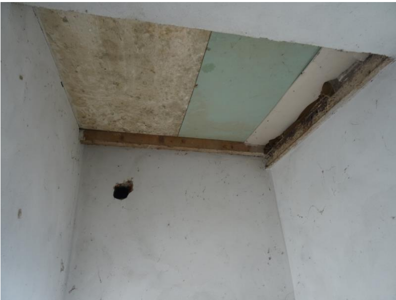
Fotografia n. 26 (mancanza scala per Accedere al piano sottotetto)