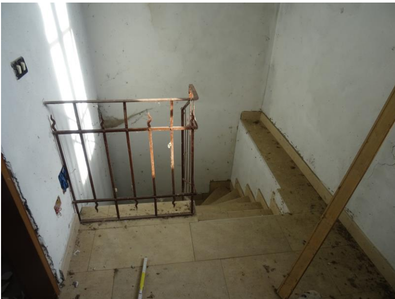
Fotografia n. 17