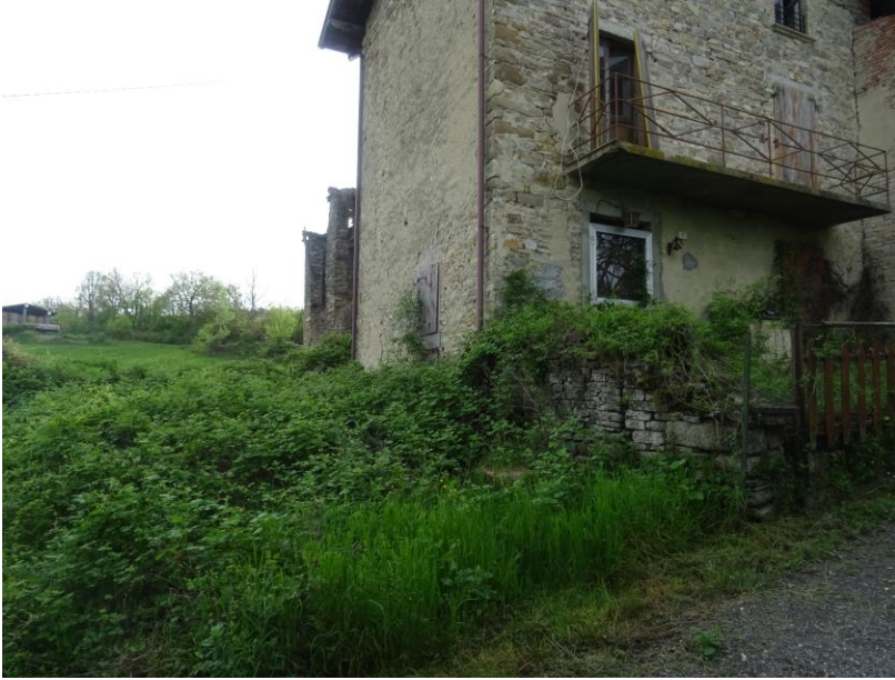
Fotografia n. 4