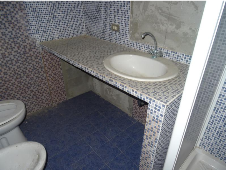
Fotografia n. 20