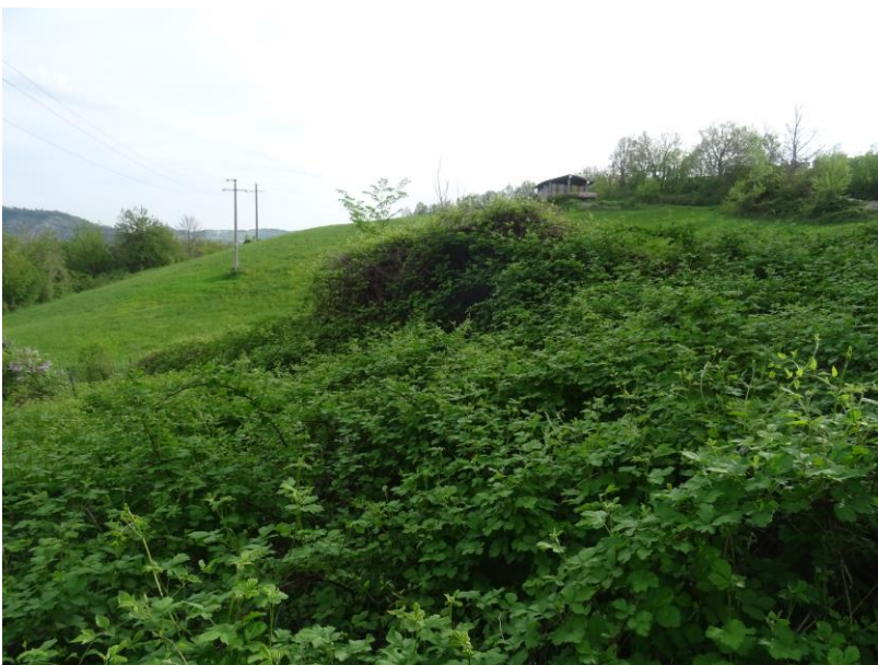
Fotografia n. 6