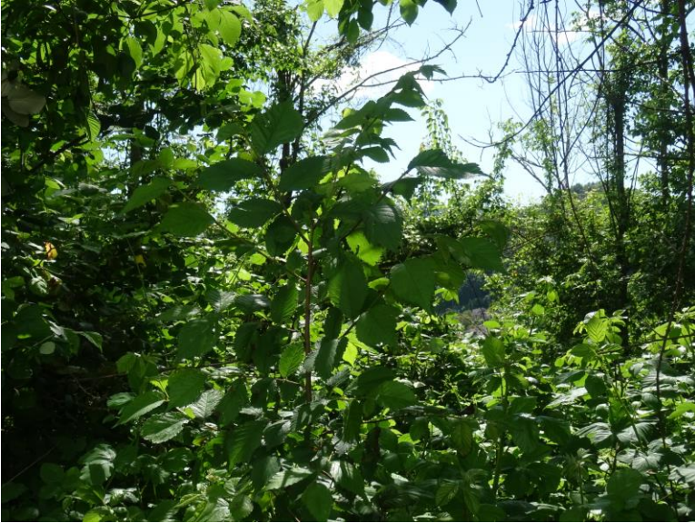
Fotografia n. 28 (mappale 80)