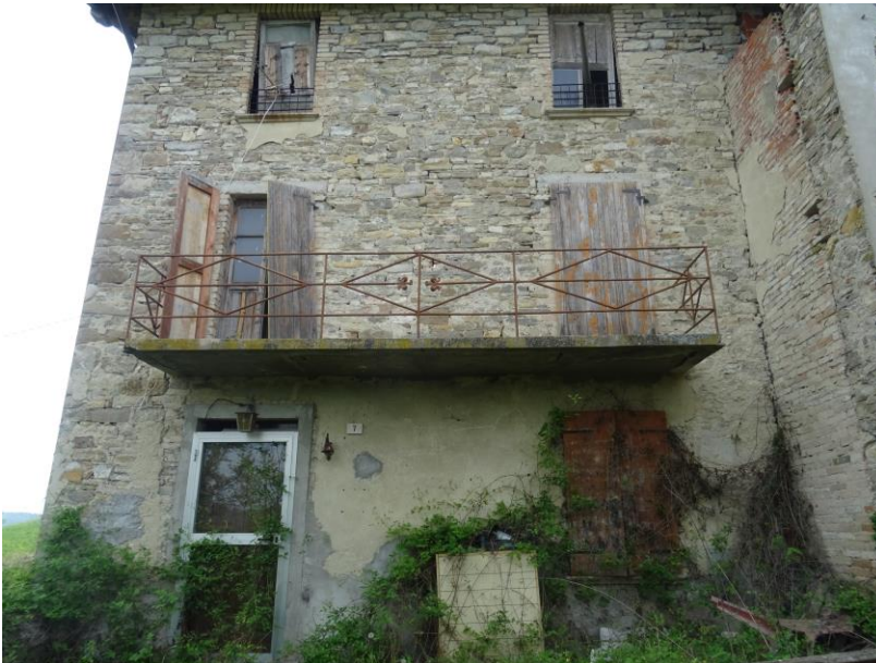
Fotografia n. 2