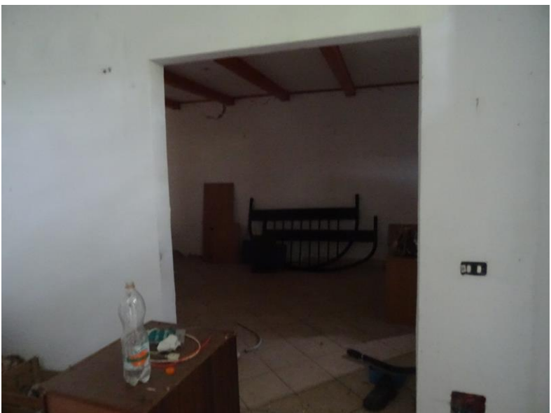
Fotografia n. 12