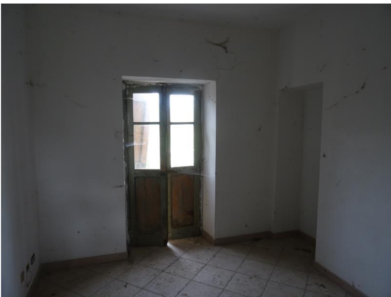
Fotografia n. 24