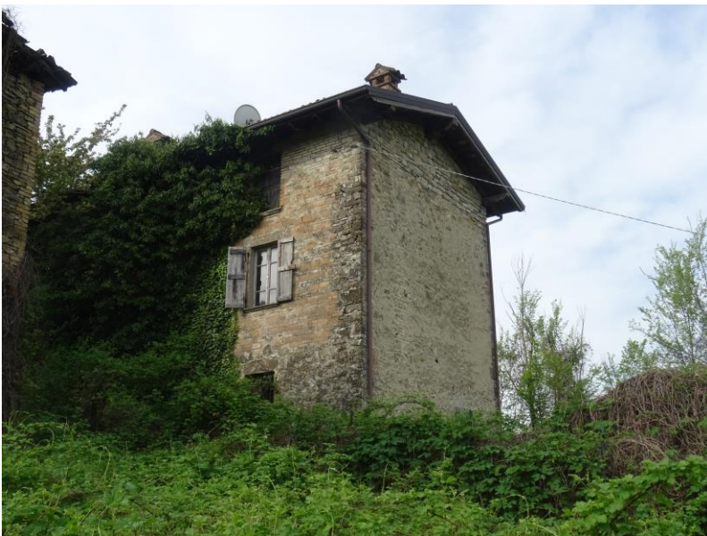
Fotografia n. 8