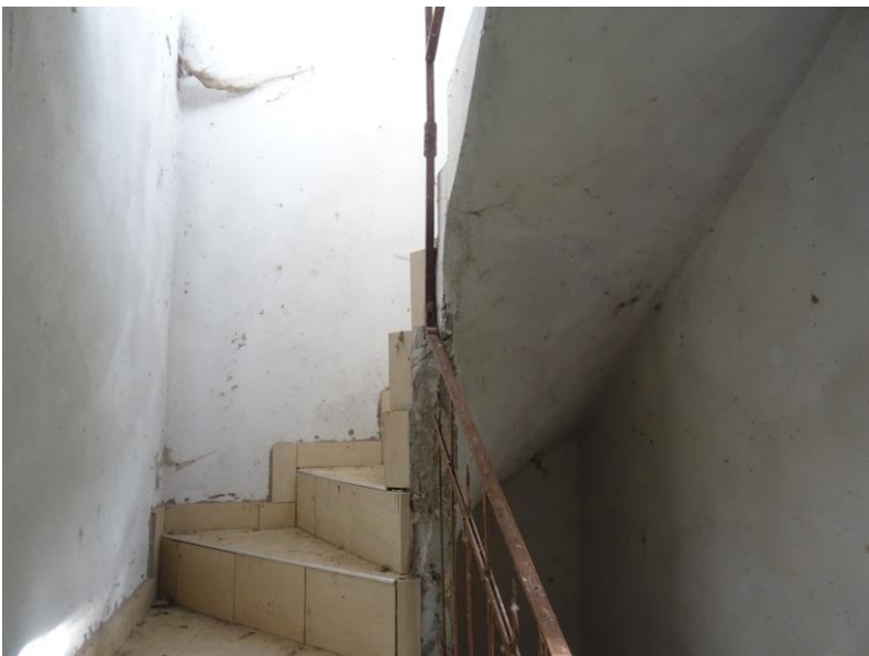
Fotografia n. 15