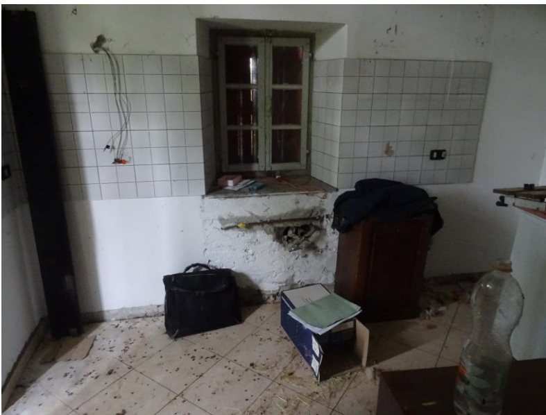
Fotografia n. 11