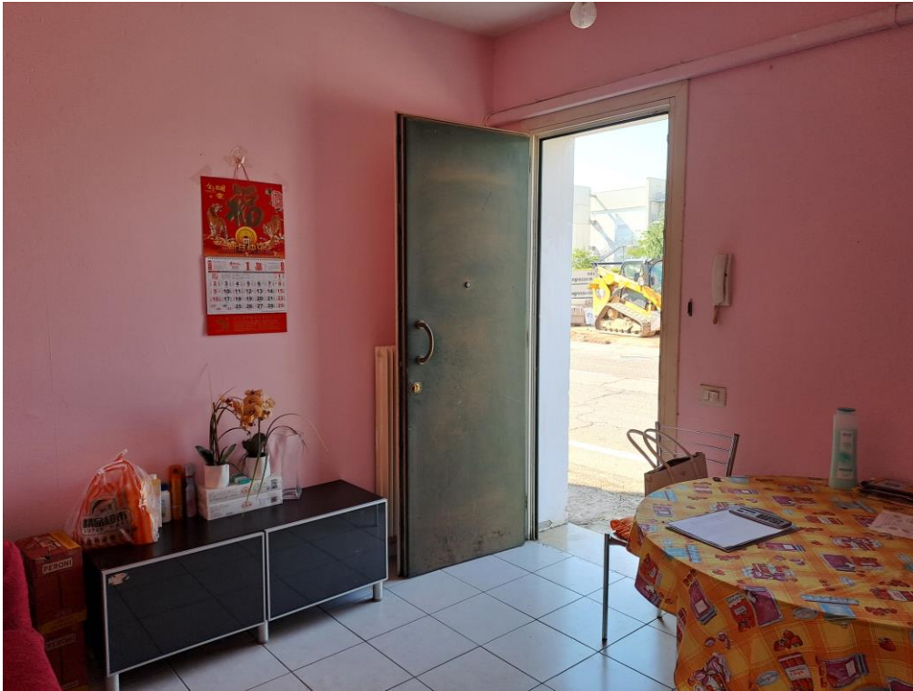
5. Vista della zona giorno