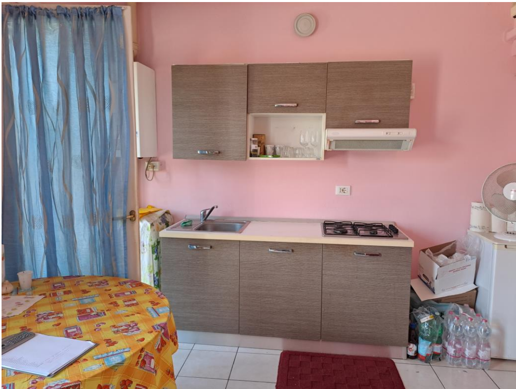
6. Vista della zona giorno