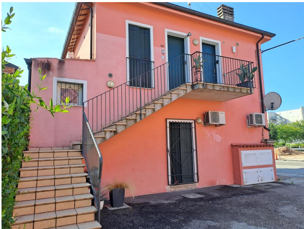
3. Vista da Nord-Ovest