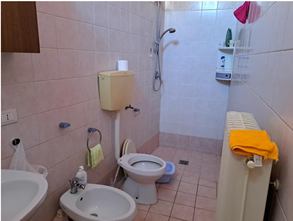
10. Vista del servizio igienico