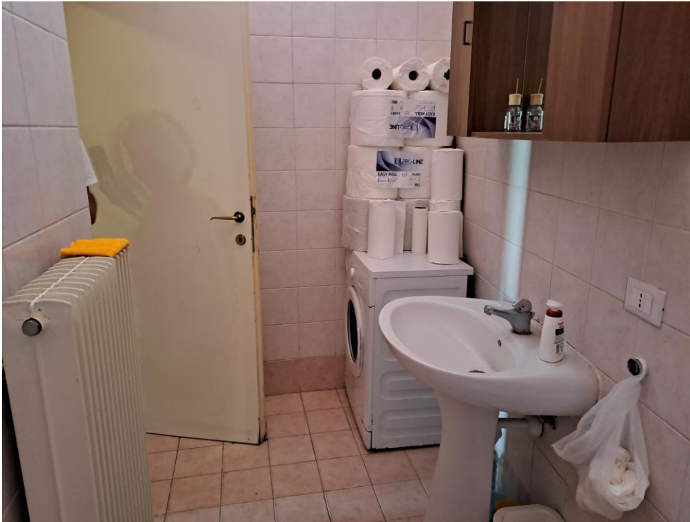
9. Vista del servizio igienico