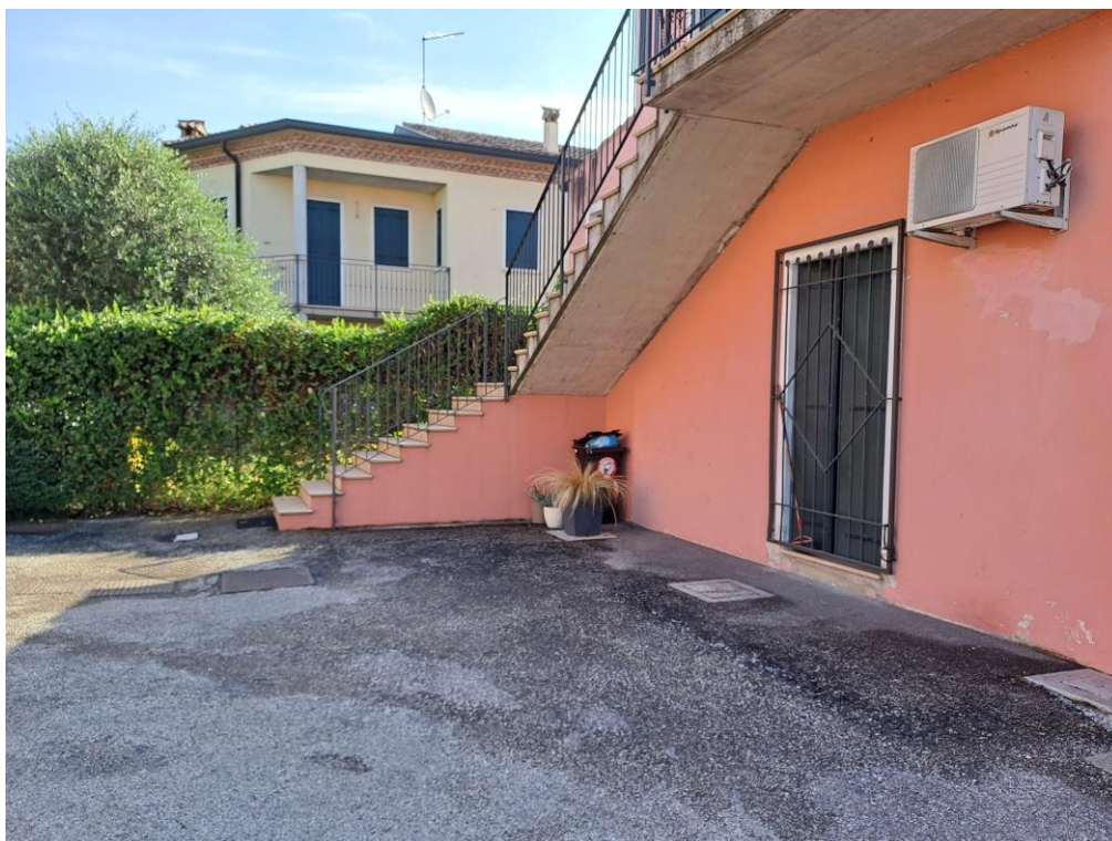
4. Vista del posto auto scoperto