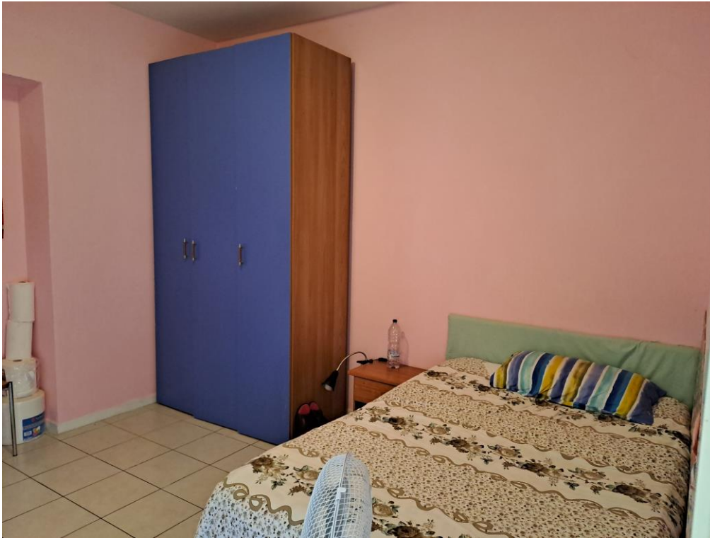
7. Vista della camera da letto