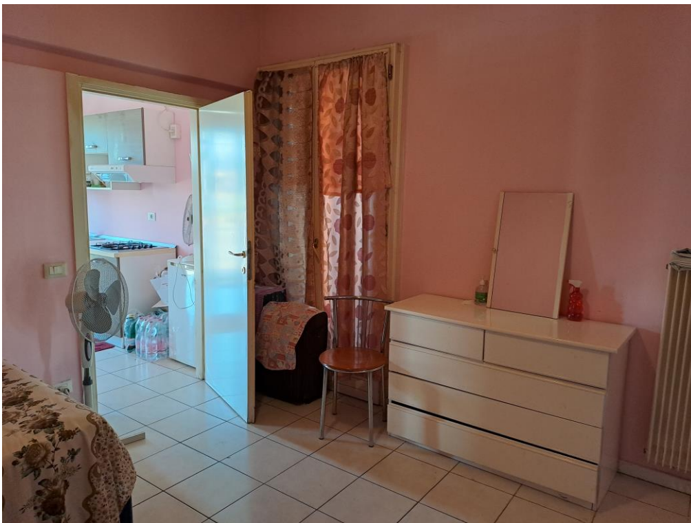
8. Vista della camera da letto