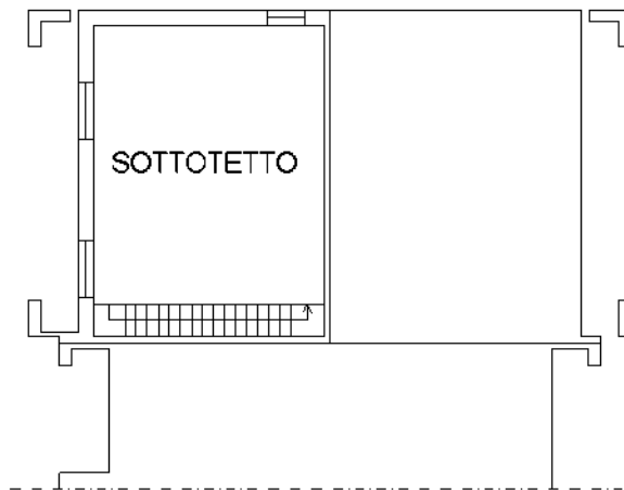
PIANO SOTTOTETTO hm 215