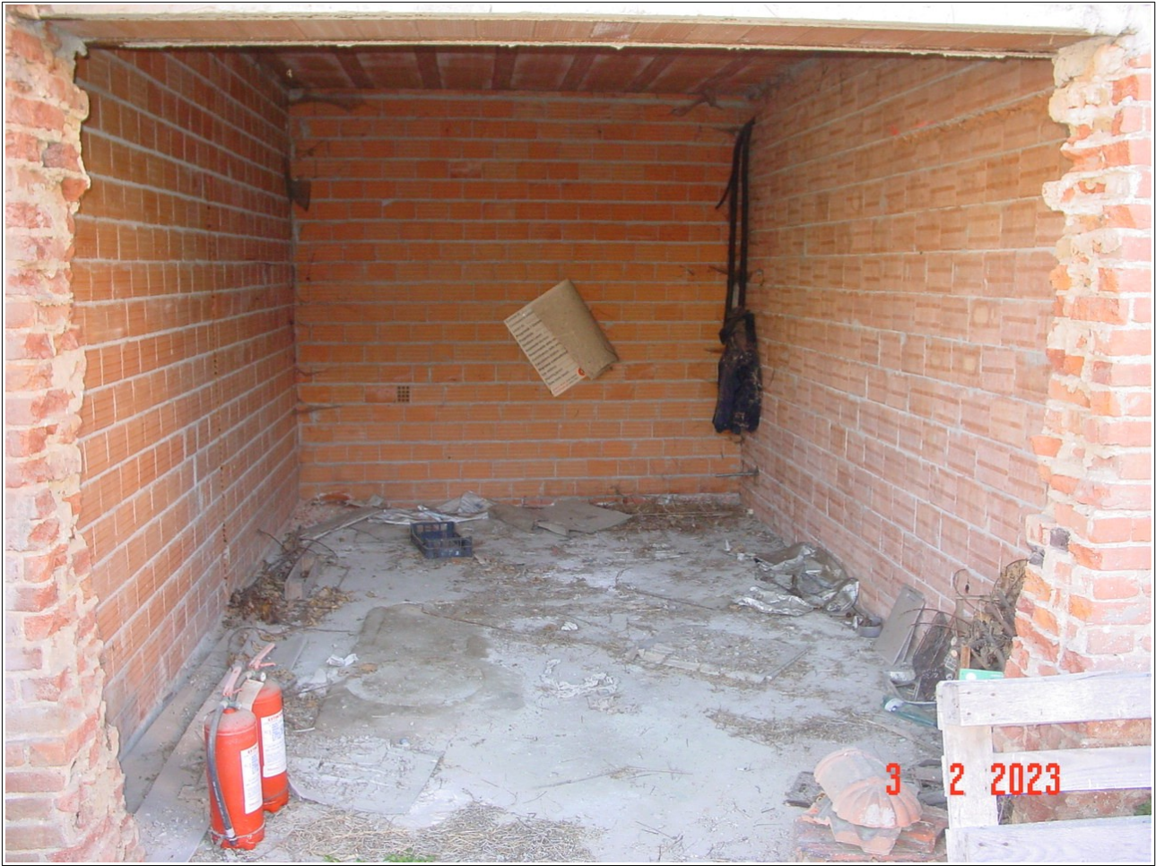
Vista interna autorimessa _ u.i.u. mappale 467 subalterno 7