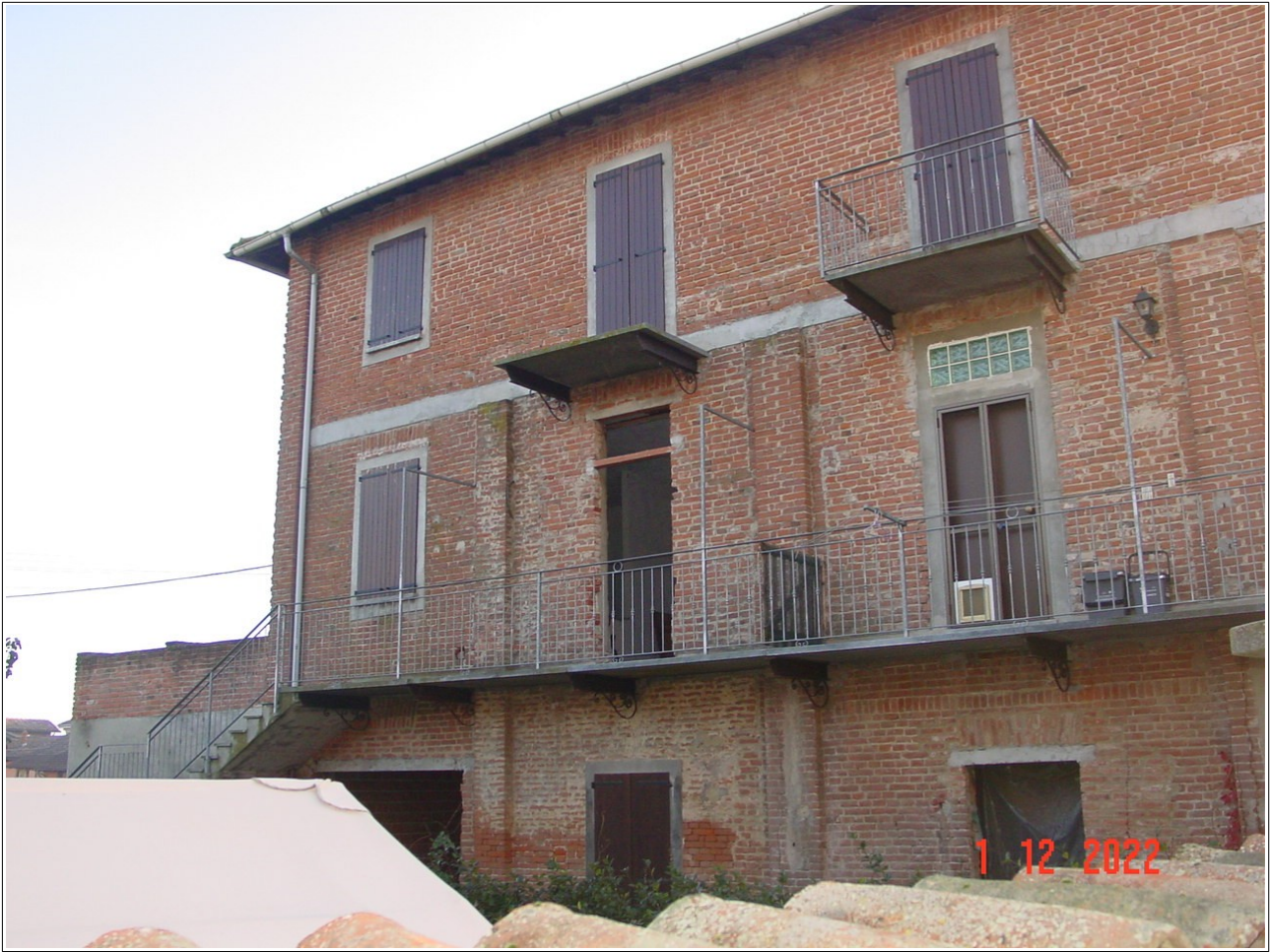
Cortile comune _ u.i.u. mappale 467 subalterno 11