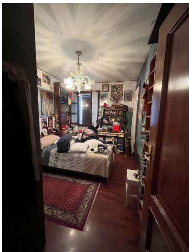
CAMERA E BAGNO AL PIANO RIALZATO