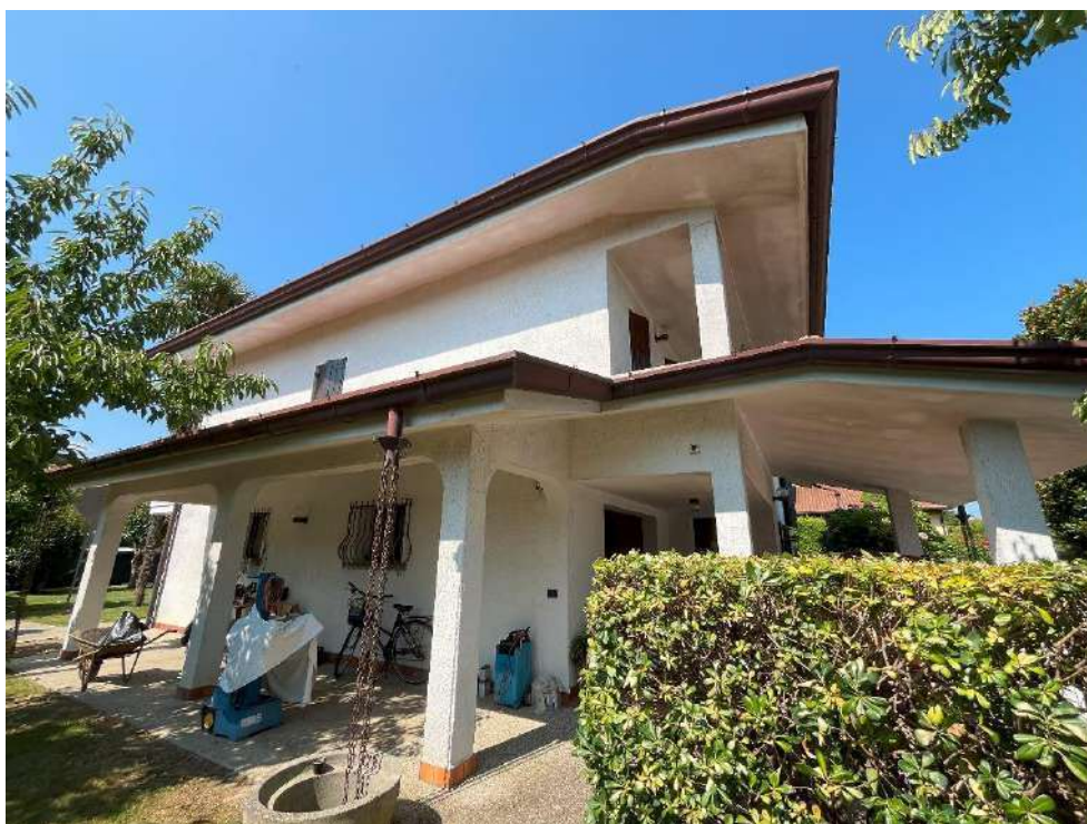
VISTA DEGLI ESTERNI: FRONTI EST E SUD