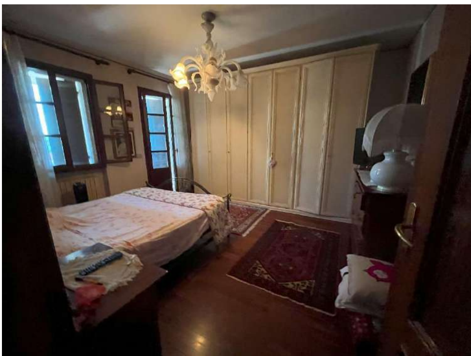
CAMERA AL PIANO RIALZATO E SOTTOTETTO