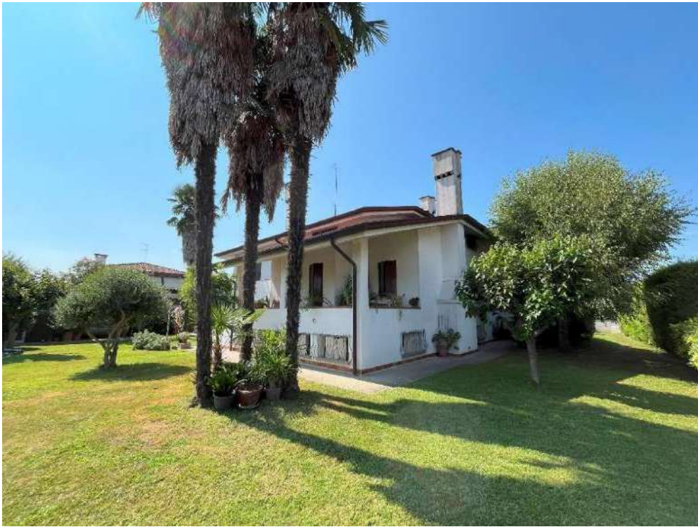
VISTA DAL GIARDINO VISTA DEGLI INTERNI: SOGGIORNO