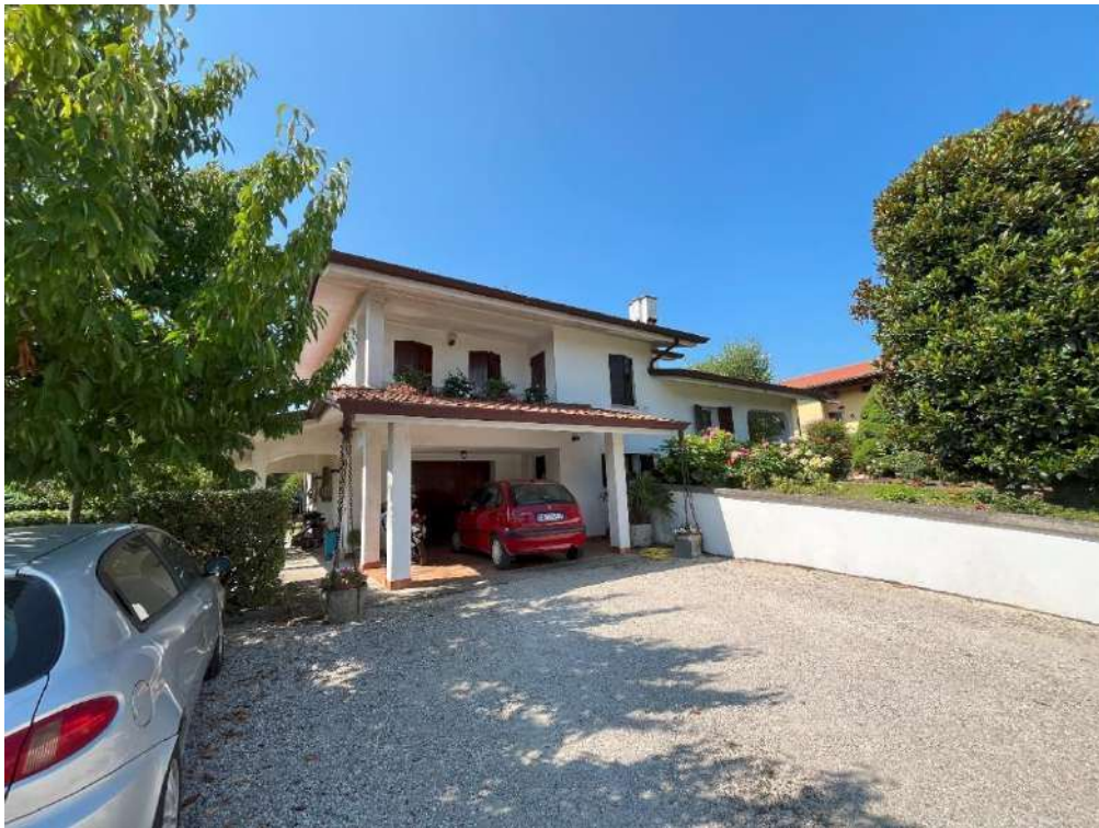
VISTA DEGLI ESTERNI: FRONTE NORD E SUD