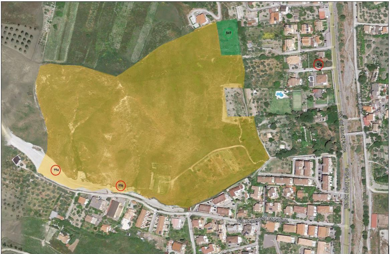
Fig. 2 – STRALCIO ORTOFOTO. Colore giallo lo schema dei terreni pignorati – cerchio rosso schema part.lla 774 e 775 oggetto di esproprio e la part. 84 di altrui proprietà, in verde schema part. 847 non oggetto di pignoramento.