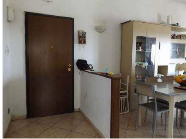
Foto n. 6- Ingresso