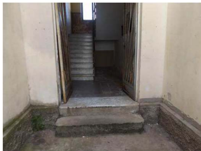
Foto n. 4- Esterno Unità Immobiliare Pignorata

Ha un accesso prospiciente su Via dei Platani, ha due piani fuori terra e le unità immobiliari ivi presenti sono ad uso abitativo.