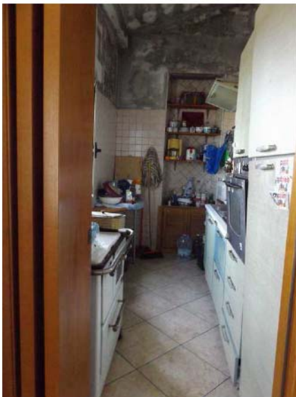
Foto n. 7- Cucina