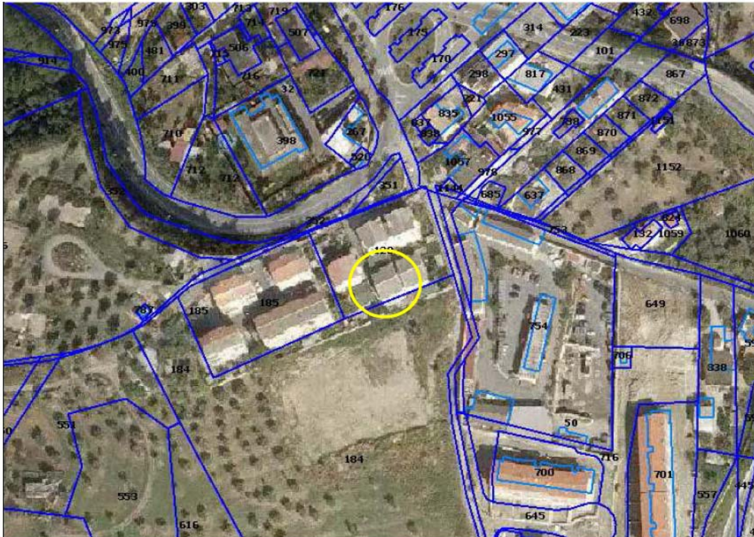
Figura n. 1: Sovrapposizione dell'ortofoto con la mappa catastale (cfr. all. 13)

La zona di ubicazione , classificata nel PRG vigente “ZONA B1- zona residenziale satura di recente formazione, priva di rilevanti valori storico-artistici o ambientali e che non necessitano di importanti trasformazioni urbanistiche ed edilizie”