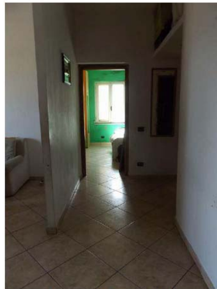
Foto n. 8- Corridoio