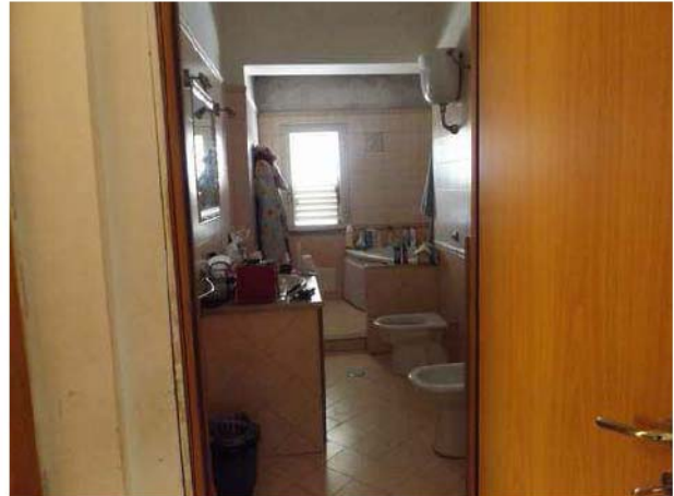
Foto n. 10- Bagno