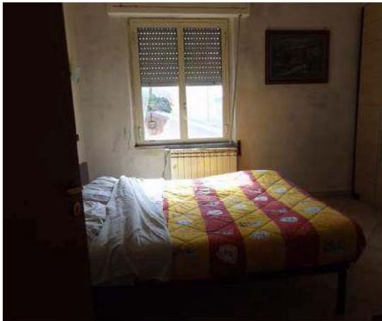
Foto n. 11- Camera da letto