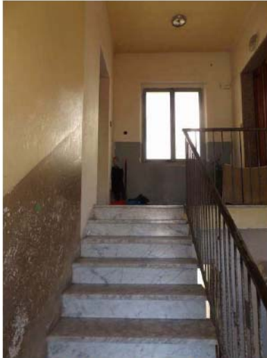
Foto n. 5- Scale

La rappresentazione fotografica dell'unità immobiliare è la seguente (cfr. all. 6.A):