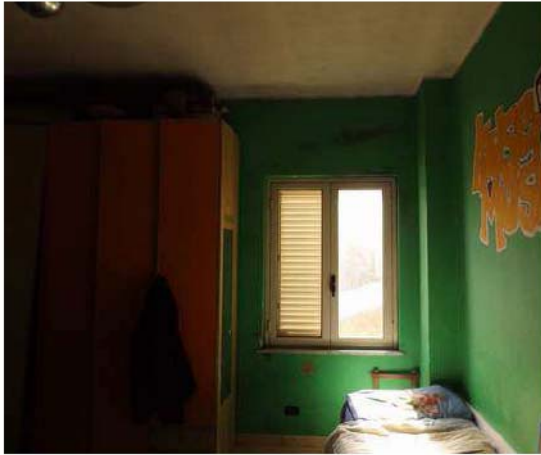
Foto n. 9- Camera da letto