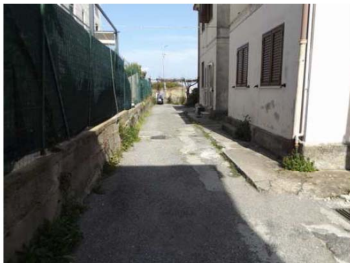
Foto n. 2- Esterno Unità Immobiliare Pignorata