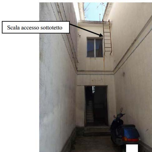
Foto n. 3 Esterno Unità Immobiliare Pignorata