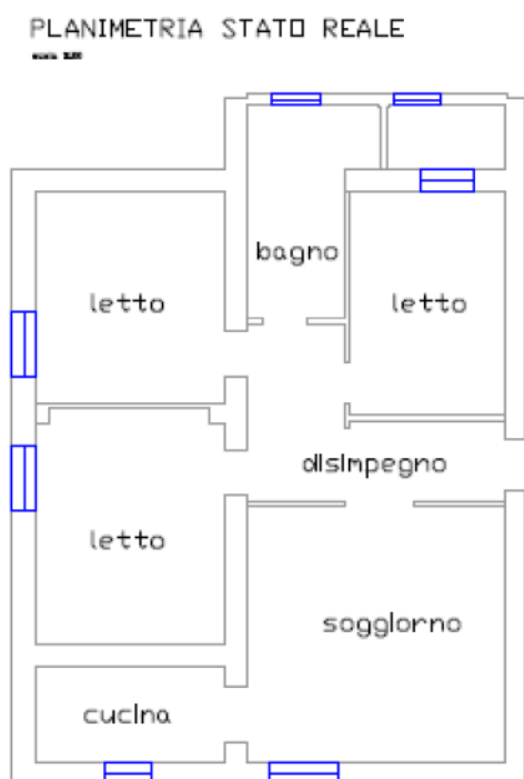
Figura n. 2: Planimetria dello stato reale dei luoghi (cf. all. 12)

Lo stato reale dei luoghi rilevato dal sottoscritto CTU in occasione del sopralluogo è difforme con la planimetria catastale ( cf. all. 5 ).