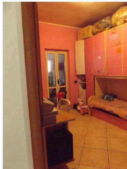
Foto n. 12- Camera da letto