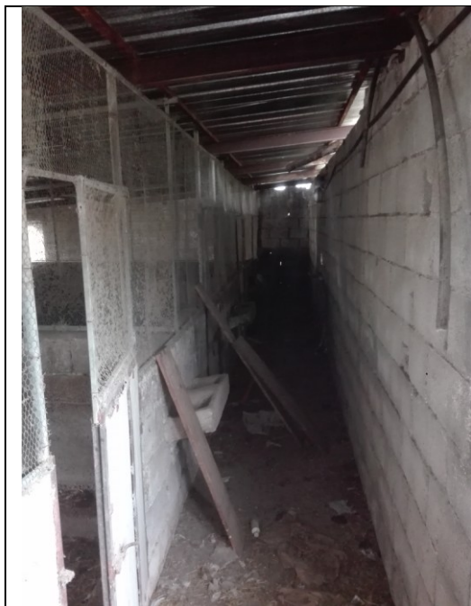
Foto n.34 – Foto interna annessi agricoli/porcilaie - piano terra - bene n.3 da demolire, prive di autorizzazione.