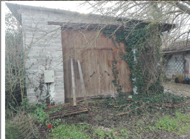
Foto n. – 30 Foto esterna locale deposito - piano terra - bene n.3 - da demolire, privo di autorizzazione.