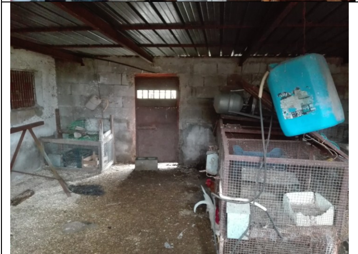
Foto n.33 – Foto interna annessi agricoli/pollaio - piano terra - bene n.3 da demolire, privo di autorizzazione.