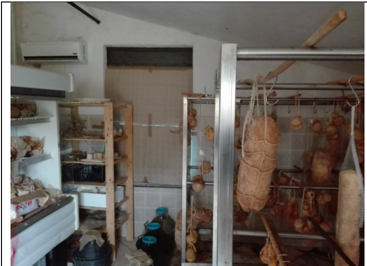
Foto n.32 – Foto interna annessi agricoli/cantina - piano terra - bene n.3 da demolire, priva di autorizzazione.