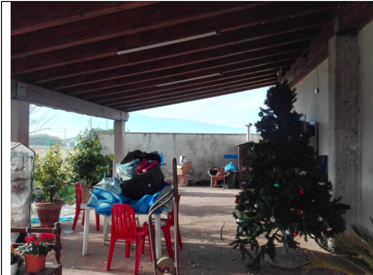
Foto n.28 – Foto esterna Abitazione - piano terra - bene n.2 Porticato da demolire, privo di autorizzazione.