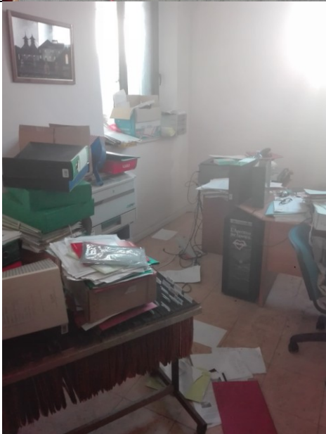
Foto n.9 – Foto interna locale commerciale/magazzino – uffici - bene n.1