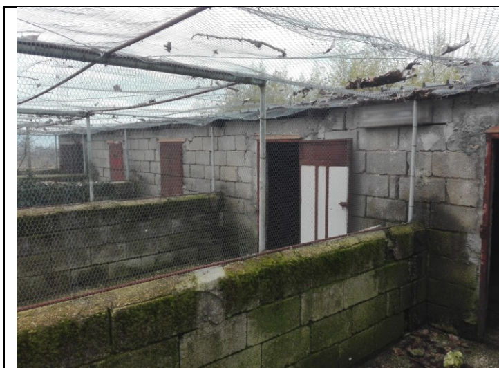
Foto n.35 – Foto esterna annessi agricoli/porcilaie - piano terra - bene n.3 da demolire, prive di autorizzazione.