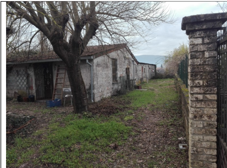
Foto n.29 – Foto esterna annessi agricoli - piano terra - bene n.3 Annessi agricoli da demolire, privi di autorizzazione.