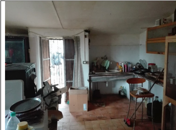
Foto n.31 – Foto interna annessi agricoli/cantina - piano terra - bene n.3 da demolire, priva di autorizzazione.