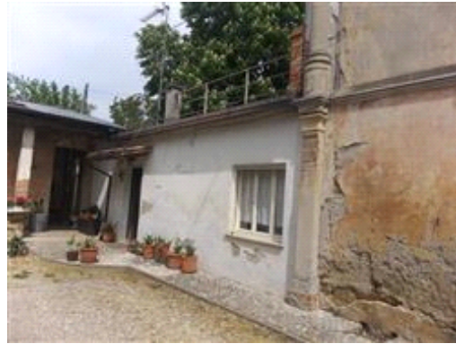
Facciata parte abitata