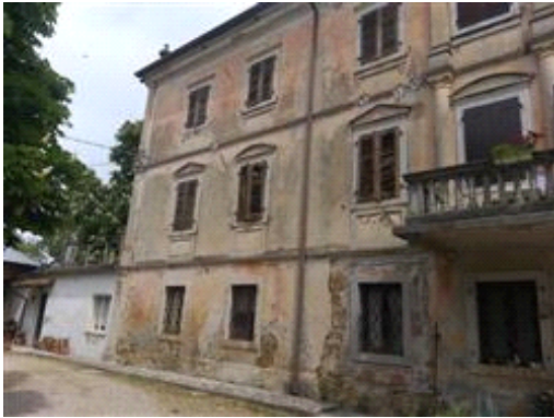
Facciata villa storica