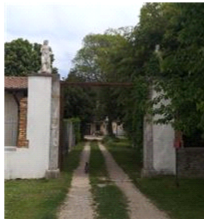
Accesso alla proprietà