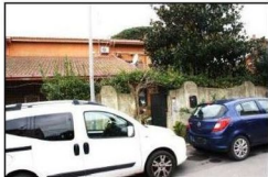
Foto 02 - Via de l'Orsa Minore, 95 - Ingresso pedonale