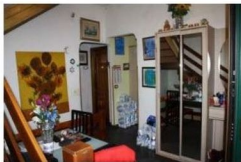
Foto 13 – Ingresso: porta living a dex disimpegno centro e scala a sin