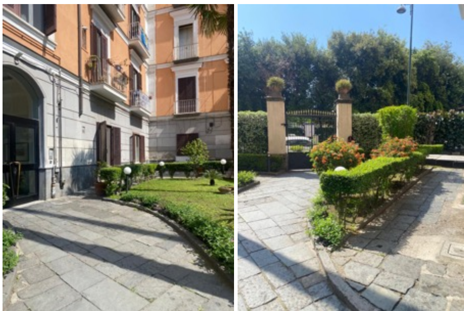
Foto da 10 a 12 : Vista cortile interno al condominio ed ingresso androne