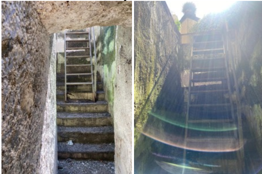
Foto da 17 a 20 : Vista scala in ferro per l'accesso dalla botola al locale deposito