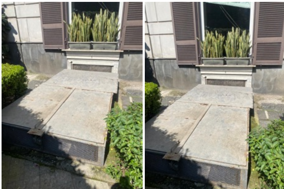
Foto da 2 a7 : Vista struttura in ferro e botola d'ingresso al locale deposito