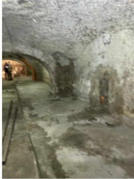
Foto da 31 a 38 : Vista parte centrale più bassa rispetto alla parte perimetrale e vista bocche di lupo