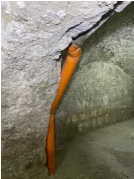
Foto da 29 a 30 : Vista dei sottoservizi del fabbricato esistenti internamente al locale deposito