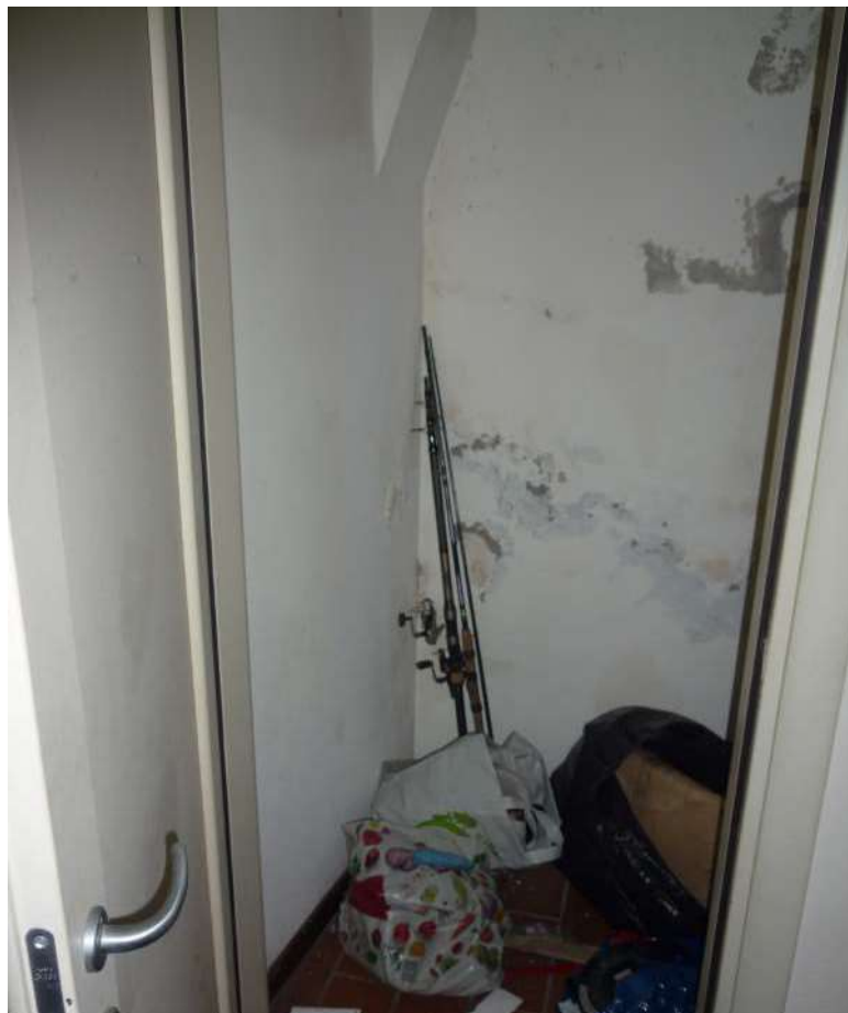
FOTO n.11 – il ripostiglio sottoscala dalla camera al piano terreno