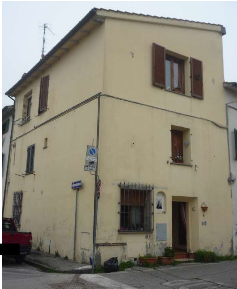
VEDUTA ESTERNA DEL FABBRICATO DOVE E' UBICATA L'UNITA' IMMOBILIARE