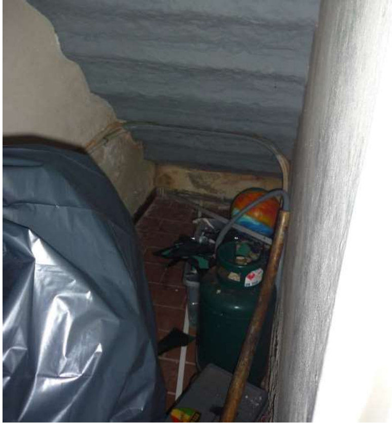
FOTO n.5 – ripostiglio sottoscala con accesso dalla zona giorno al piano terreno