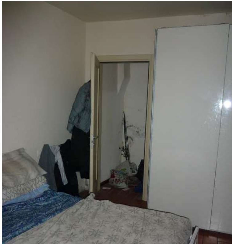
FOTO n.10 – accesso al ripostiglio sottoscala dalla camera al piano terreno