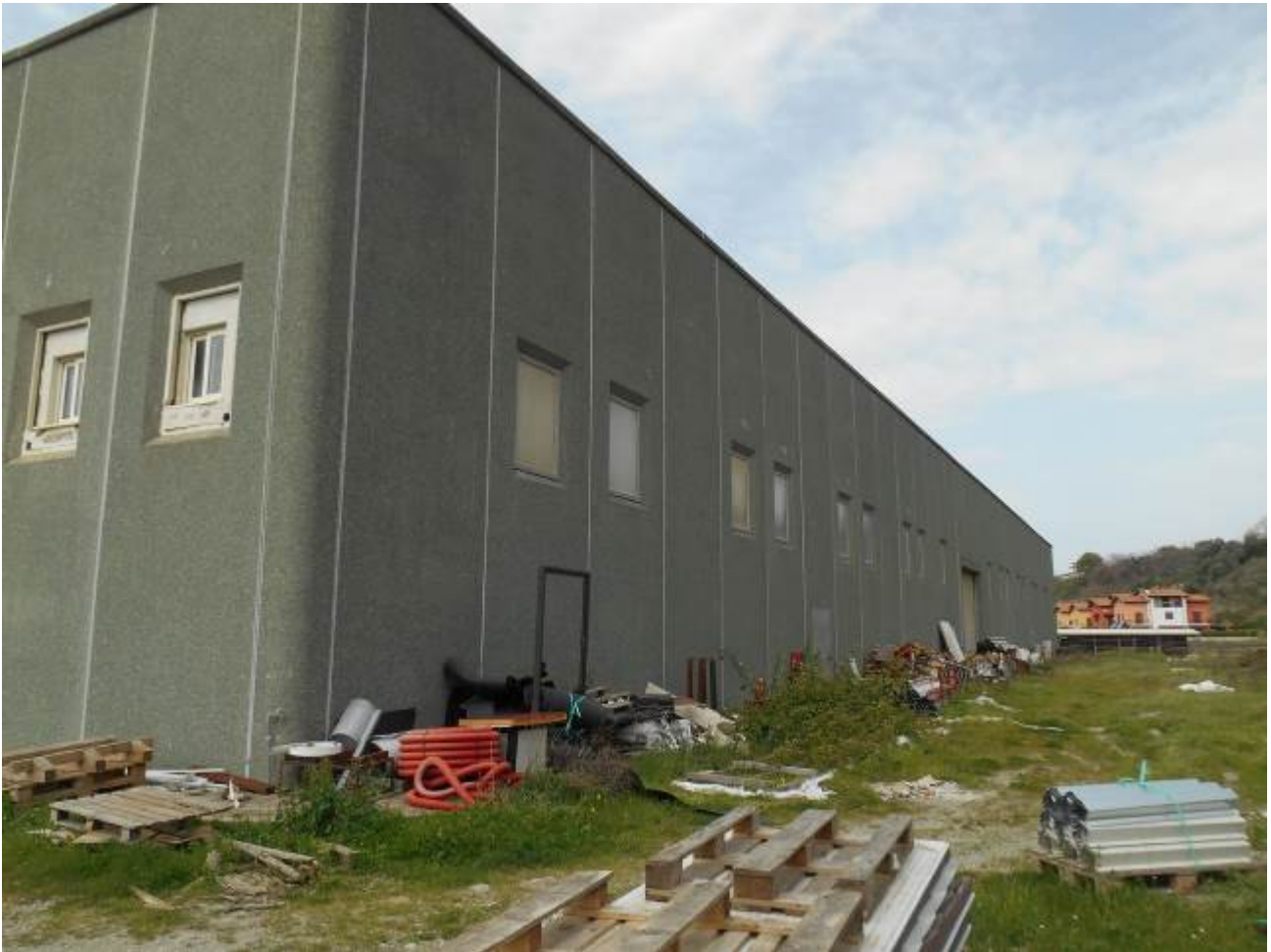
Foto n° 10: p.lla 854 (capannone) con piazzale p.lle 855 e 853 non compreso