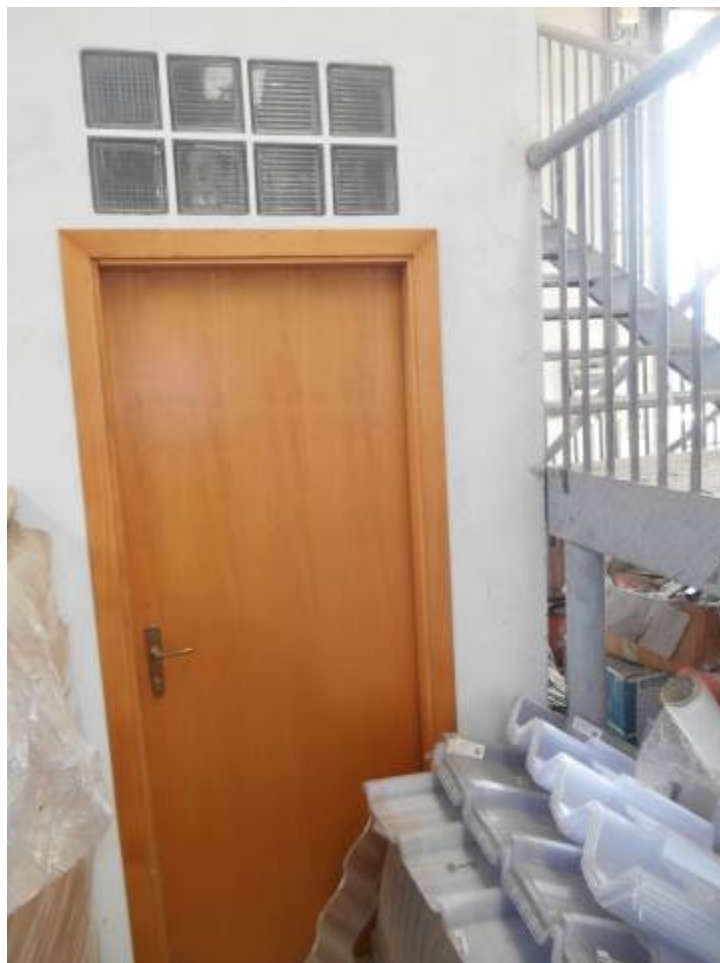
Foto n° 43: p.lla 854, sub 1 – piano terra area servizi – porzione non accessibile