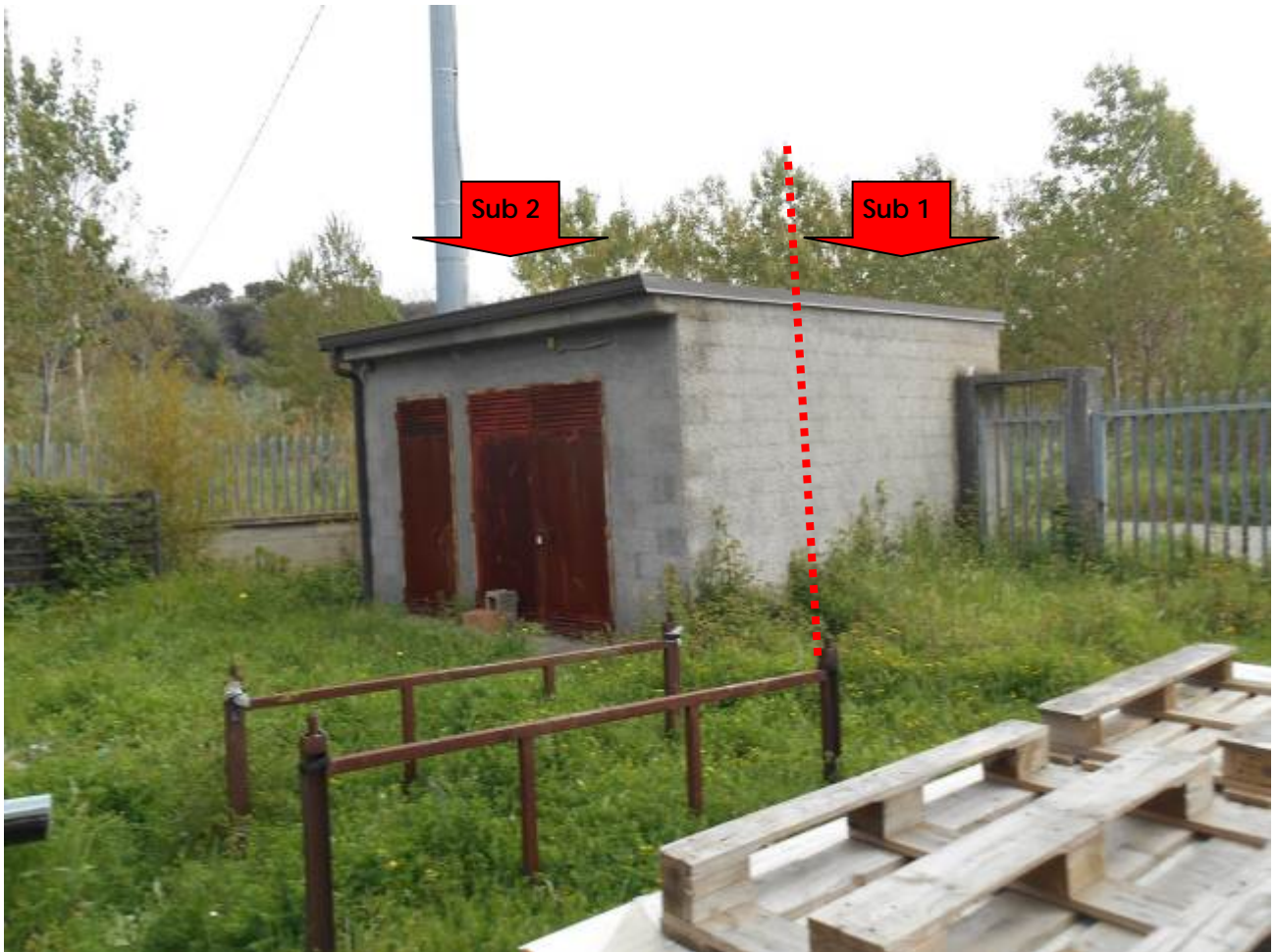
Foto n° 4: p.lla 811 all'interno del piazzale p.lla 855 (non compreso)