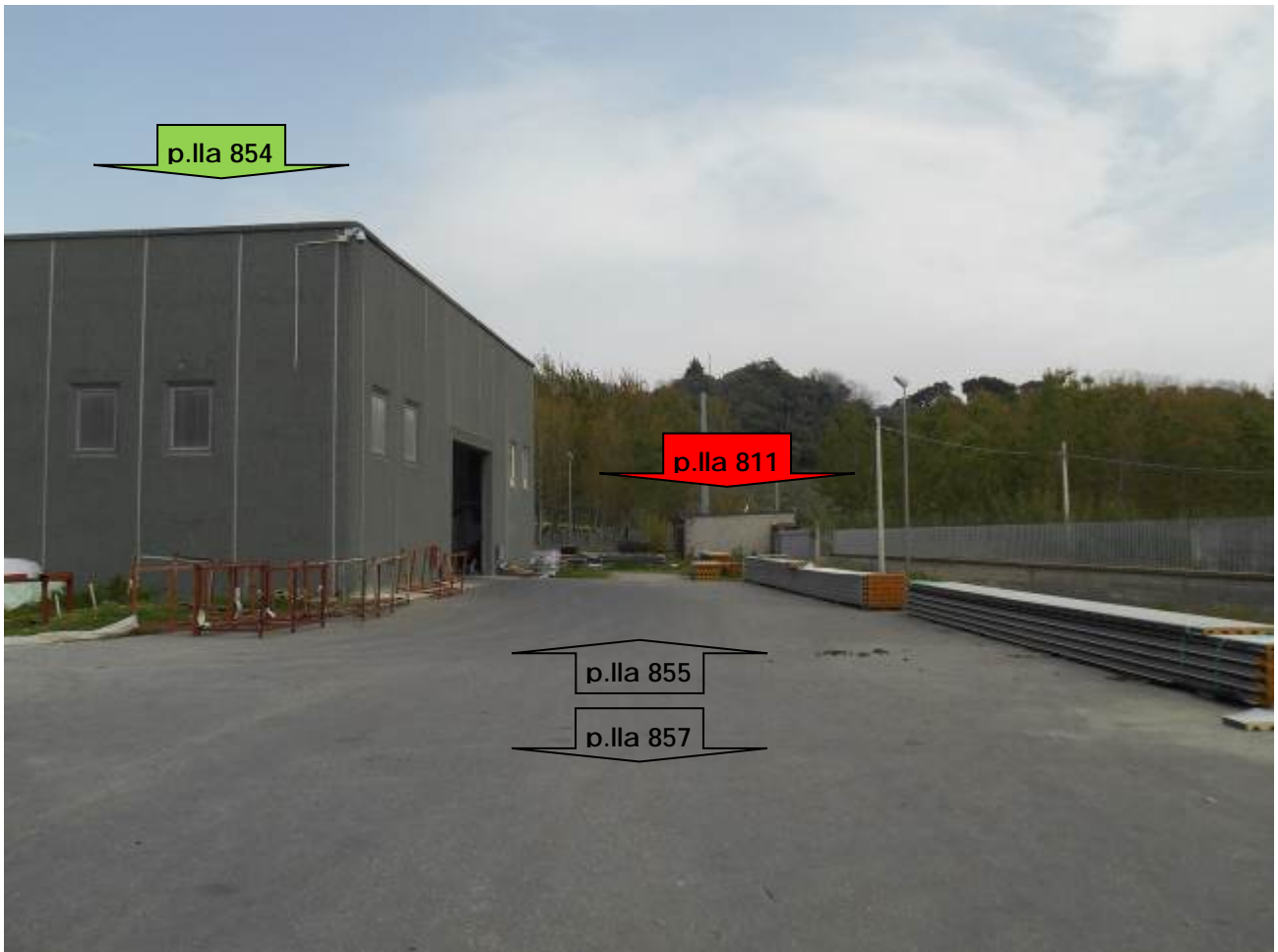
Foto n° 8: p.la 811 (cabina e.) e 854 (capannone) con piazzale p.la 855 non compreso