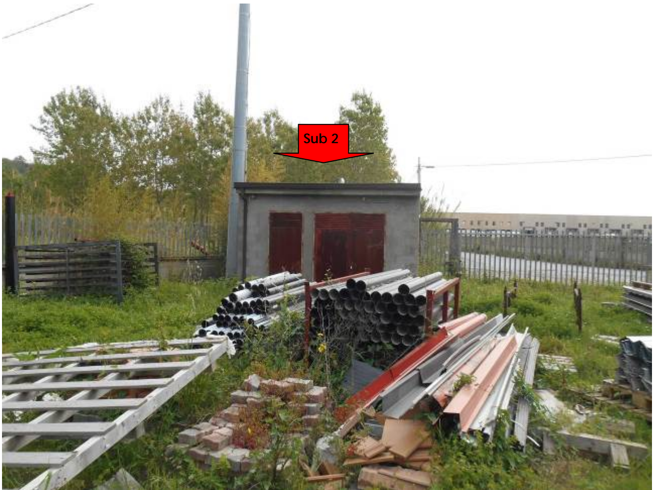
Foto n° 6: p.lla 811 all'interno del piazzale p.lla 855 (non compreso)