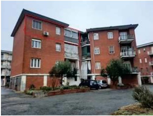
Affaccio immobile a sud-ovest