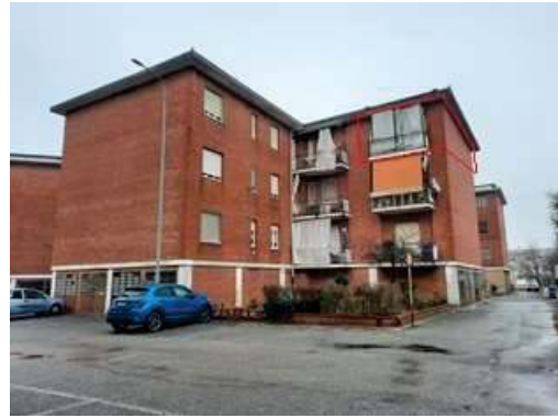
Affaccio immobile a nord-est