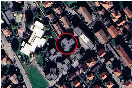
Immagine satellitare

I bene è ubicato in zona semiperiferica di Caselle Torinese, zona ben servita comoda ai mezzi pubblici.