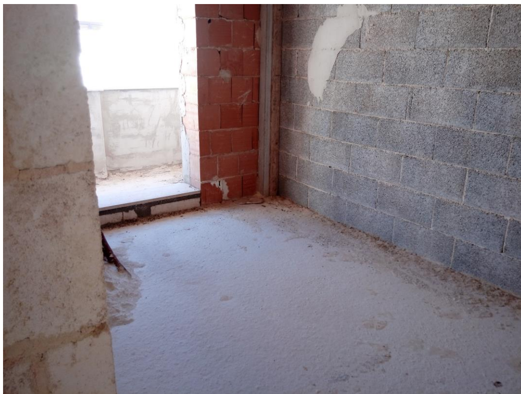
Ambienti interni-balcone - piano primo