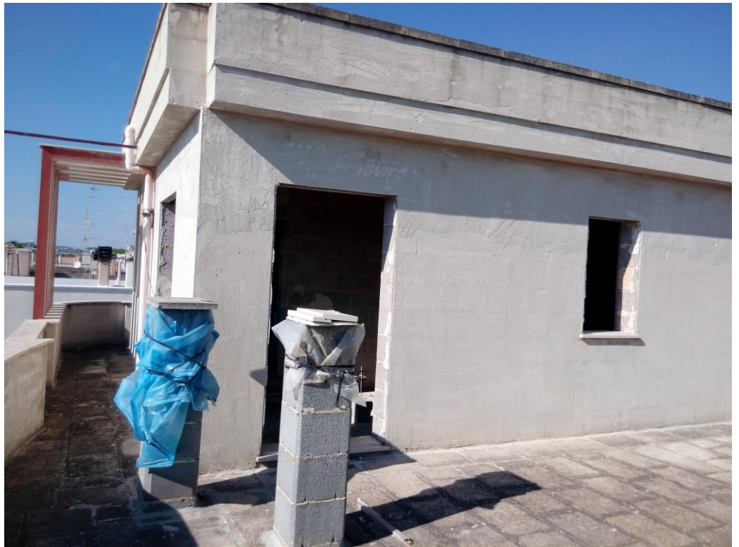
Vano tecnico-terrazza - piano secondo