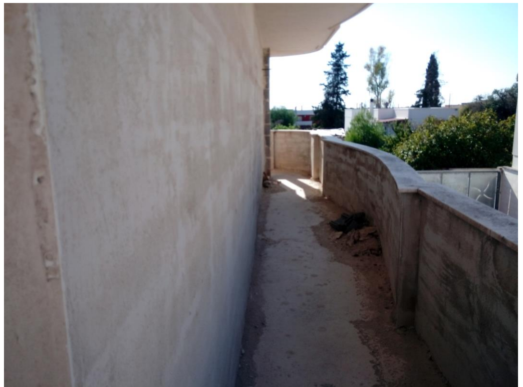
Balcone laterale – piano primo