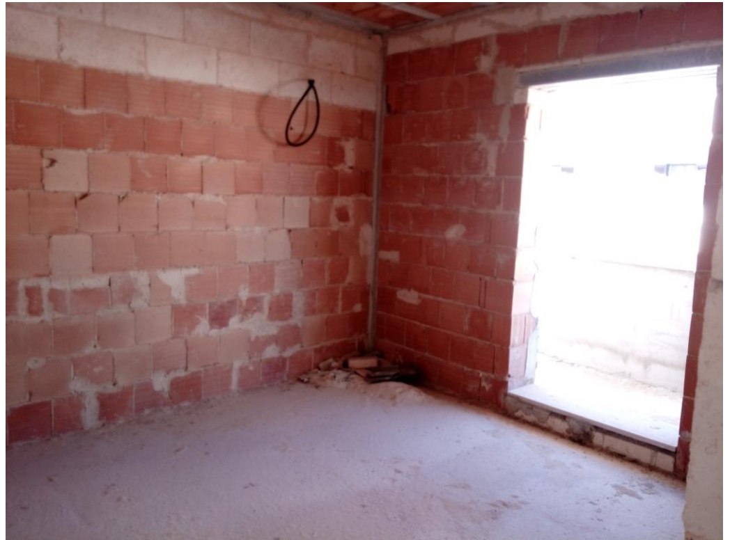
Ambienti interni – piano primo