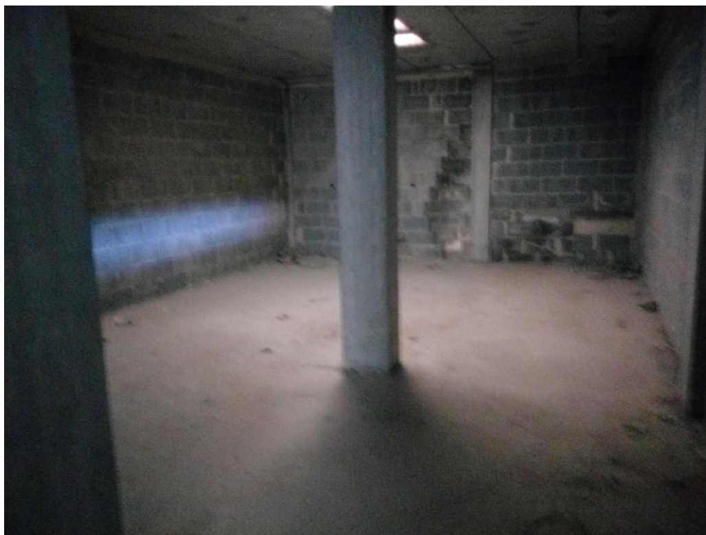
Cantina piano interrato 1