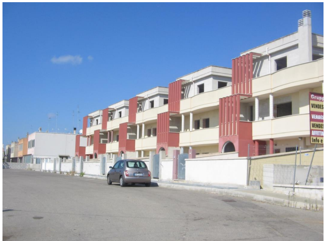
Complesso edilizio-residenziale prospetto su via via denominare - corpo B1 n°2