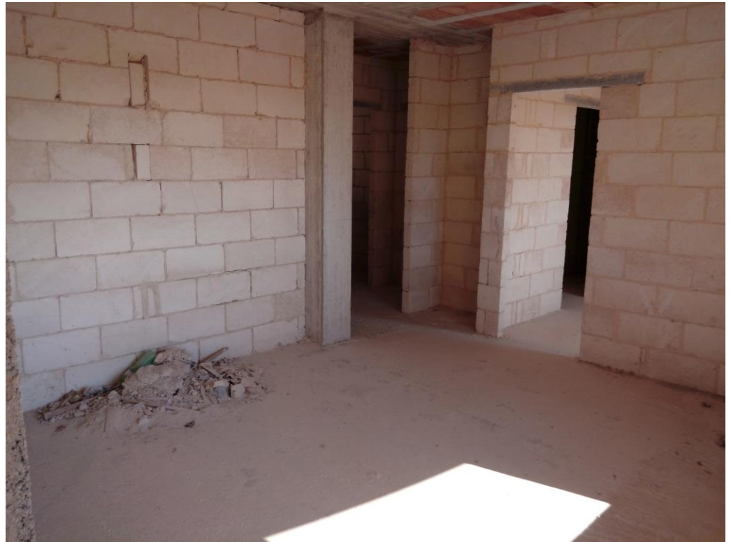
Abitazione a rustico – piano primo