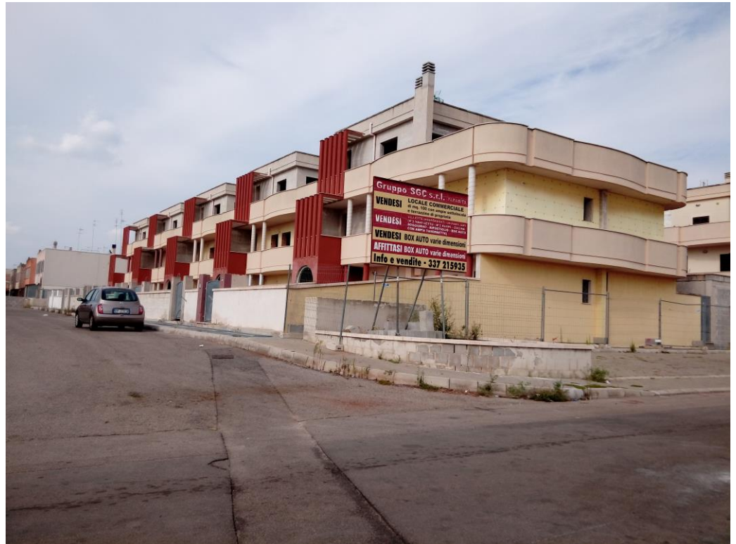
Complesso edilizio-residenziale prospetto su via via denominare - corpo B1 n°1