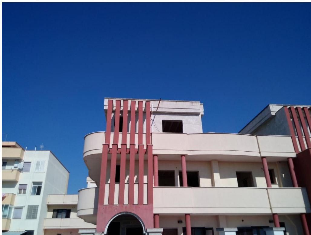
Prospetto ingresso-vano scala dell'abitazione al piano primo