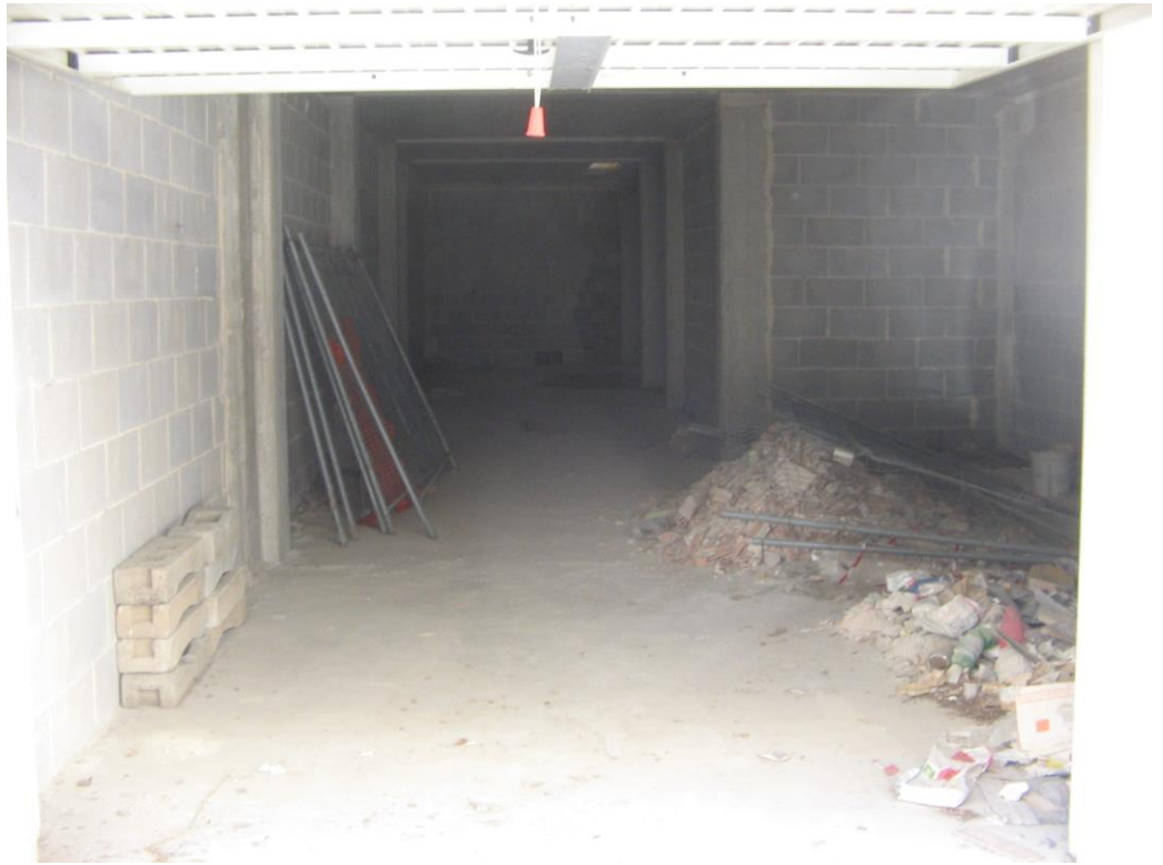
Box (sub. 49) con accesso da corsia di manovra indiviso da cantina n°15