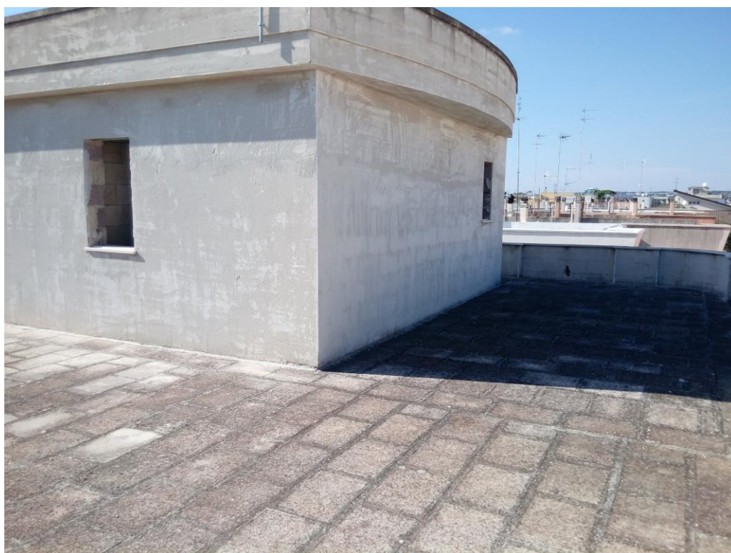
Terrazza retrostante piano secondo