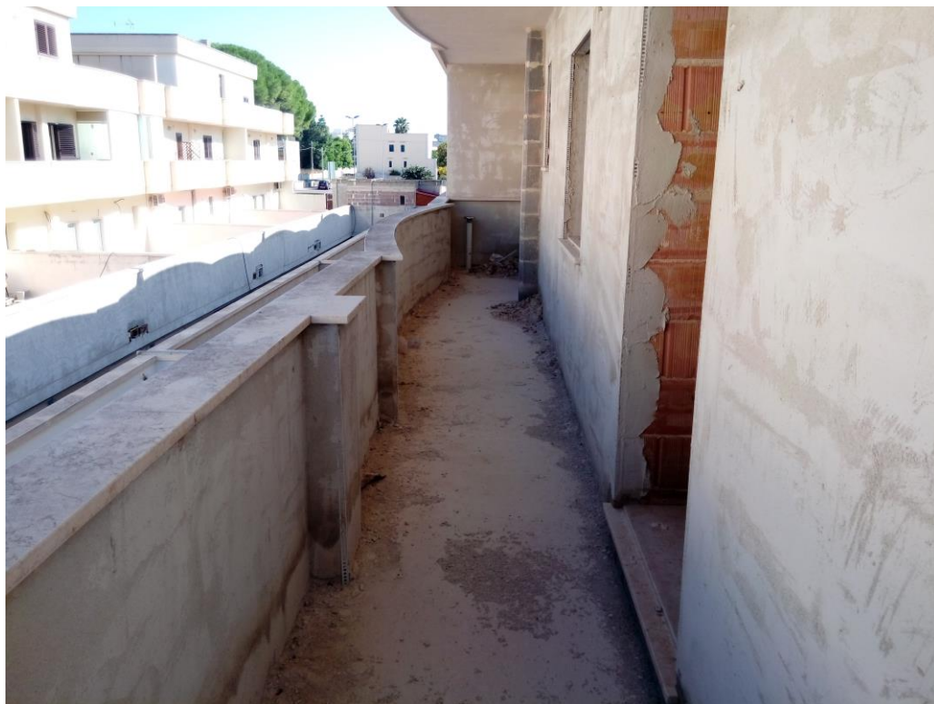
Balcone retrostante – piano primo