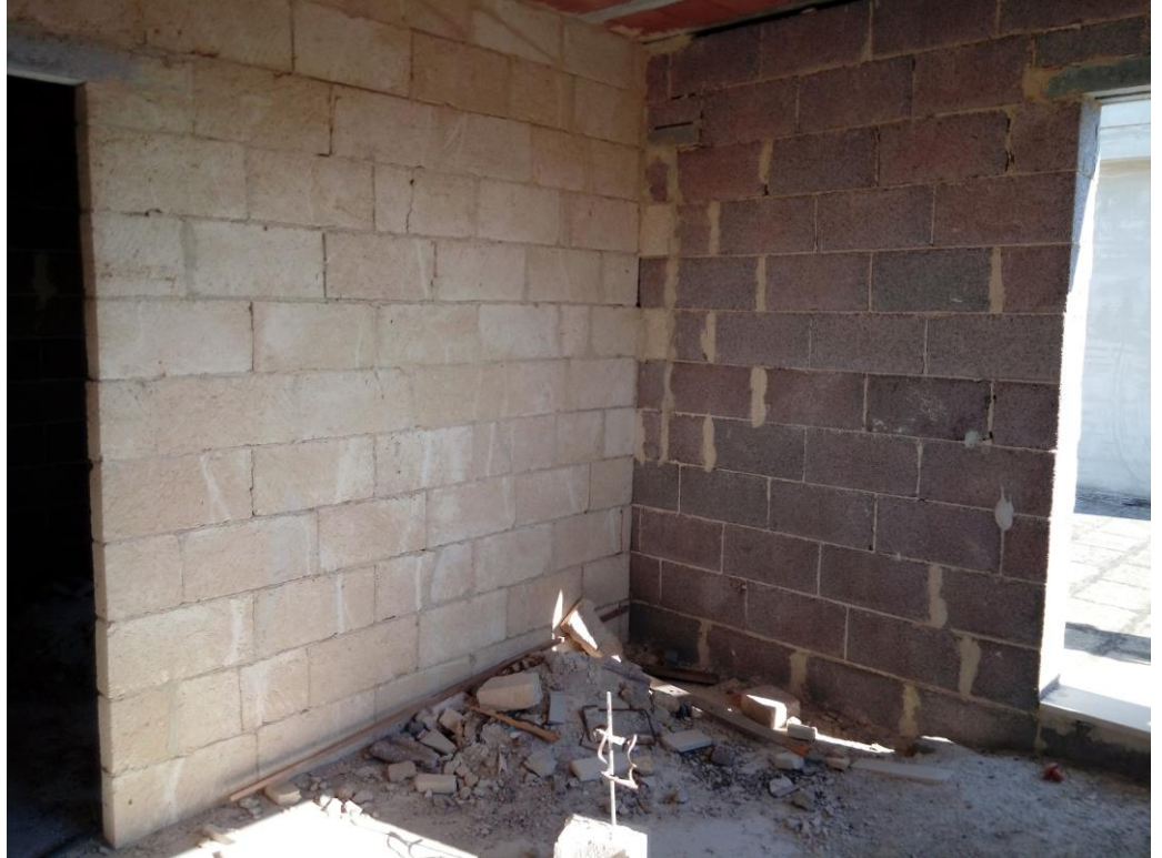
Vano tecnico – piano secondo