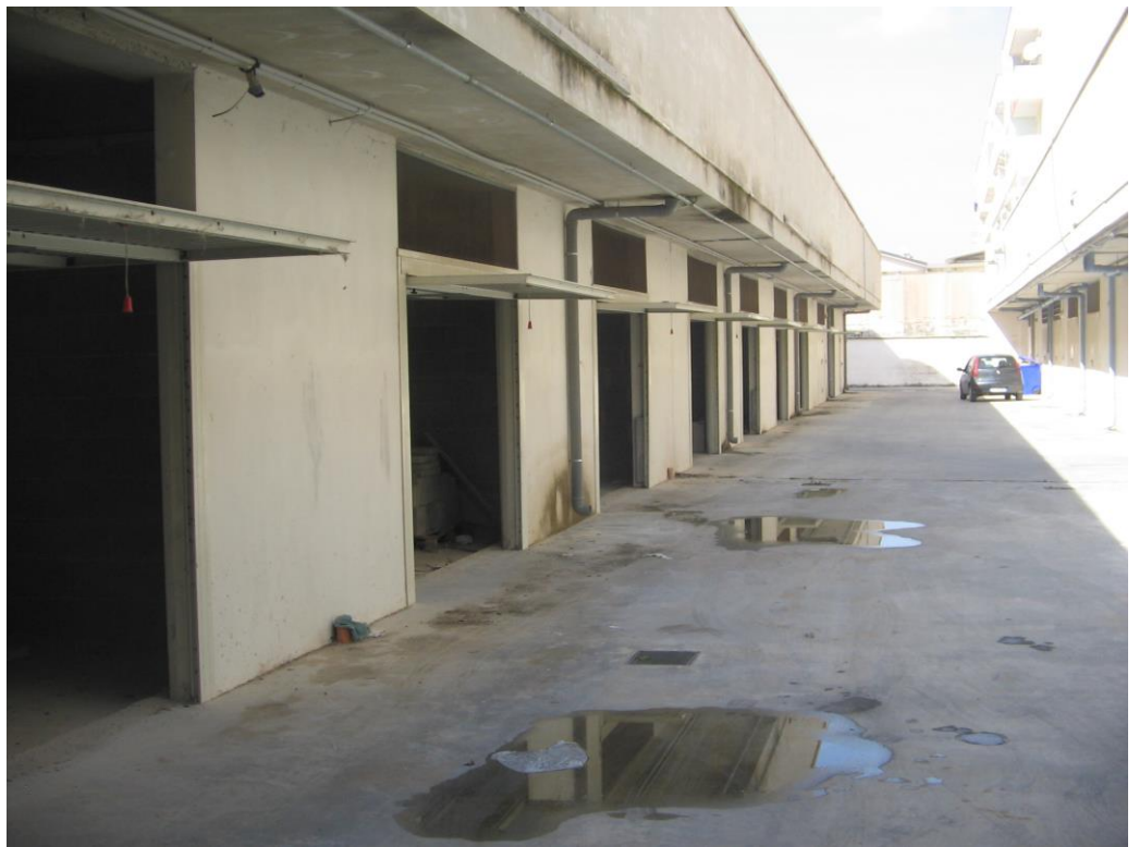
corsia di manovra piano interrato 1 n°16