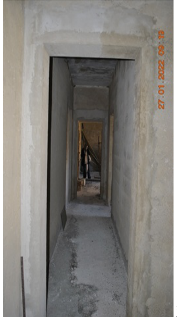
INTERNO DELL'APPARTAMENTO UBICATO AL PIANO SECONDO