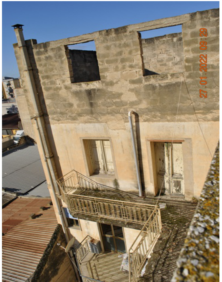
PROSPETTO LATO CORTILE