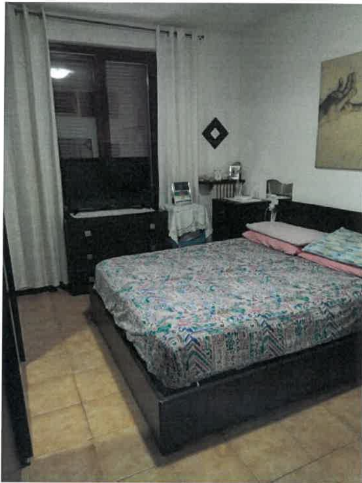
Camera e bagno