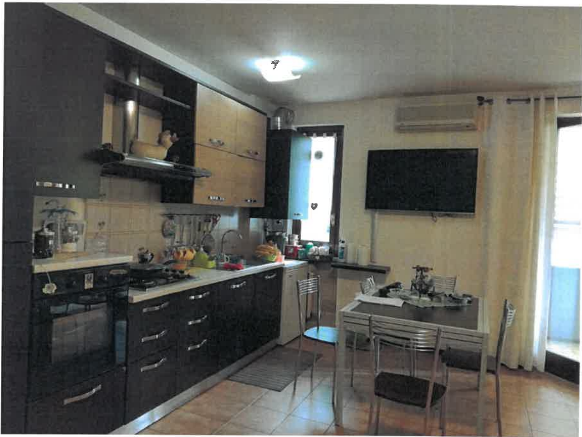
Soggiorno – cucina