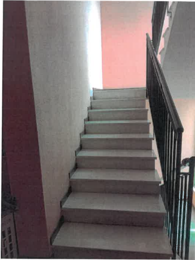
Scala comune e ingresso all'appartamento