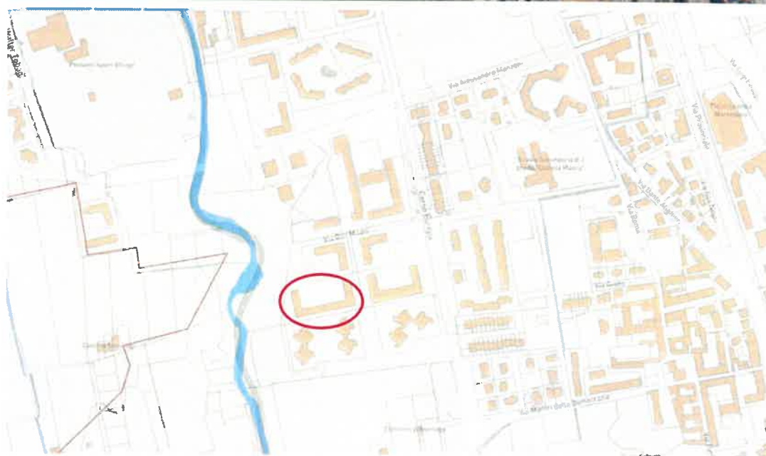
Inquadramento territoriale - vista dell'area e individuazione fabbricato e accesso