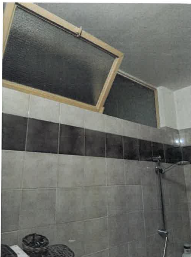
Bagno - finestre verso la camera