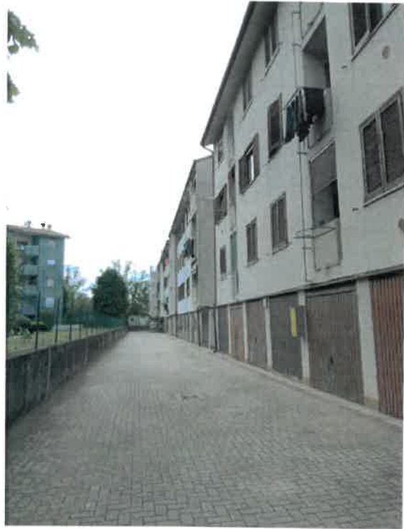
accesso fabbricato scala E - corsello manovra box