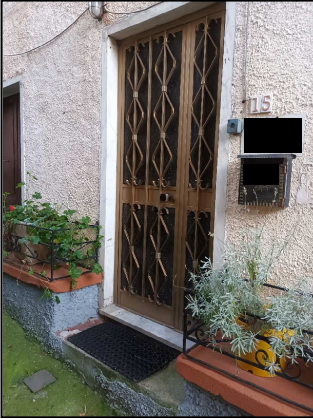
Particolare portone d'ingresso