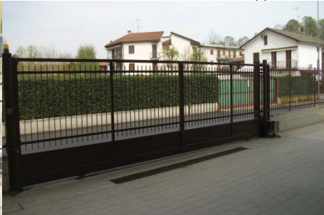
f. 23 accesso alla porzione commerciale