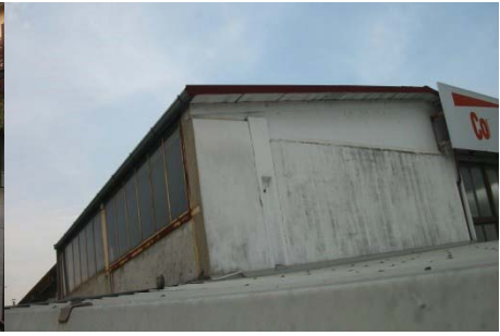
f.3 vista testa est fabbricato