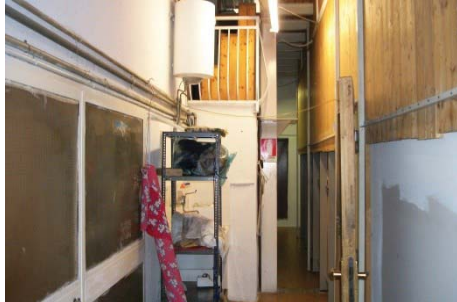
f. 25 disimpegno al p. terra