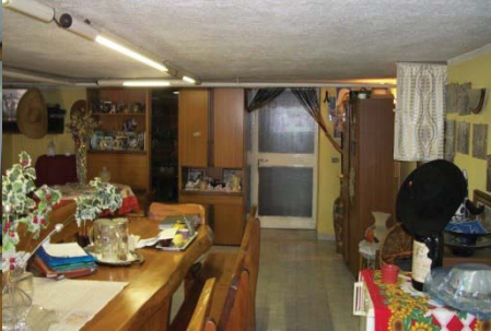
f. 30 idem