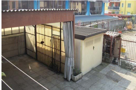
f. 22 vista autorimessa e recinzione contigua