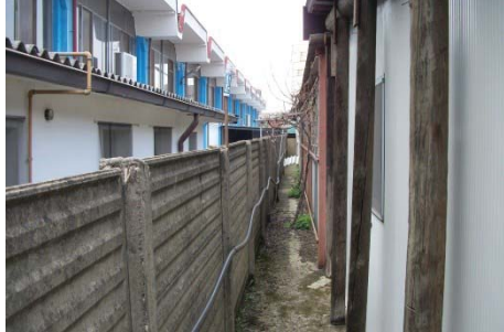
f.4 vista confine sud