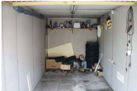
f. 19 vista interno autorimessa