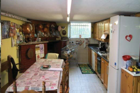
f. 29 vista locali p. terra porzione residenziale