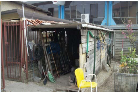
f. 20 vista cancello di accesso al mapp. 2287