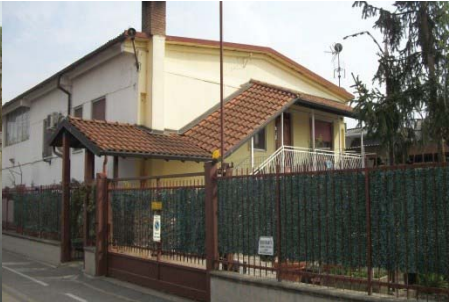
f.24 accesso alla porzione residenziale