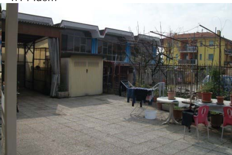
f. 17 cortile antistante all'abitazione