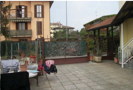
f. 21 cortile antistante all'abitazione