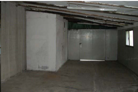
f.11 porzione commerciale deposito