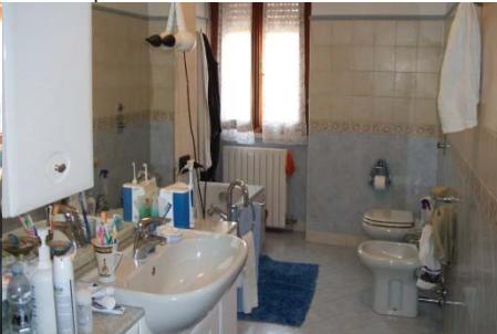
f. 36 vista bagno al piano 1