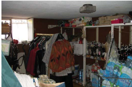
f. 31 idem