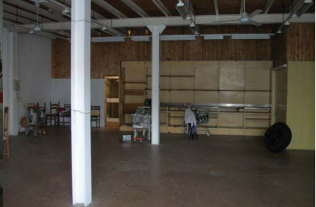
f.6 vista interno porzione commerciale