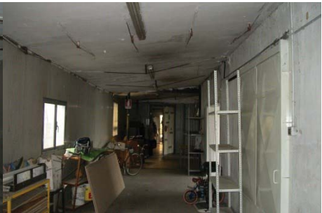
f. 12 idem