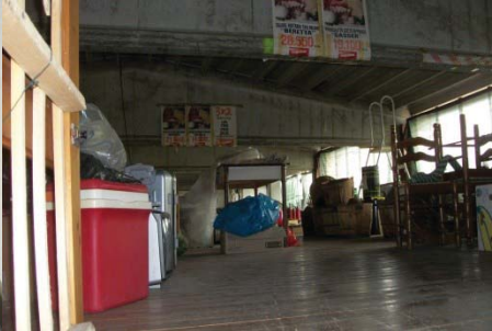
f.27 locale sottotetto