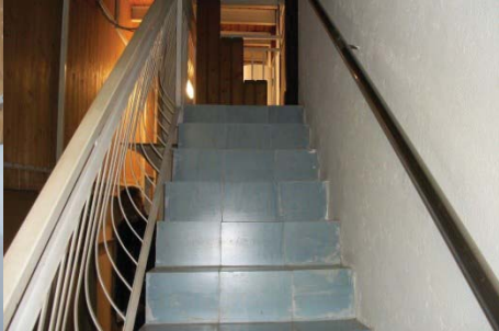
f.26 vista scala accesso al piano sottotetto