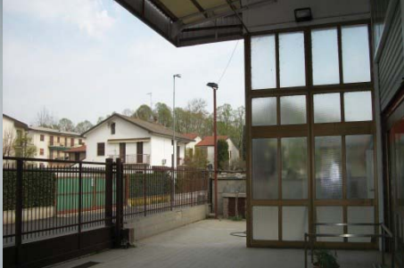
f.5 vista porticato ingresso porzione commerciale