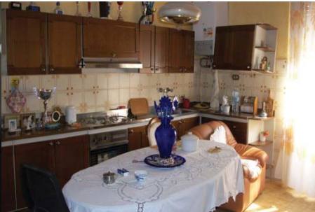
f. 33 cucina al piano 1