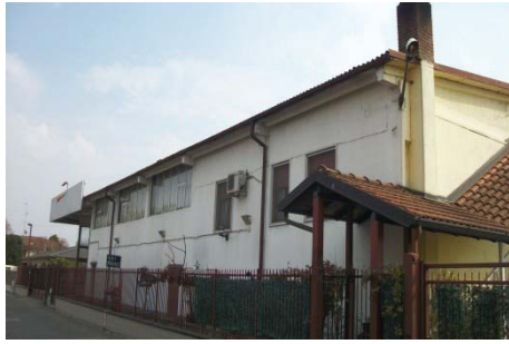
f. 1 vista del fabbricato dalla strada