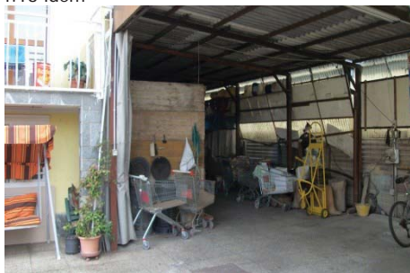
f. 16 portico a lato abitazione