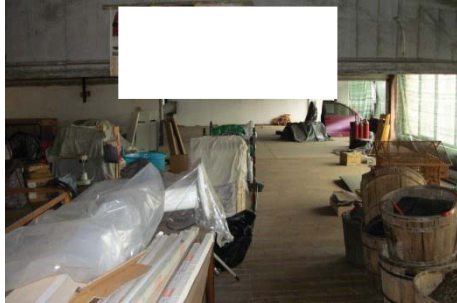
f. 28 idem