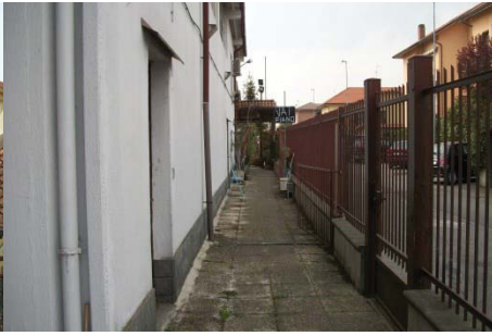
f.2 vista cortile parallelo alla strada