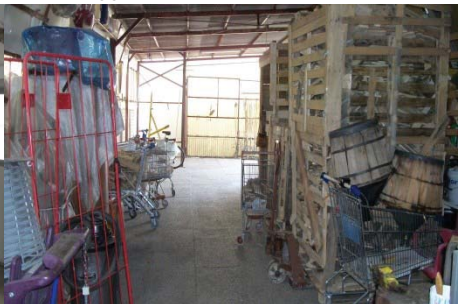
f 15. idem