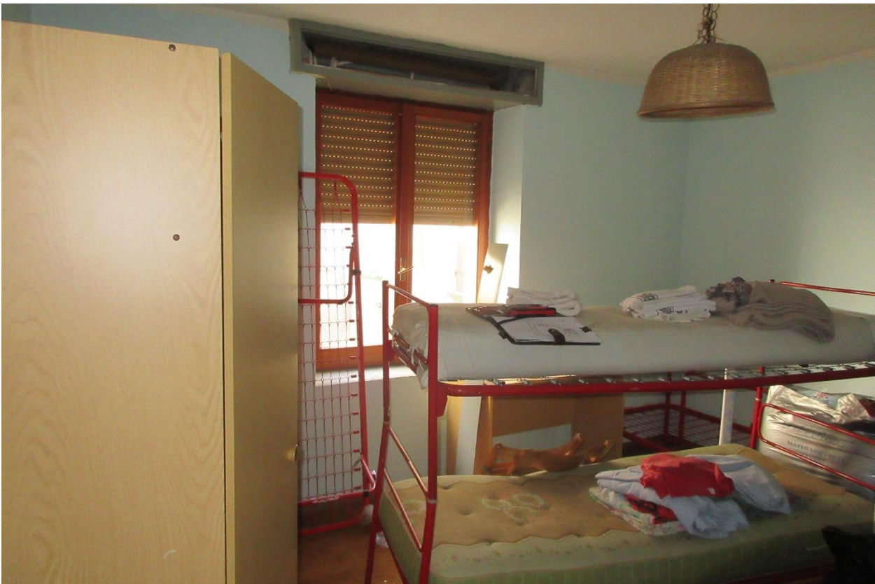
Locale ad uso camera al piano primo