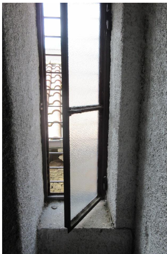
Particolare finestra in ferro con vetro singolo sul vano scala