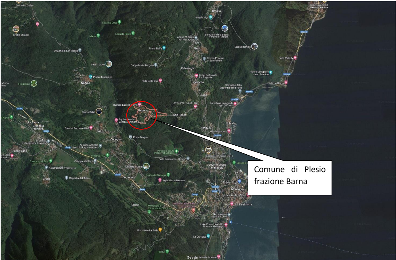
Estratto di Google Maps del Comune di Plesio frazione Barna