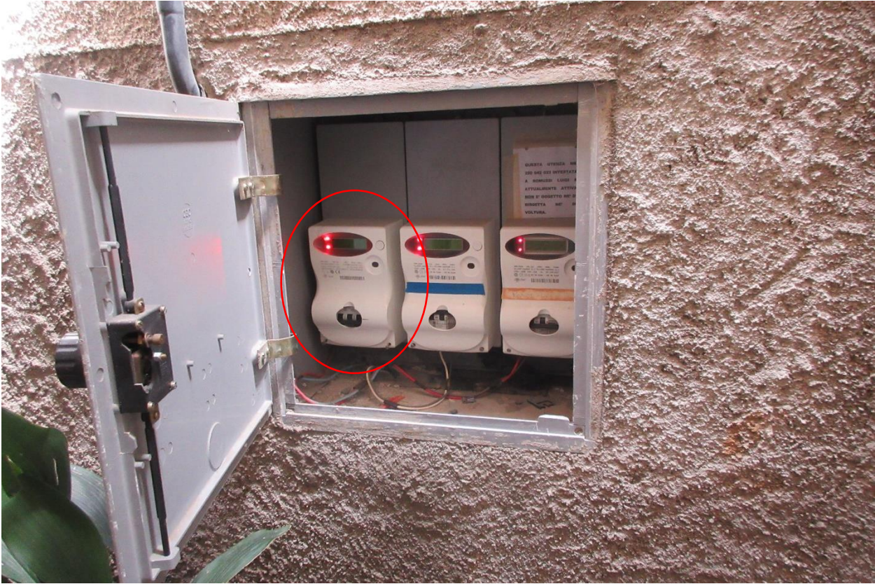
Contatore elettrico dell'U.I. staccato