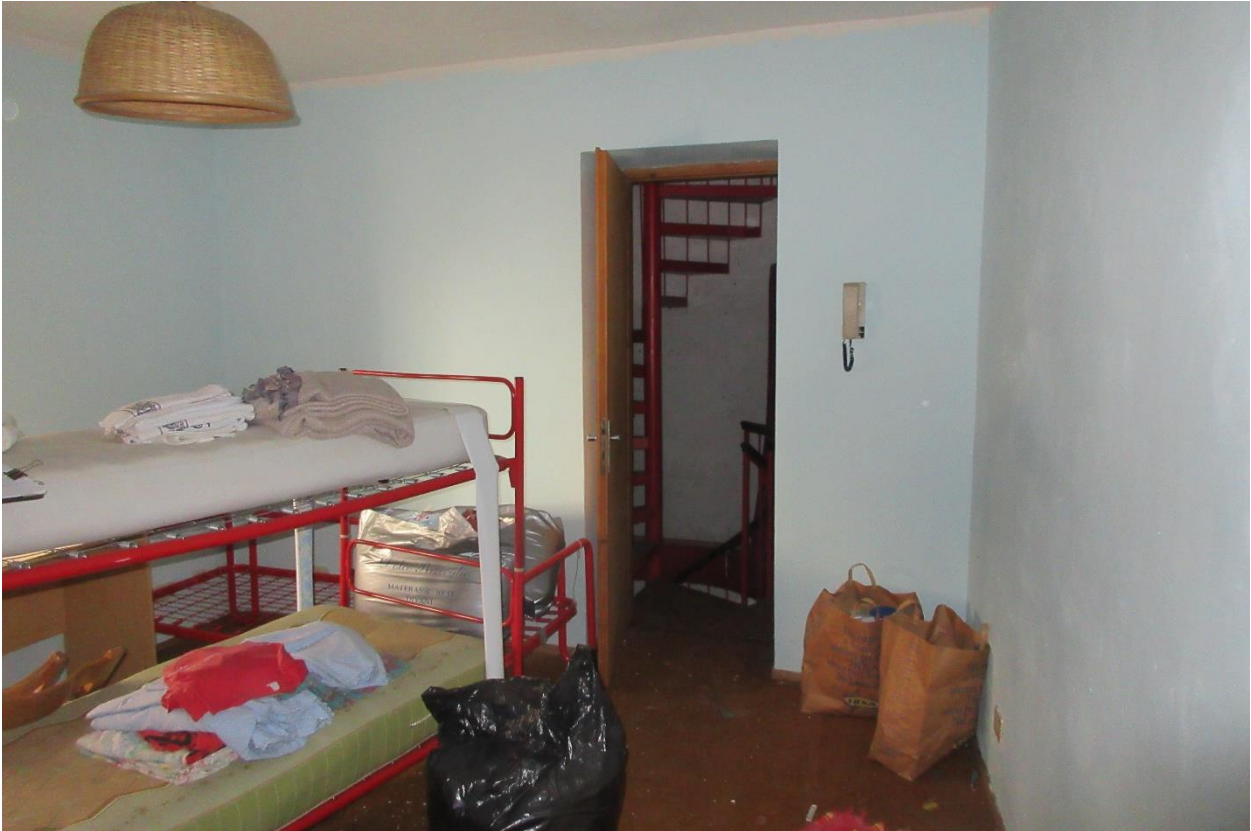
Vista della scala a chiocciola che collega i vari piani