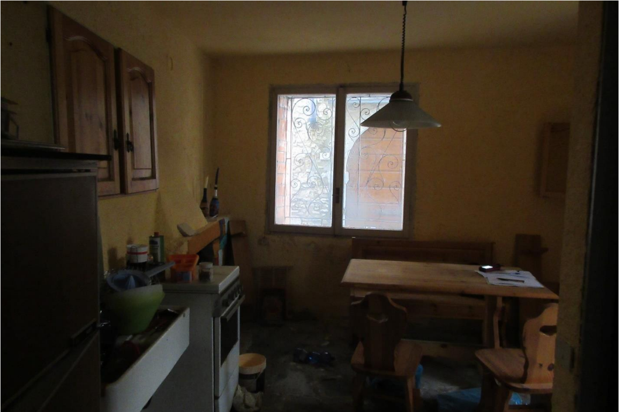
Locale soggiorno con angolo cottura al piano terra