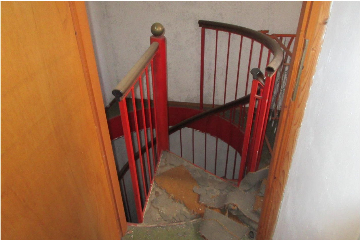
Arrivo della scala a chiocciola in ferro al piano secondo