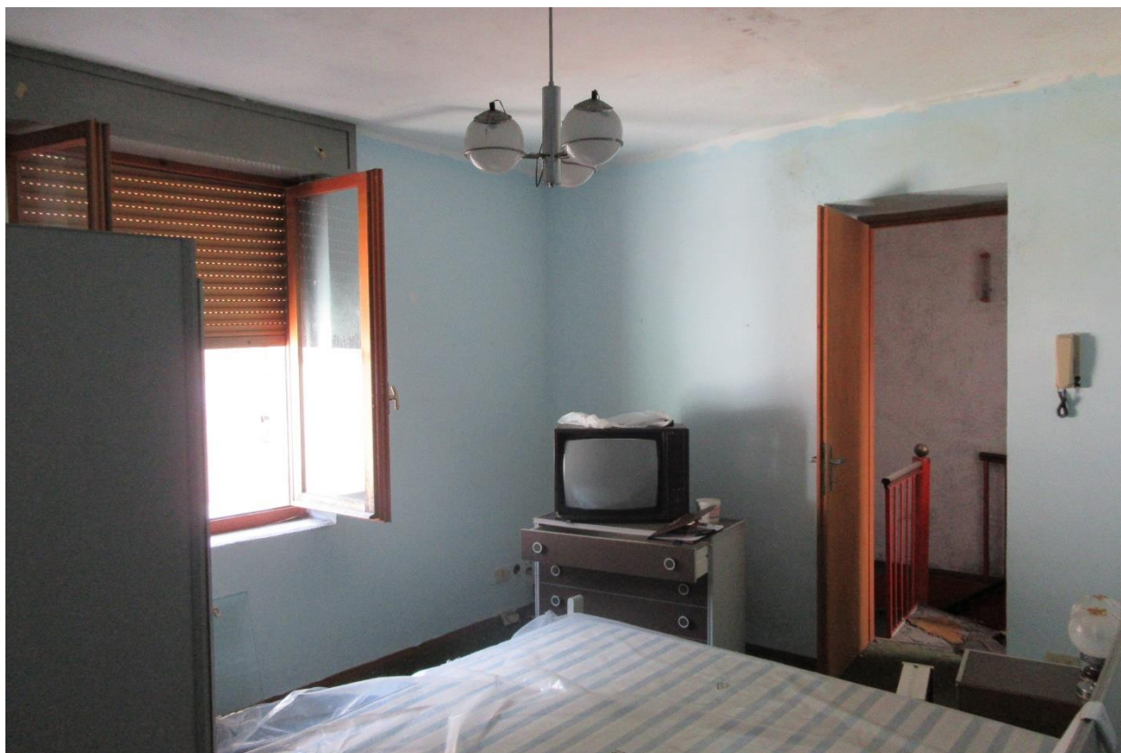
Locale ad uso camera al piano secondo