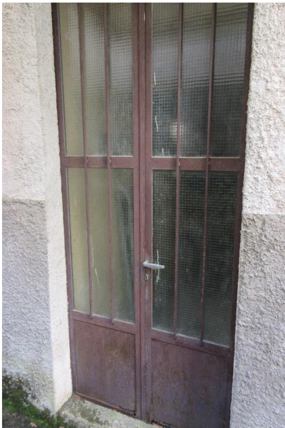
Ingresso U.I. oggetto d' esecuzione con porta in ferro e vetri