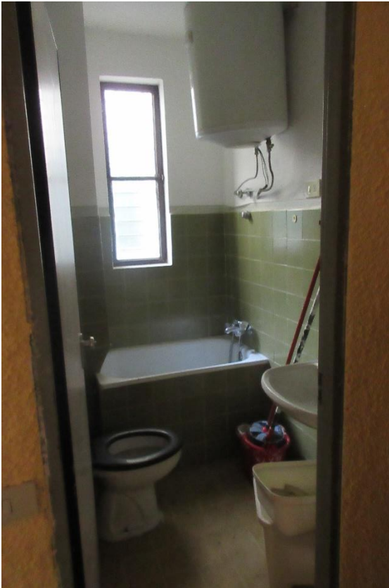
Bagno con ingresso dal soggiorno