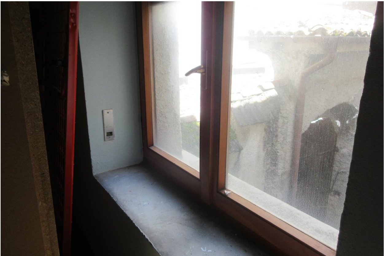
Particolare finestra in legno con vetro singolo e tapparelle in PVC con corda rotta