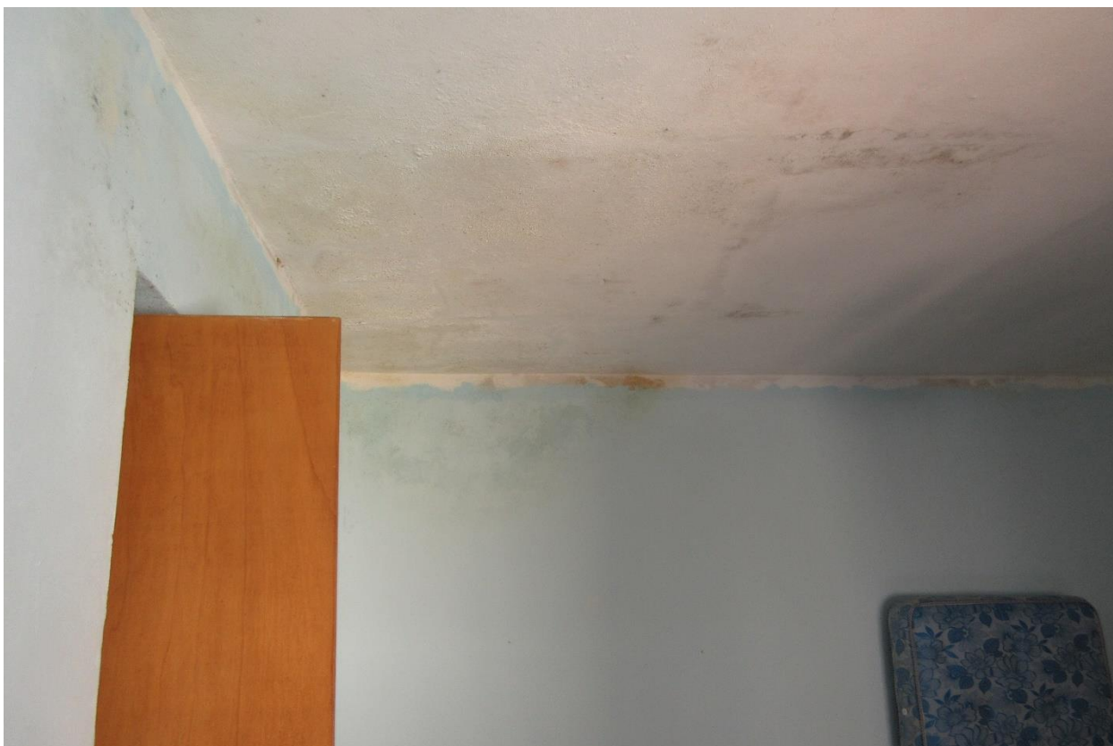
Segni evidenti di infiltrazioni sul soffitto della camera al secondo piano