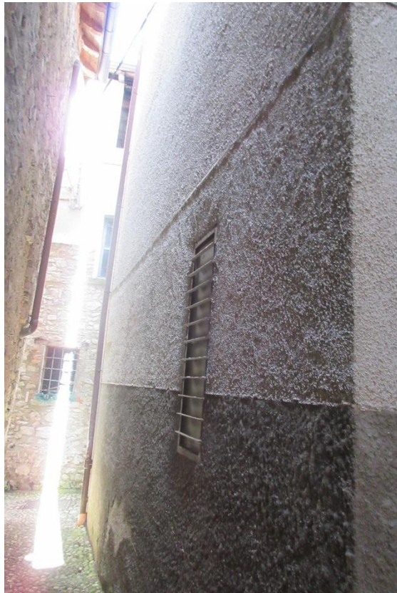
Via del Pozzo Bernasco