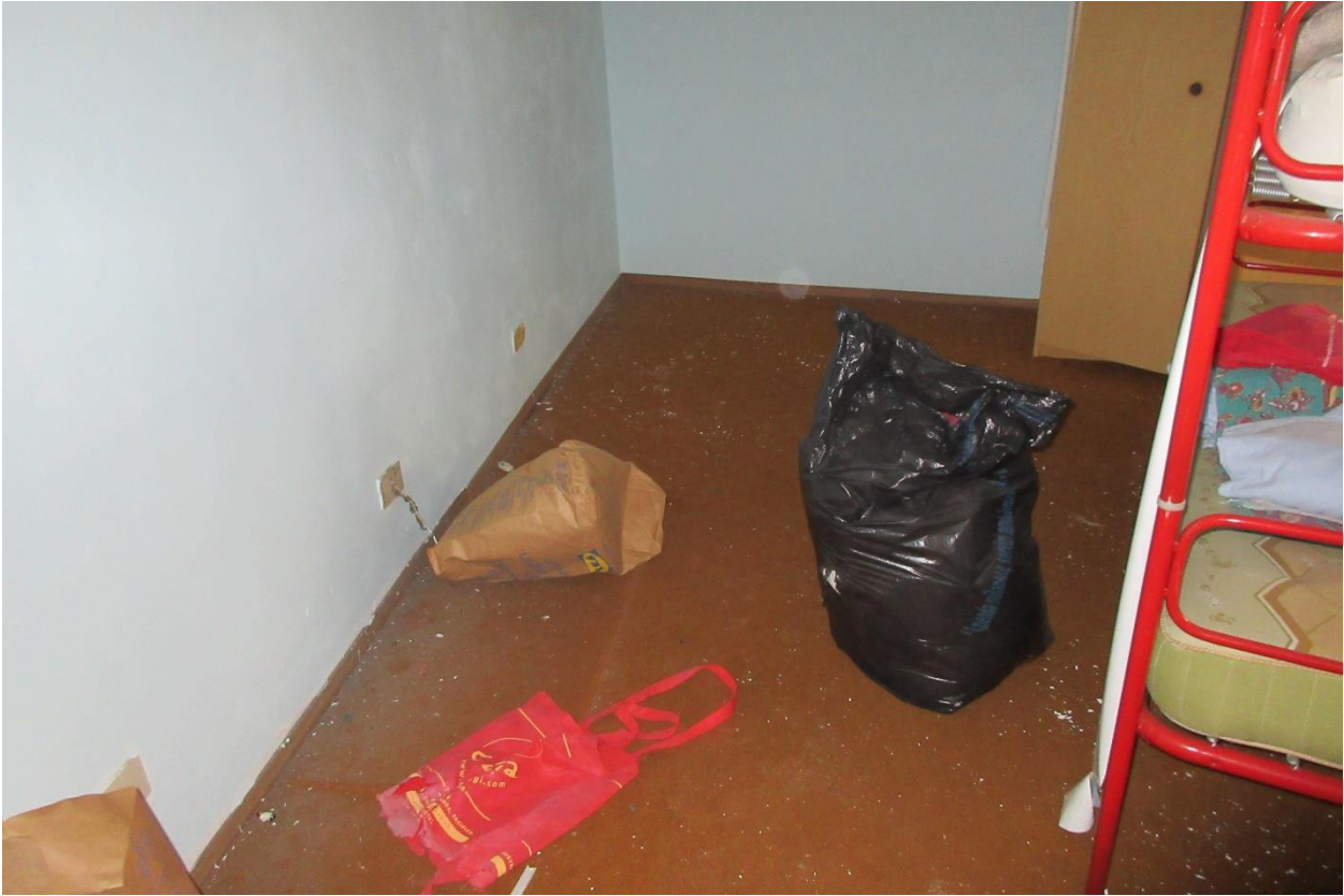
Particolare pavimento coperto da moquette nella camera al piano primo