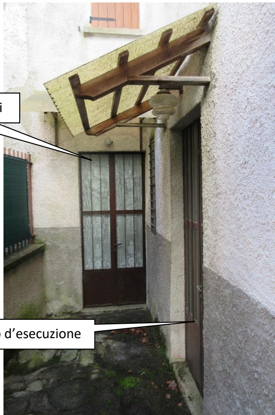
Corte d'ingresso comune