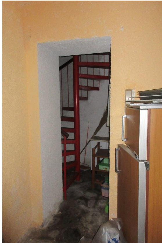
Scala a chiocciola in ferro che da accesso ai piani superiori