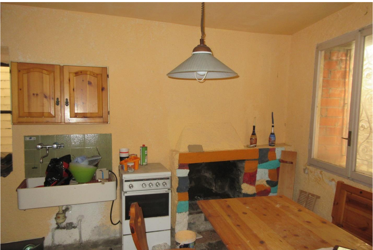
Camino a legna di tipo tradizionale