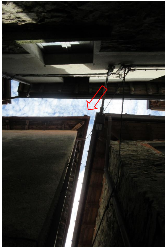
Vista della tegola pericolante sul tetto con affaccio sulla sottostante via pubblica Terragno