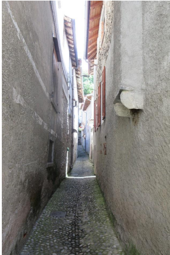
Vista dalla Via Terragna