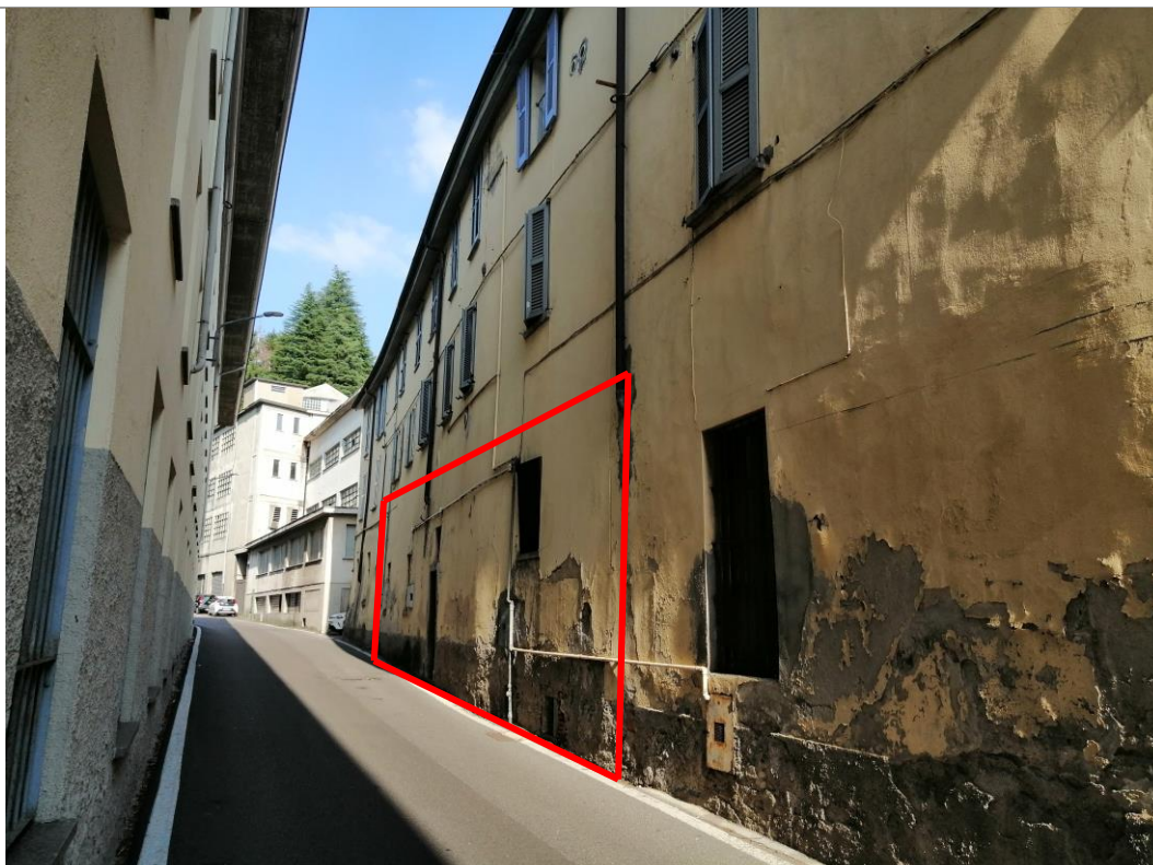
Individuazione unità da via Pannilani