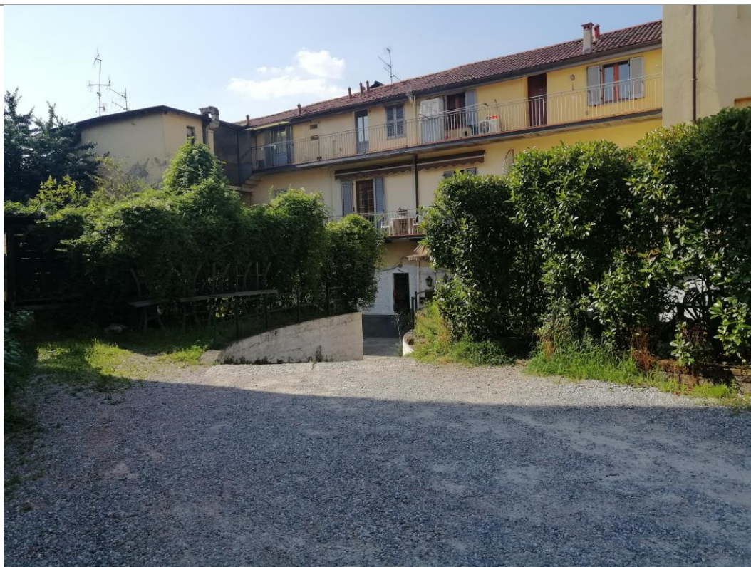
Area esterna ad uso parcheggio