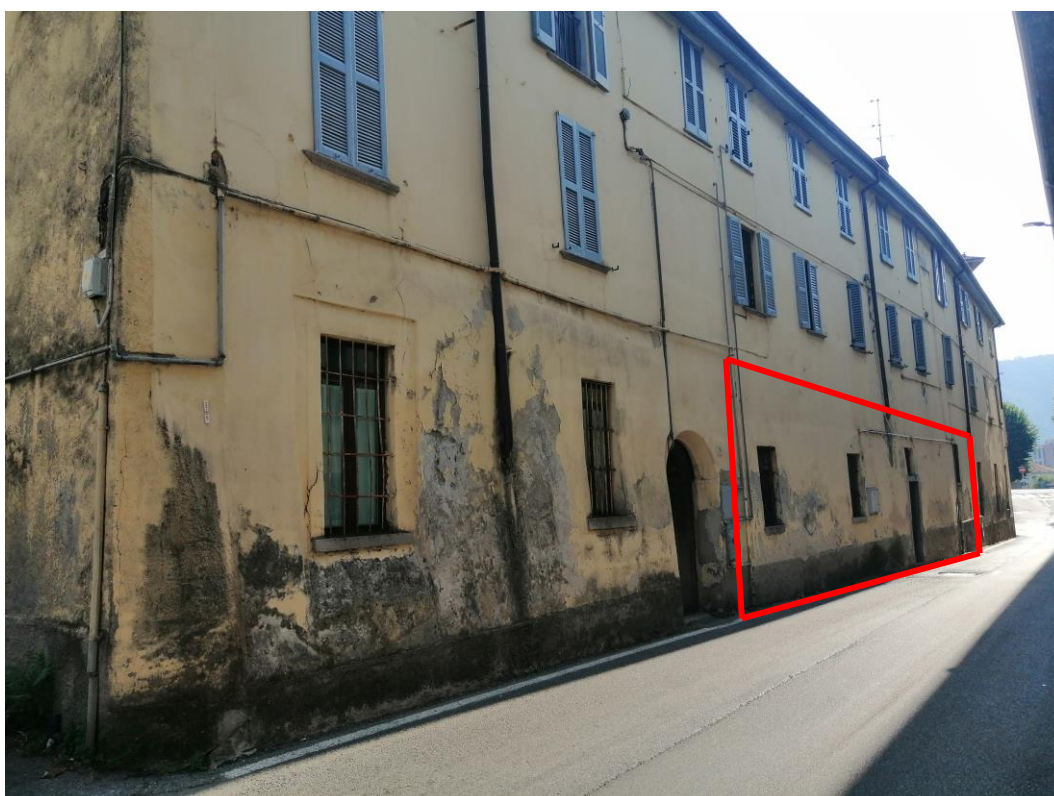
Individuazione unità da via Pannilani