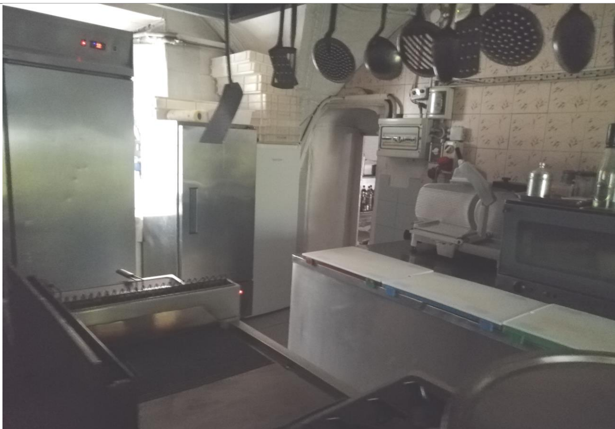
Vista interna – Cucina