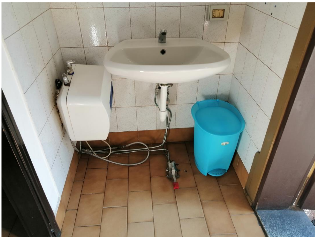
Vista interna – Bagno