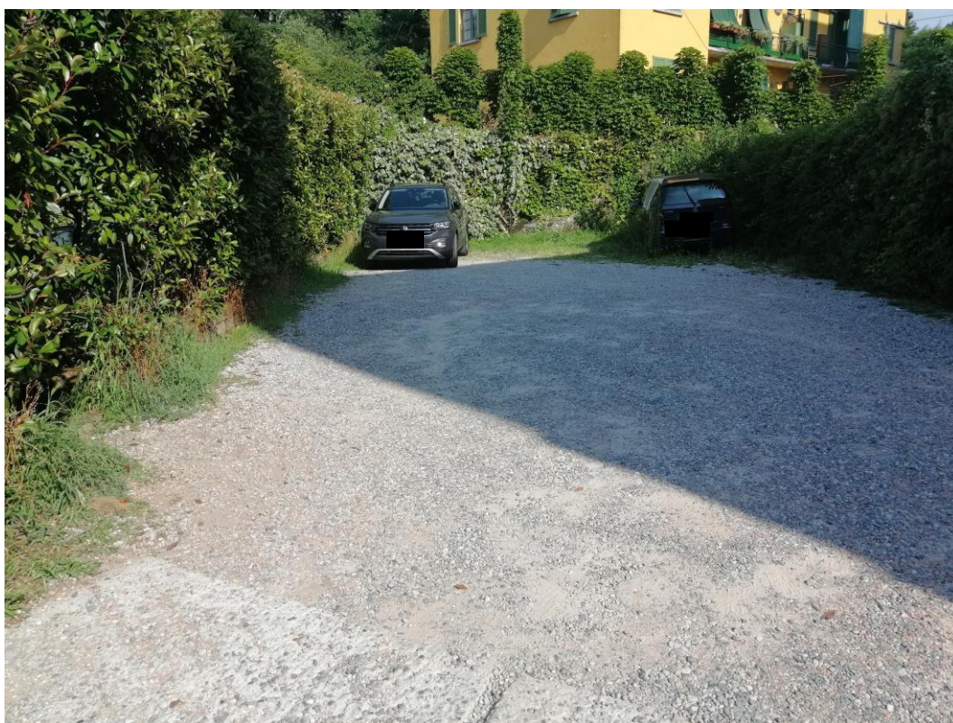
Area esterna ad uso parcheggio