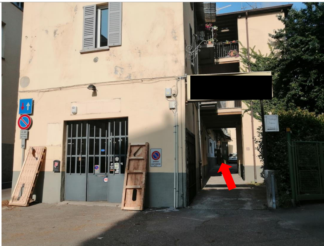
Ingresso alla corte interna