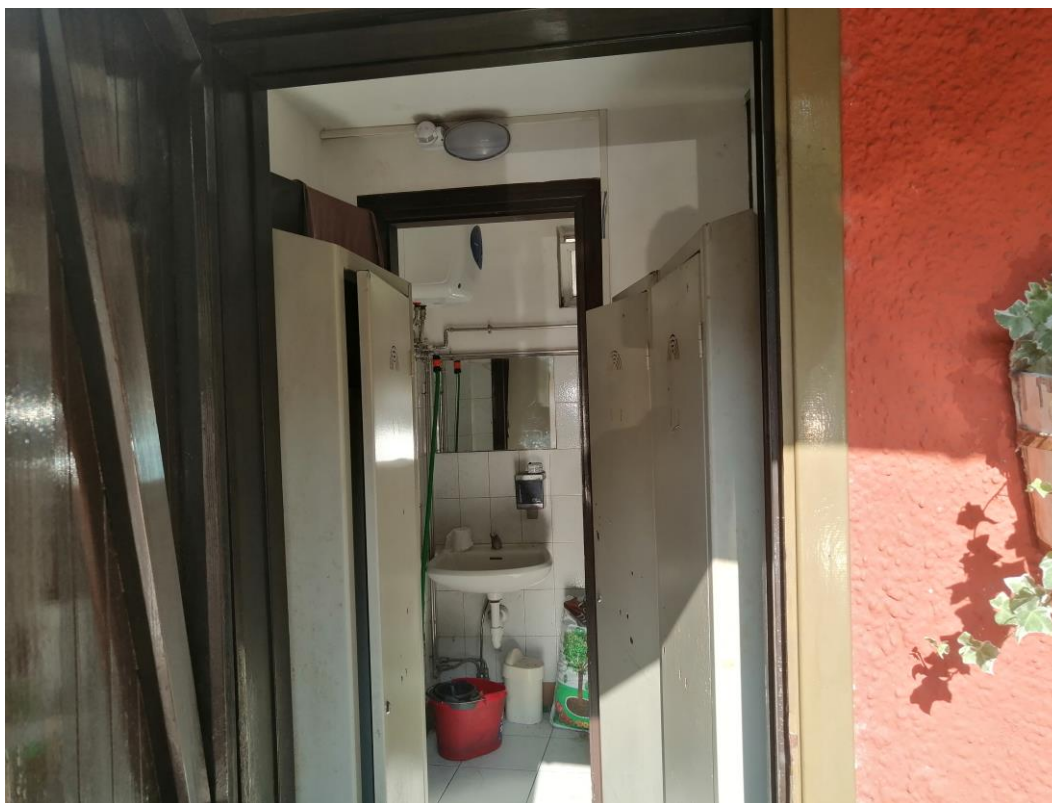
Vista interna – Spogliatoio