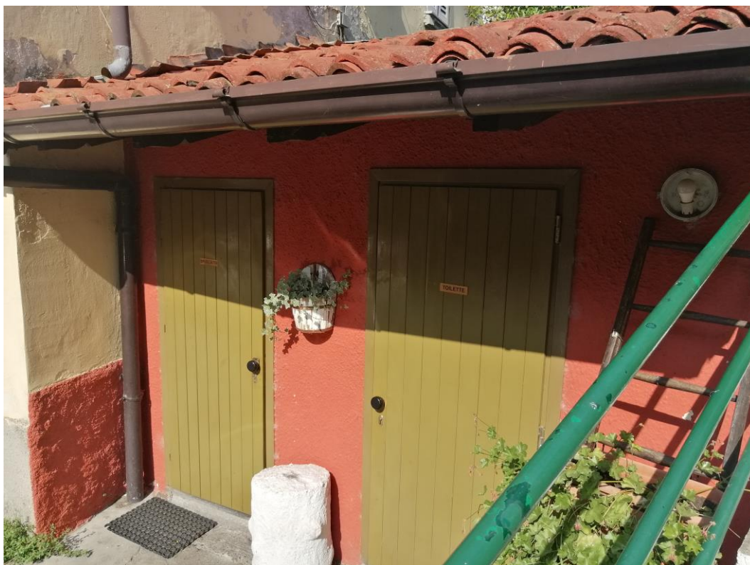
Vista esterna – Spogliatoio e Bagni