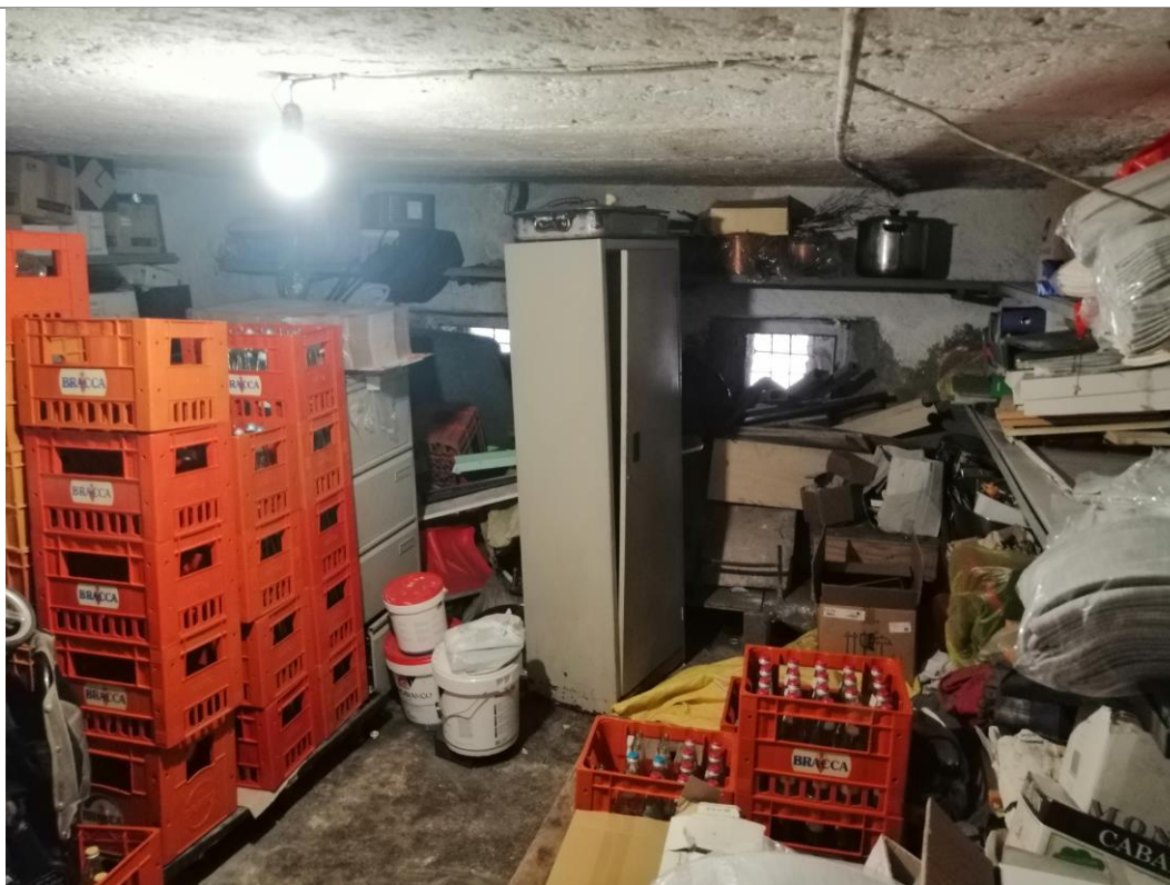
Vista interna – cantina