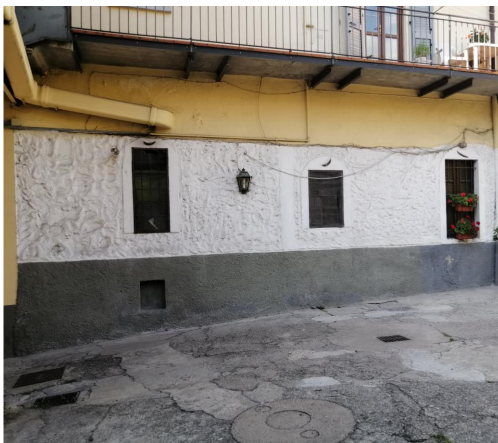
Vista dalla corte (presenza di canna fumaria in amianto)