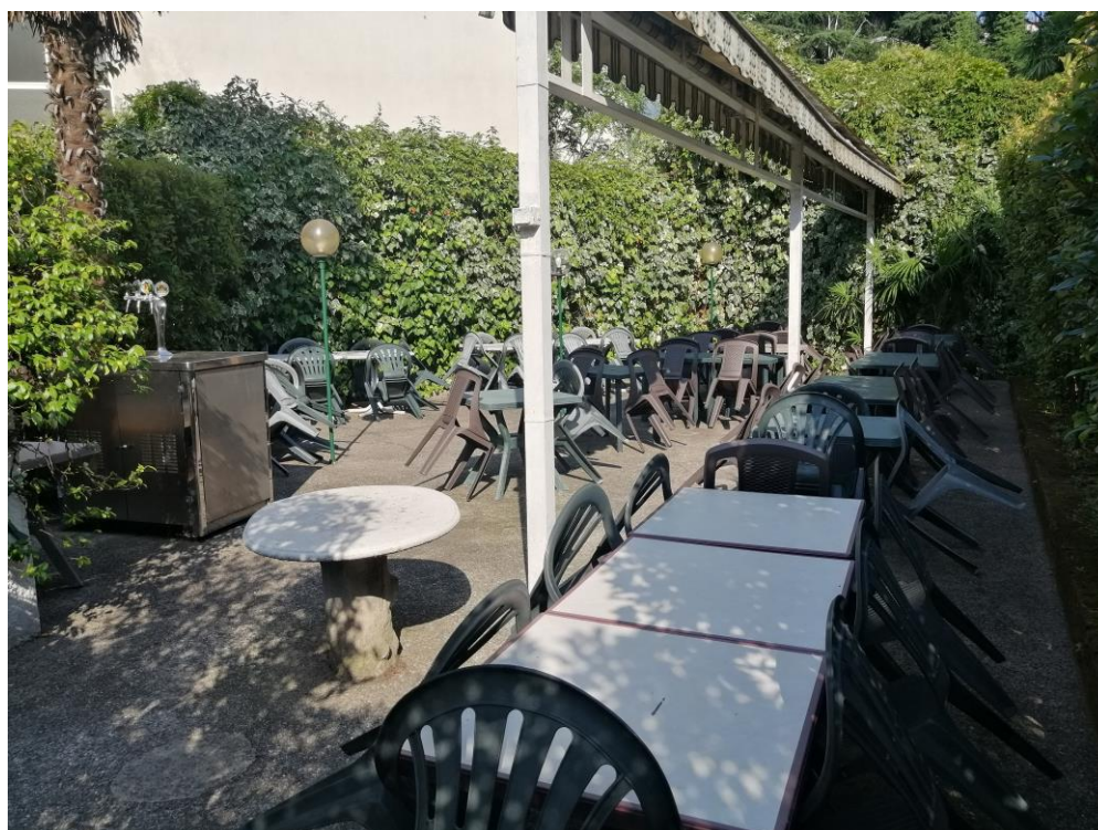
Area esterna per il servizio all'aperto