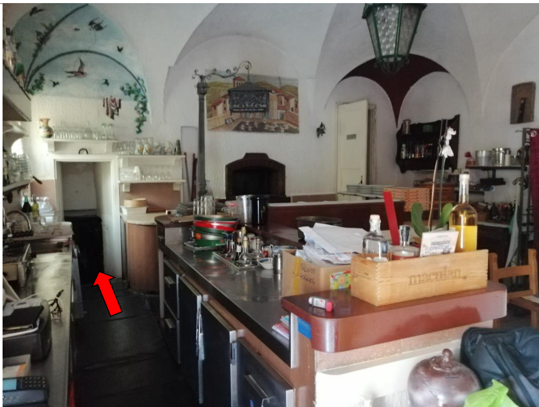
Vista interna della sala – (accesso alla cantina)