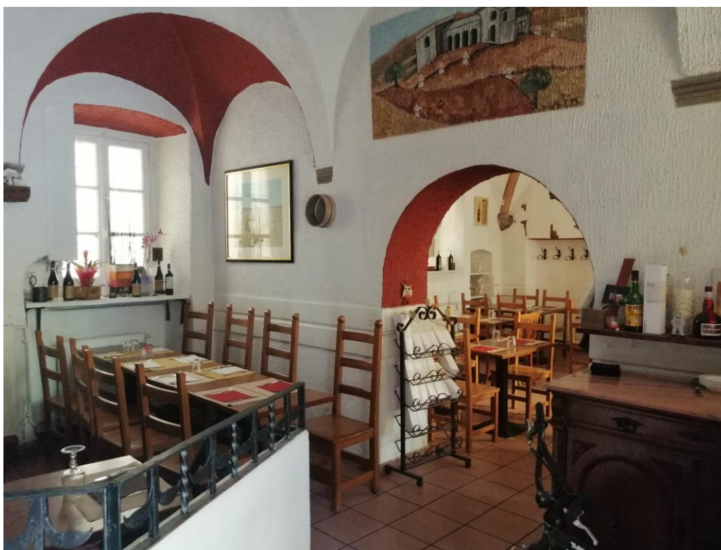
Vista interna – sala ristorante / pizzeria