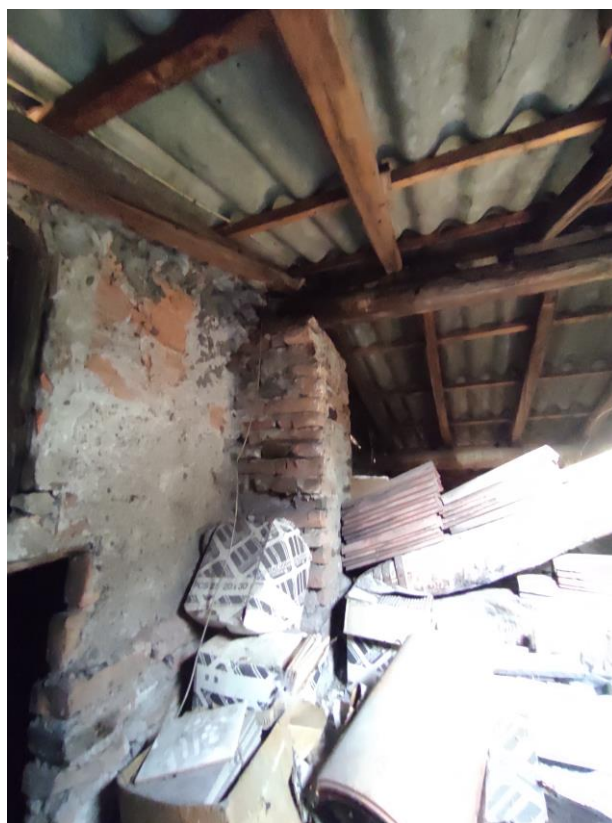
Vista interna sottotetto: presenza di lastre in amianto