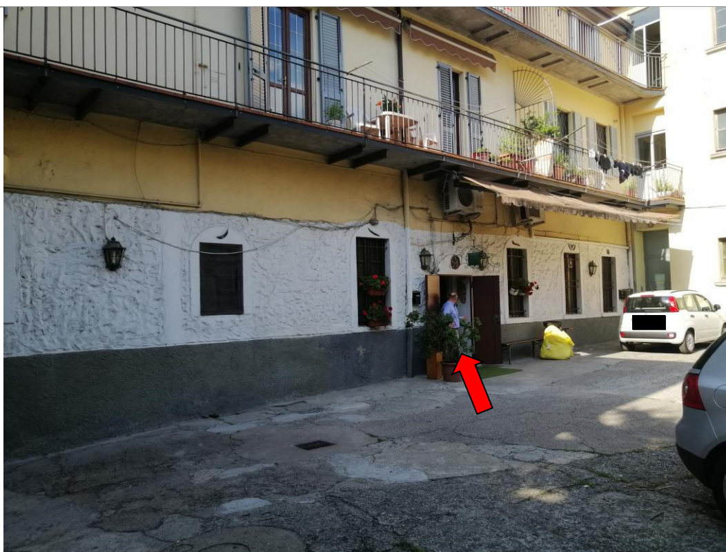
Vista dalla corte – ingresso al locale