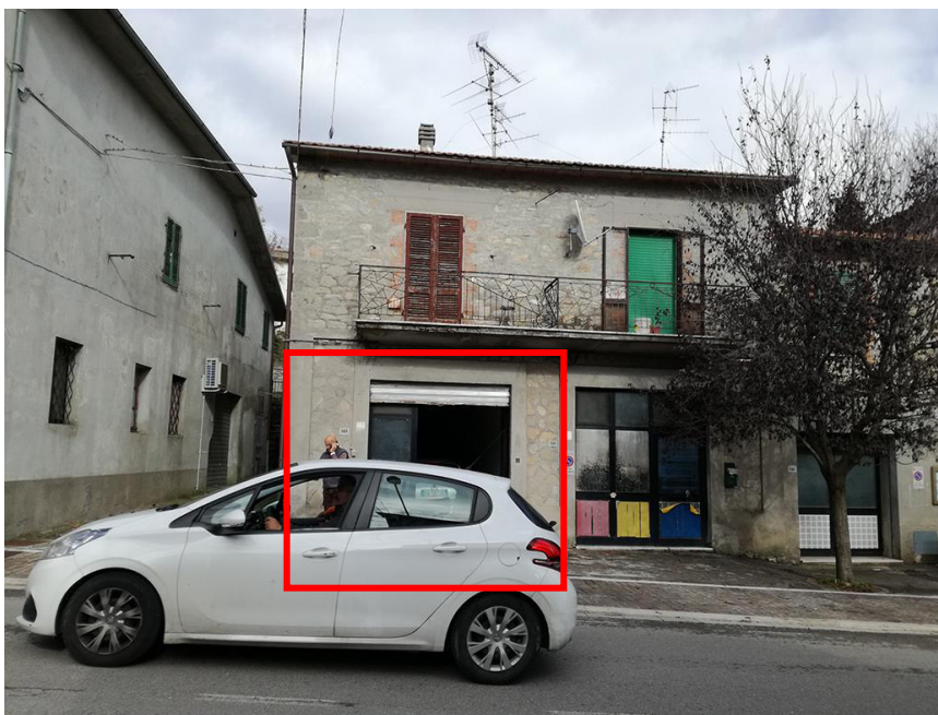
Fig. 1 – Prospetto su strada principale (su cui affaccia anche il balcone dell’immobile “B”)