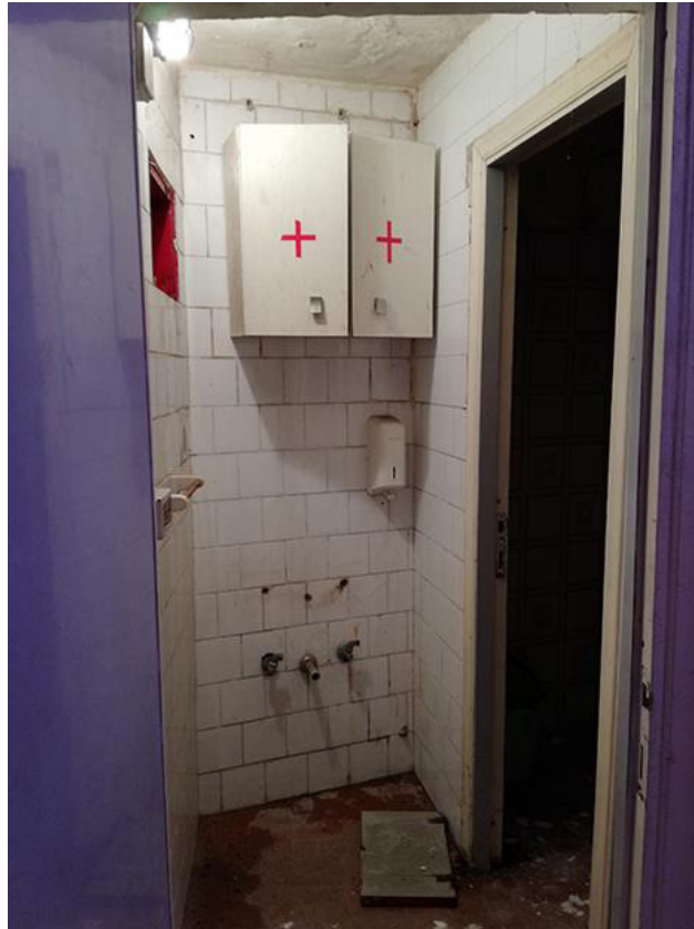
Fig. 6 – Wc