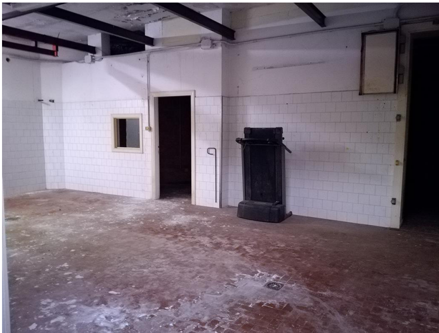
Fig. 4 – Vano sul retro