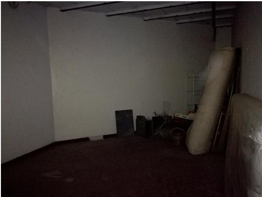
Fig. 8 – Cella frigo sul retro, controterra