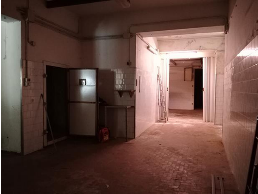
Fig. 3 – Vano centrale con vista cella frigo a sinistra