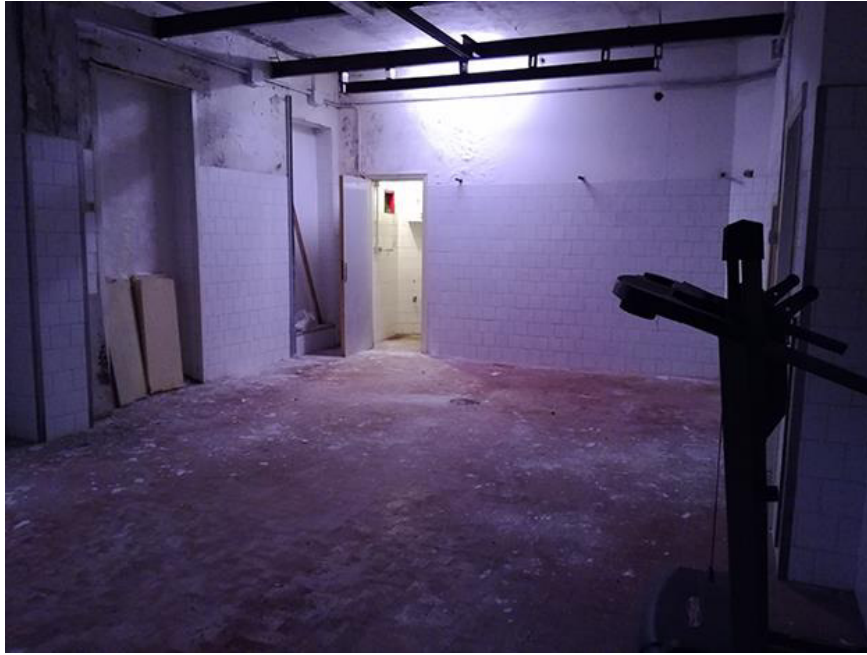
Fig. 5 – Vano sul retro con vista verso wc