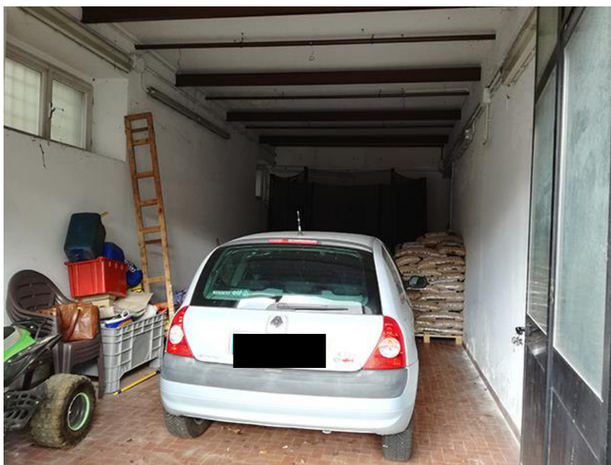
Fig. 2 – Vano con accesso carrabile