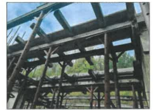
FOTO 24 - Predisposizione per solco per cemento piano semint.