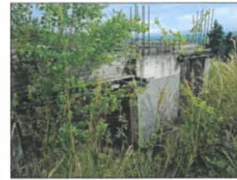
FOTO 17 - Fabbricato in costruzione