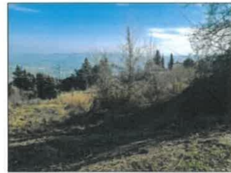
FOTO 9 - Vista costruzione inglobata dalla vegetazione