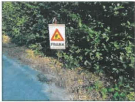
FOTO 4 - Strada soggetta a frane