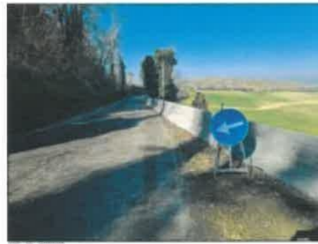
FOTO 5 - Porzione di strada messa in sicurezza