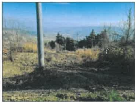
FOTO 7 - Vista del terreno con palo della luce da interrare