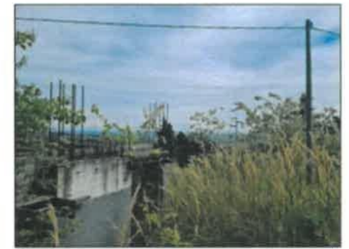
FOTO 21 - Piano seminterrato senza solaio superiore