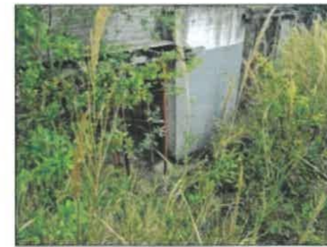
FOTO 20 - Piano seminterrato