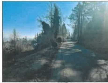
FOTO 2 - Strada di accesso