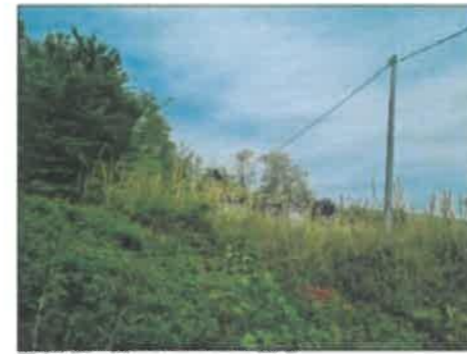
FOTO 13 - Vista laterale della linea enel da spostare/interrare