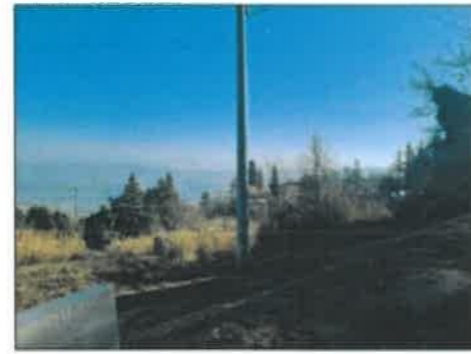
FOTO 6 - Varco sulla proprietà dalla strada di accesso