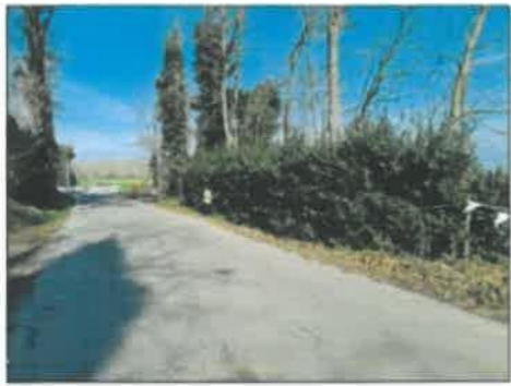
FOTO 1 - Strada di accesso