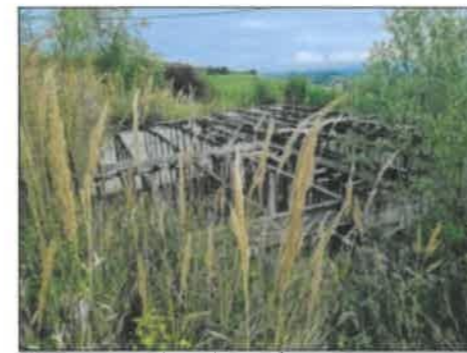
FOTO 19 - Vista del piano seminterrato in costruzione