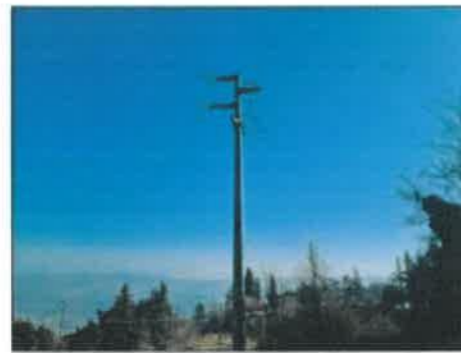
FOTO 8 - Palo della luce da spostare ed interrare