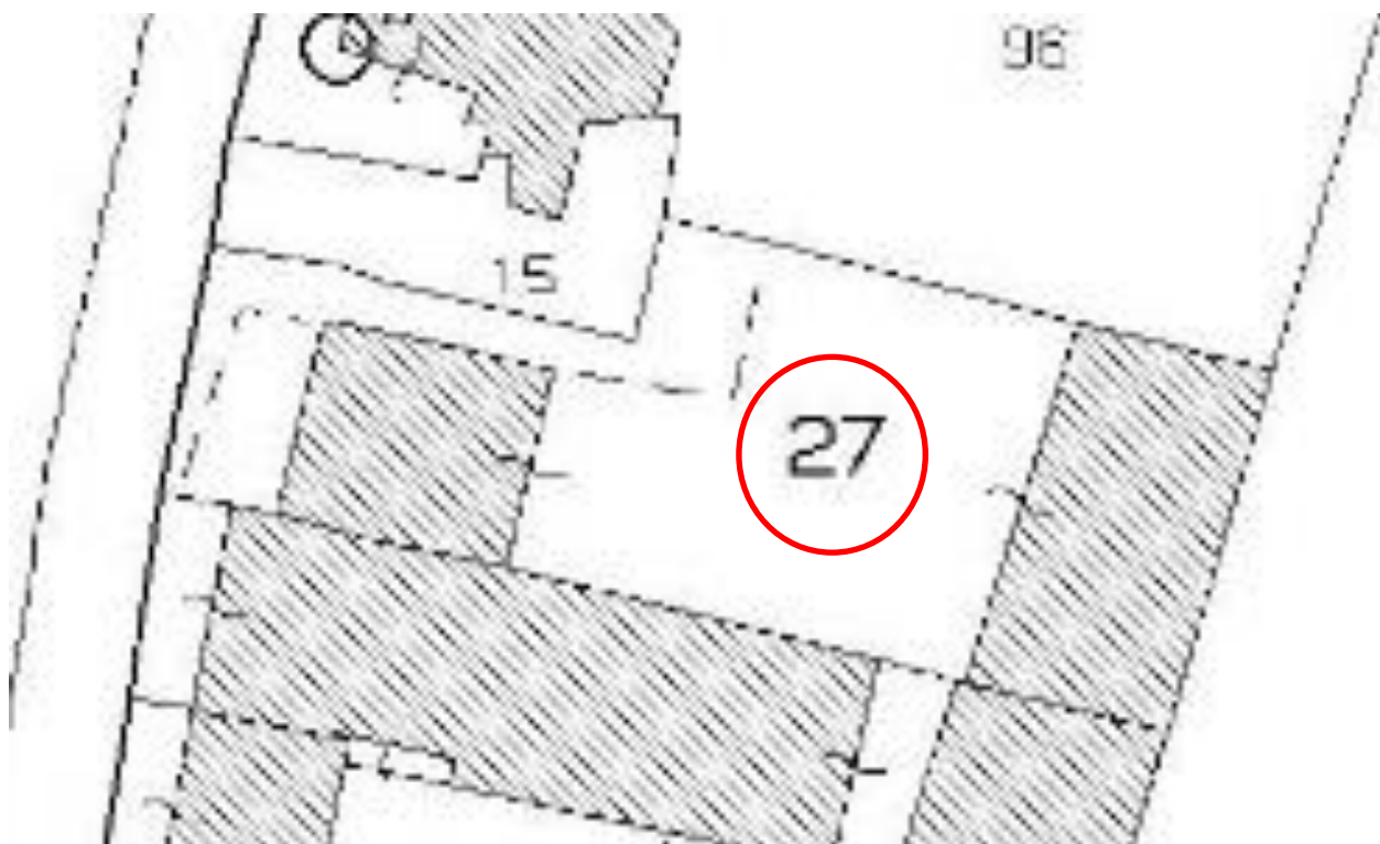
Fot. 4 - Pianta Sub. 1

Inseriamo ora di seguito la rappresentazione grafica del bene, non in scala definita, desunta dalla documentazione catastale.