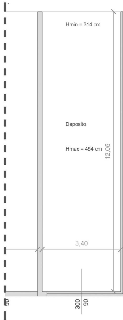
Fot. 3 - Pianta Sub. 4

Inseriamo ora di seguito la restituzione grafica, non in scala definita, del rilievo effettuato in loco.