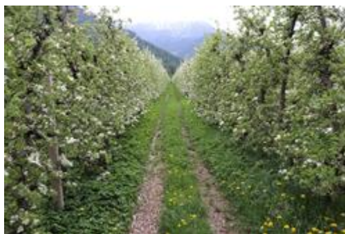
Meleto della varietà Golden e Red Delicious