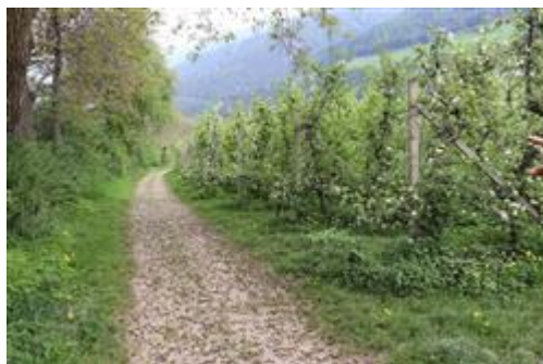
Meleto della varietà Golden e Red Delicious