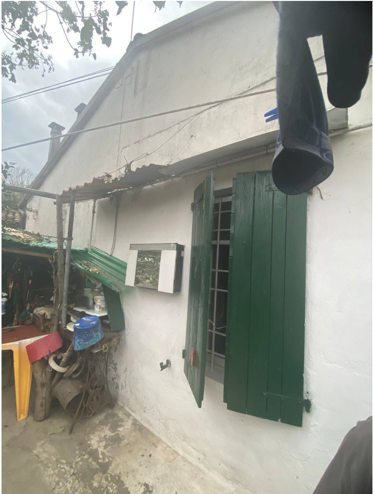
Fot.11 - Vista dell'unità immobiliare esecutata, lato corte interna.