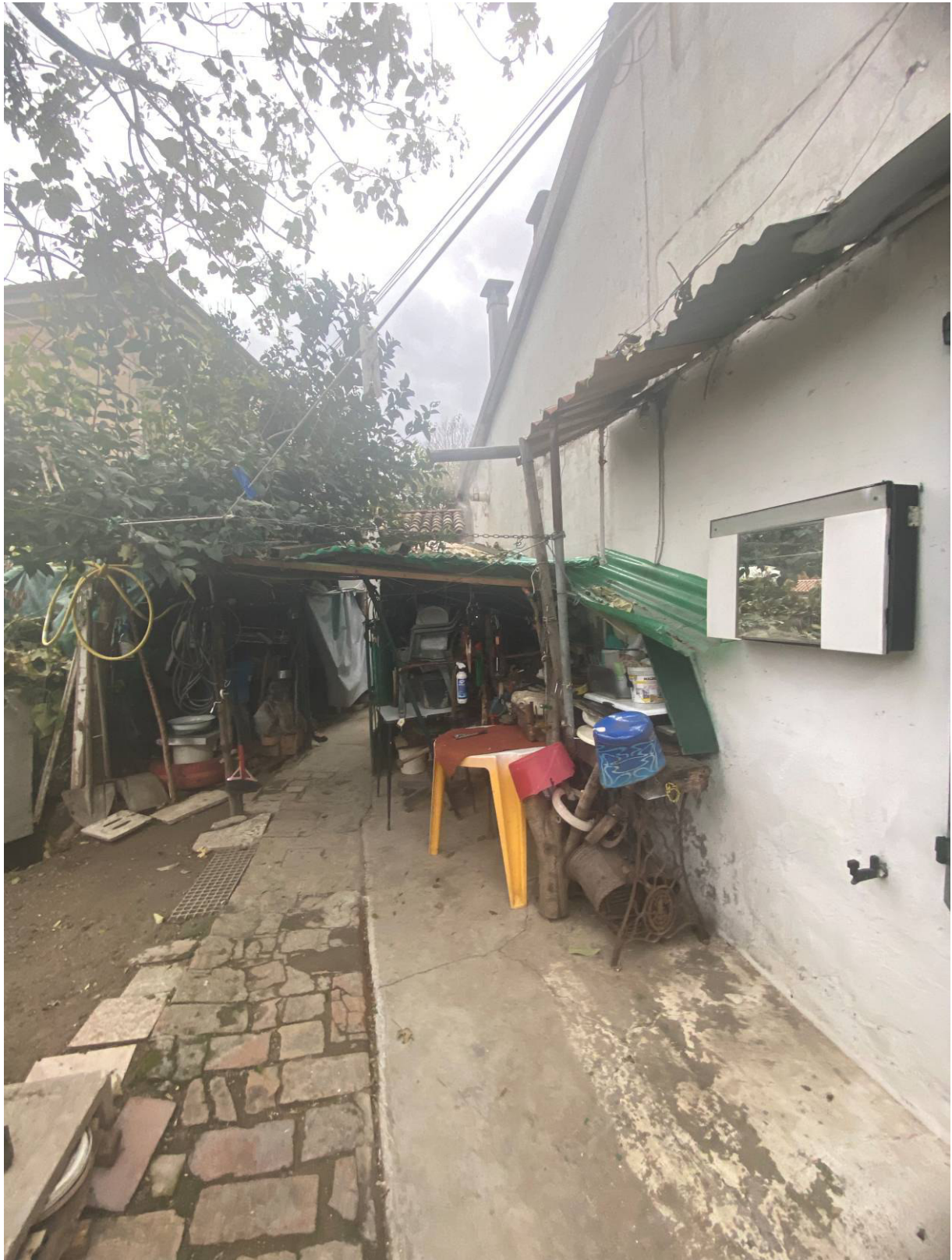
Fot.10 - Vista della corte interna.