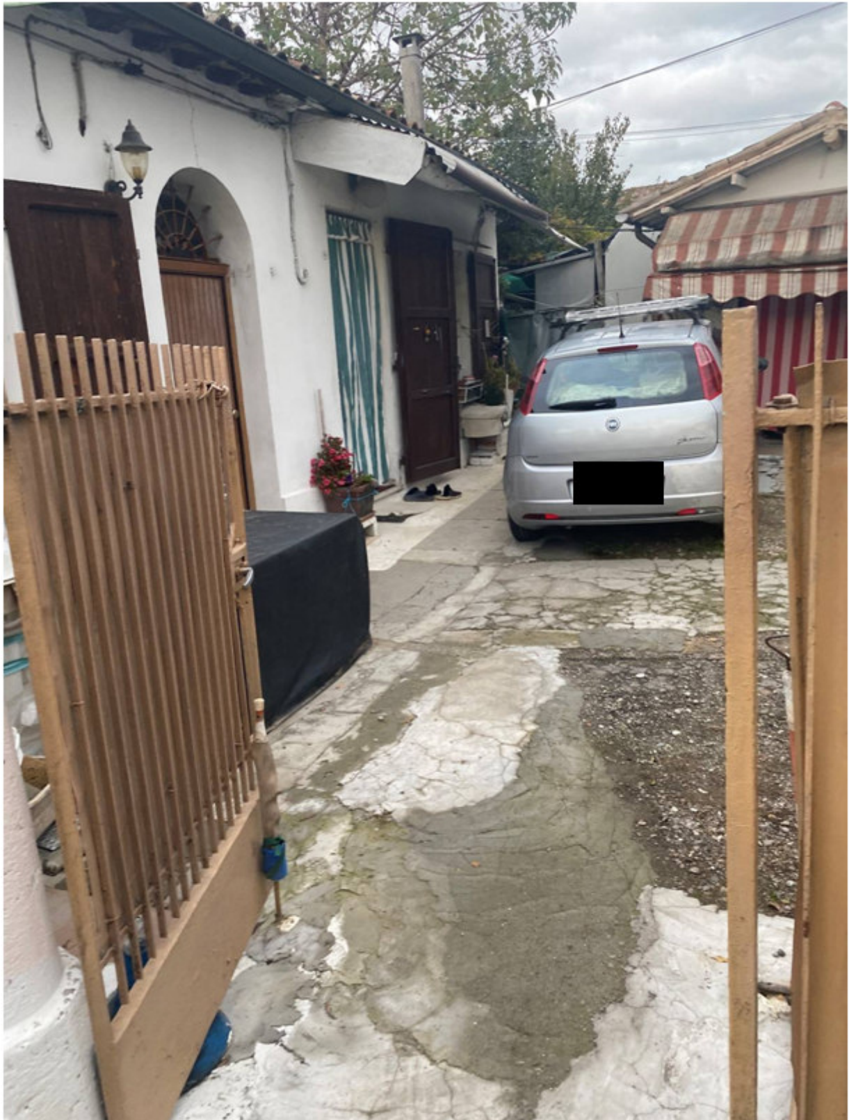
Fot.1 - Vista dell'ingresso all' altra proprietà e all' unità immobiliare pignorata, in fotografia con la tenda bianco-verde. Questo ambito spaziale è la servitù di passaggio