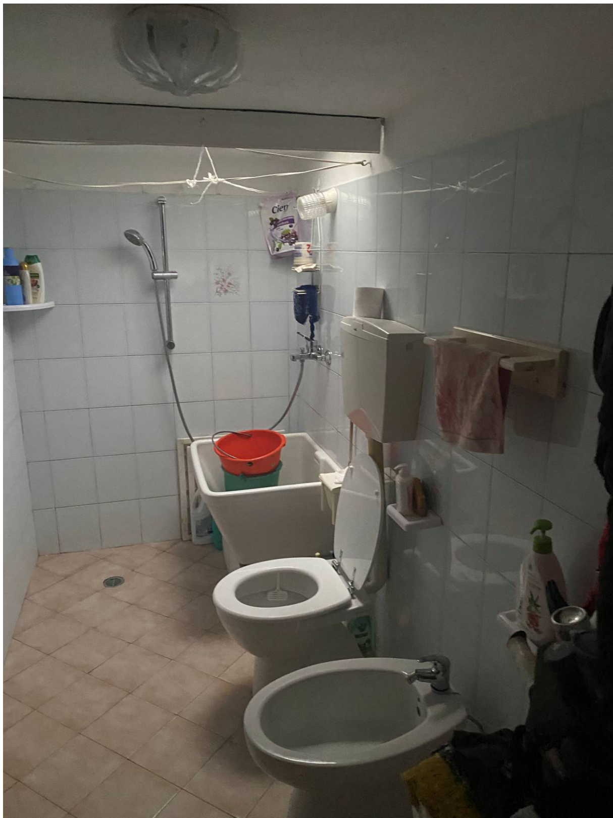
Fot.7 - Vista del servizio igienico interno.