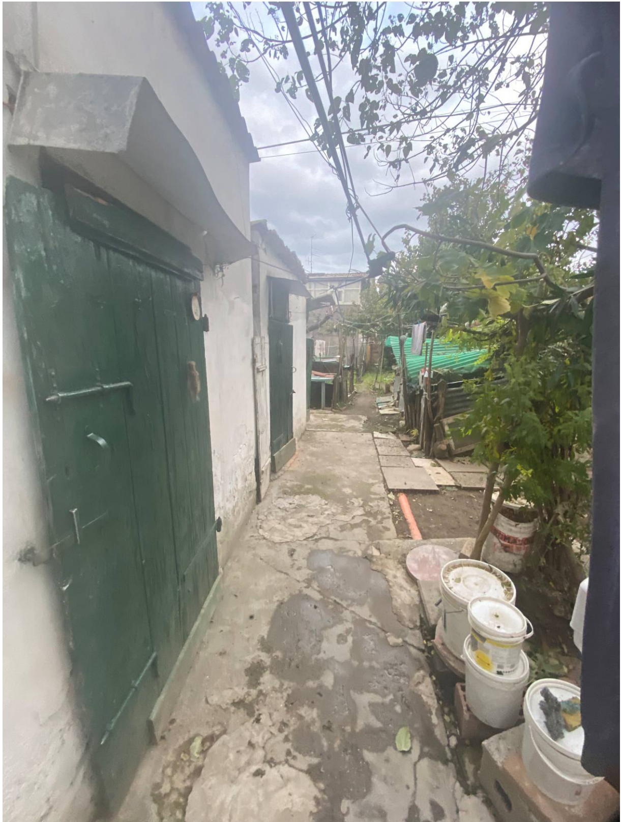
Fot.12 - Vista dei ripostigli esterni.