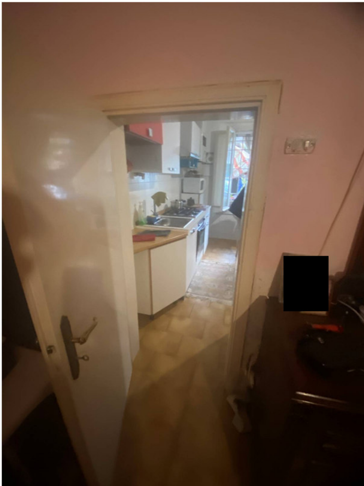
Fot.4 - Vista del passaggio tra il vano cucina-soggiorno e la camera da letto.