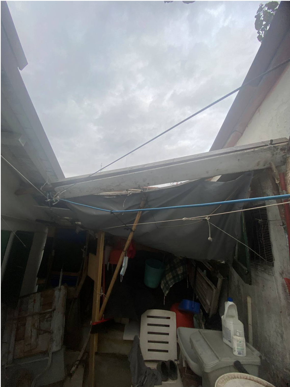
Fot.9 - Vista delle pensiline amovibili esterne già descritte al punto 02.E.