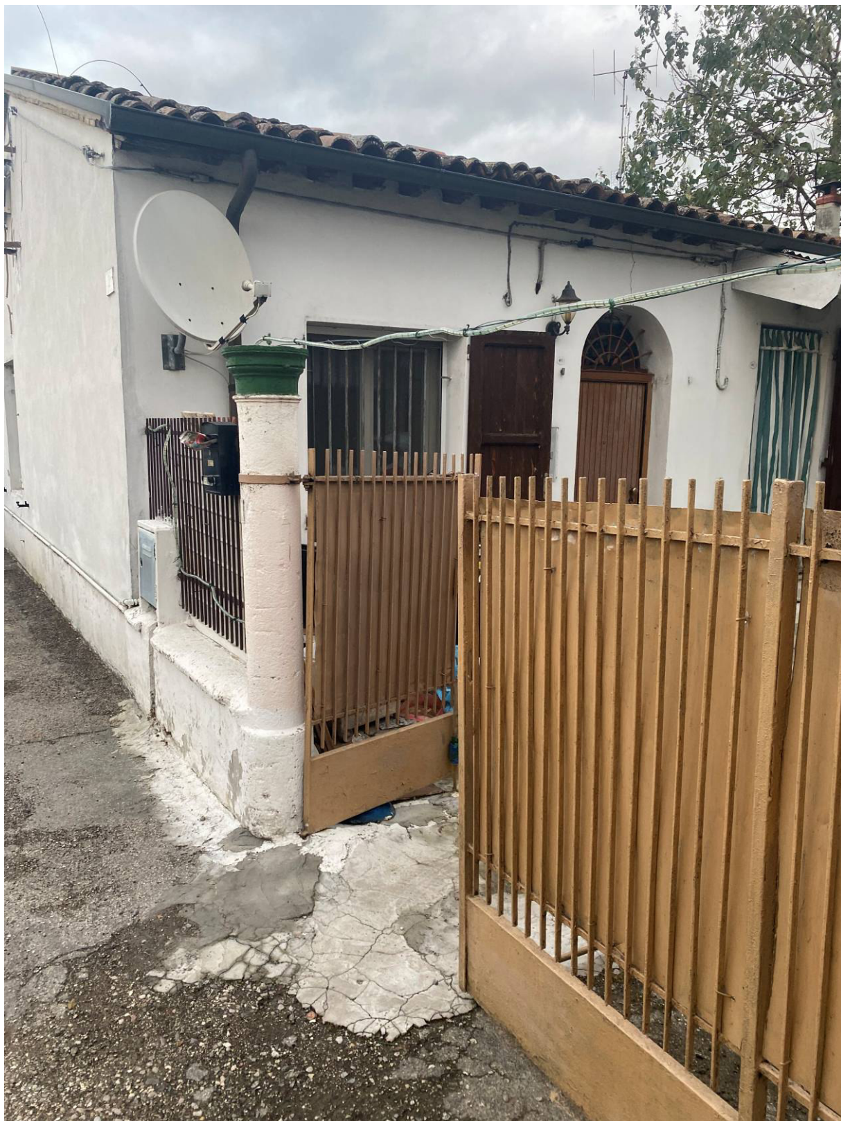
Fot.2 - Vista dell' unità immobiliare adiacente a quella pignorata.