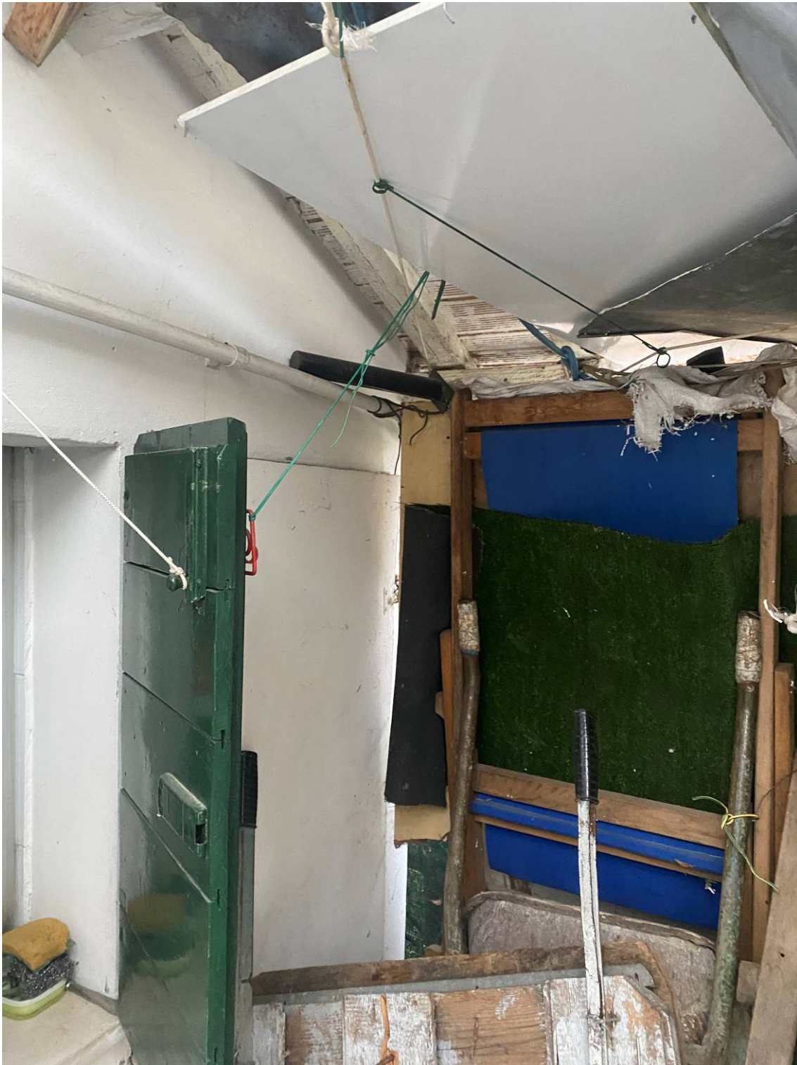
Fot.8 - Vista della finestra del servizio igienico e della porta di accesso alla cantina esterna (tinteggiata di bianco).