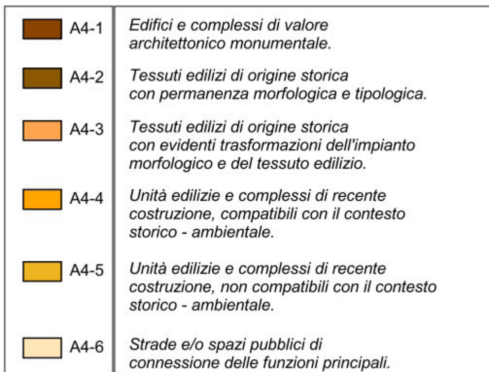
Legenda del RUE dei Nuclei Storici minori del Comune di Forlì.