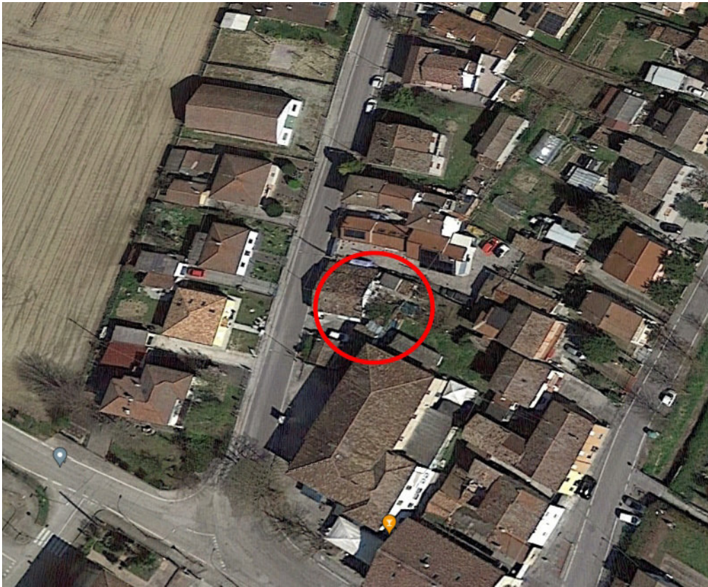
Individuazione del fabbricato nel contesto del Nucleo Storico di Roncadello, frazione di Forlì, sulla Via XIII Novembre 1944.