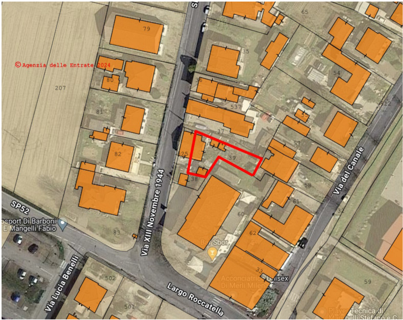
Sovrapposizione della planimetria catastale e dell'aerofotogrammetria