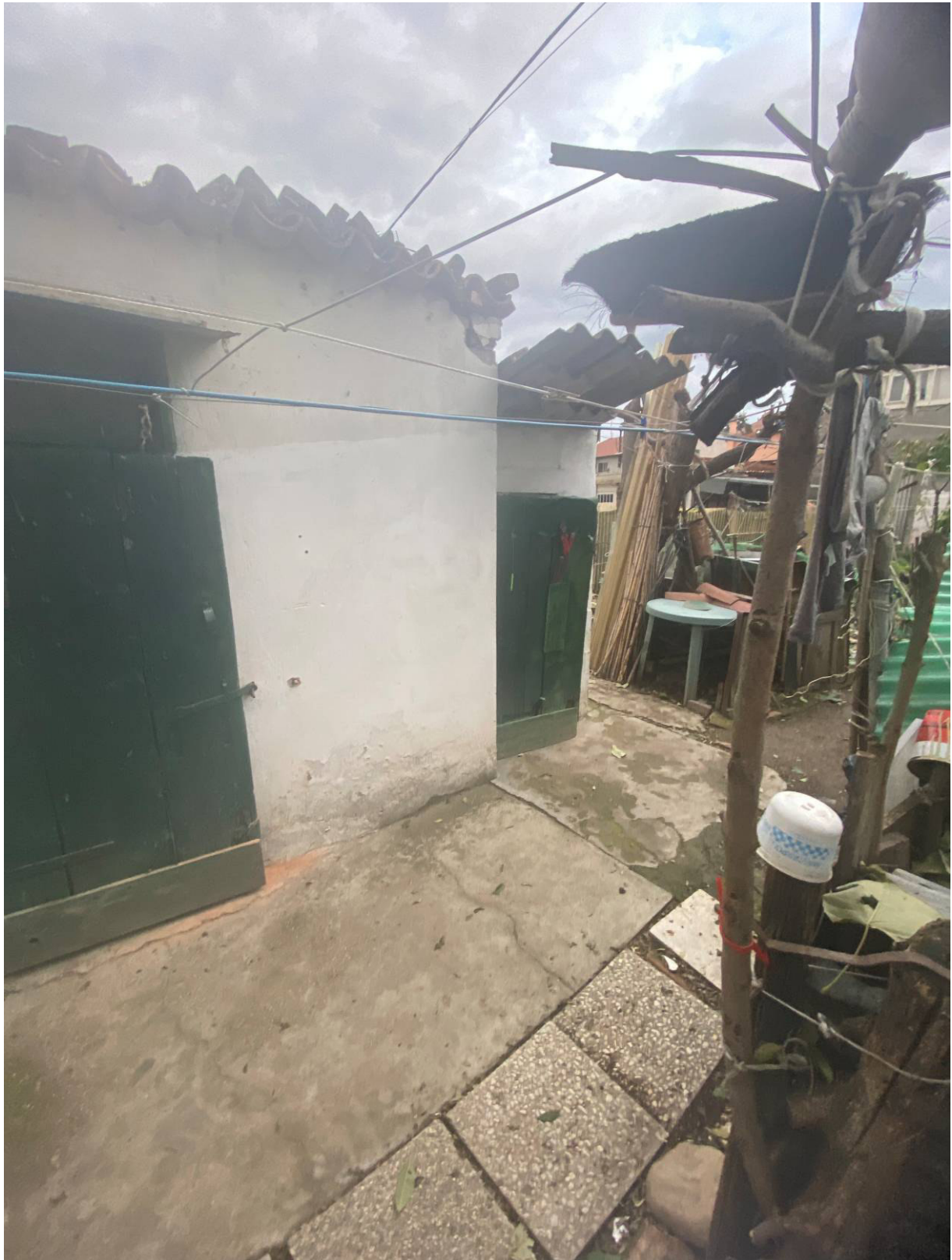
Fot.12 - Vista del servizio igienico esterno in disuso in adiacenza dei ripostigli.