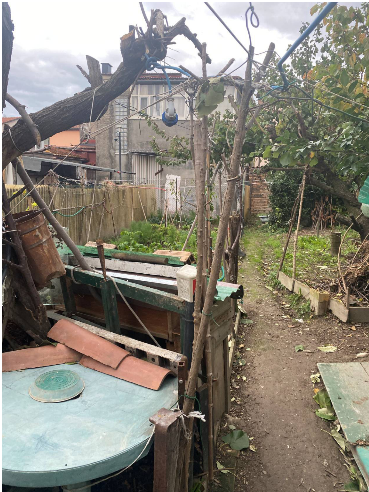
Fot.13 - Vista del piccolo orto all' interno della corte interna.