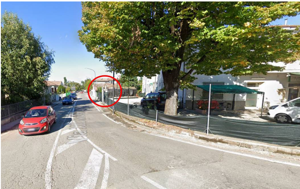
Individuazione del fabbricato nel contesto del Nucleo Storico di Roncadello – vista da Largo Roccatella.