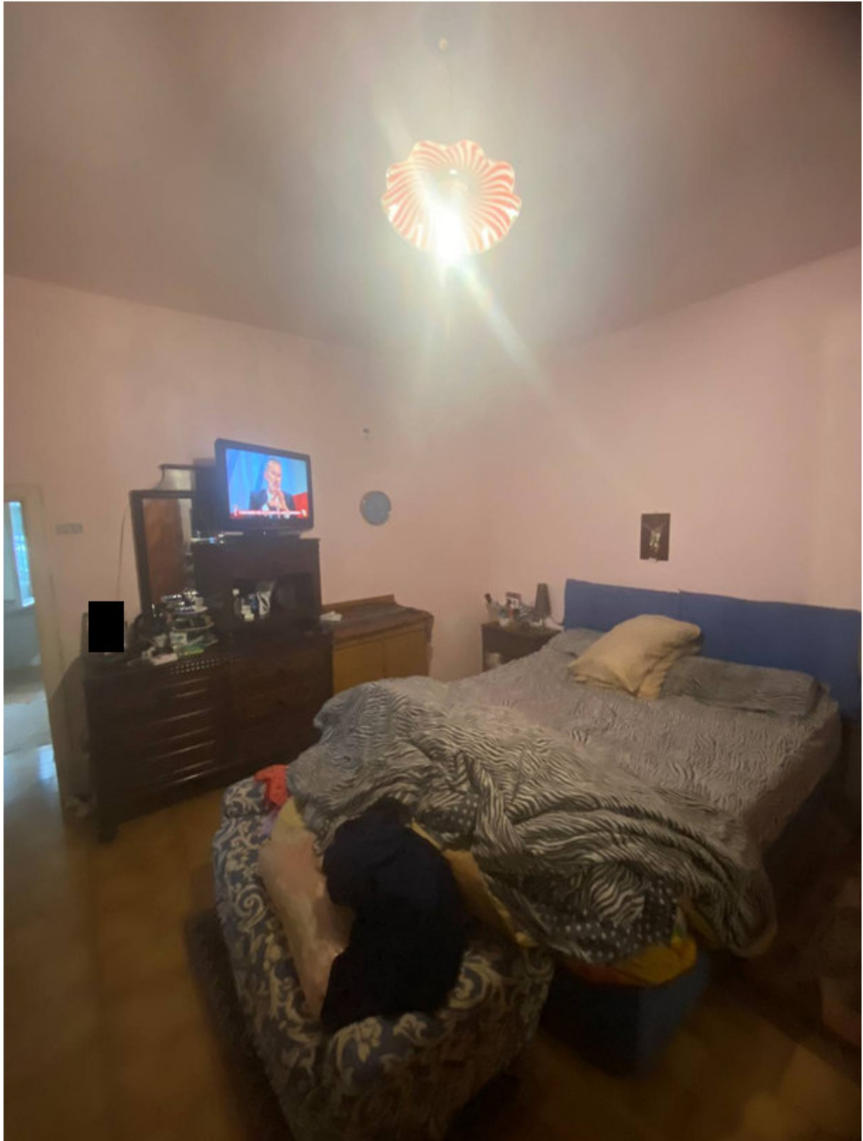
Fot.5 - Vista della camera da letto.