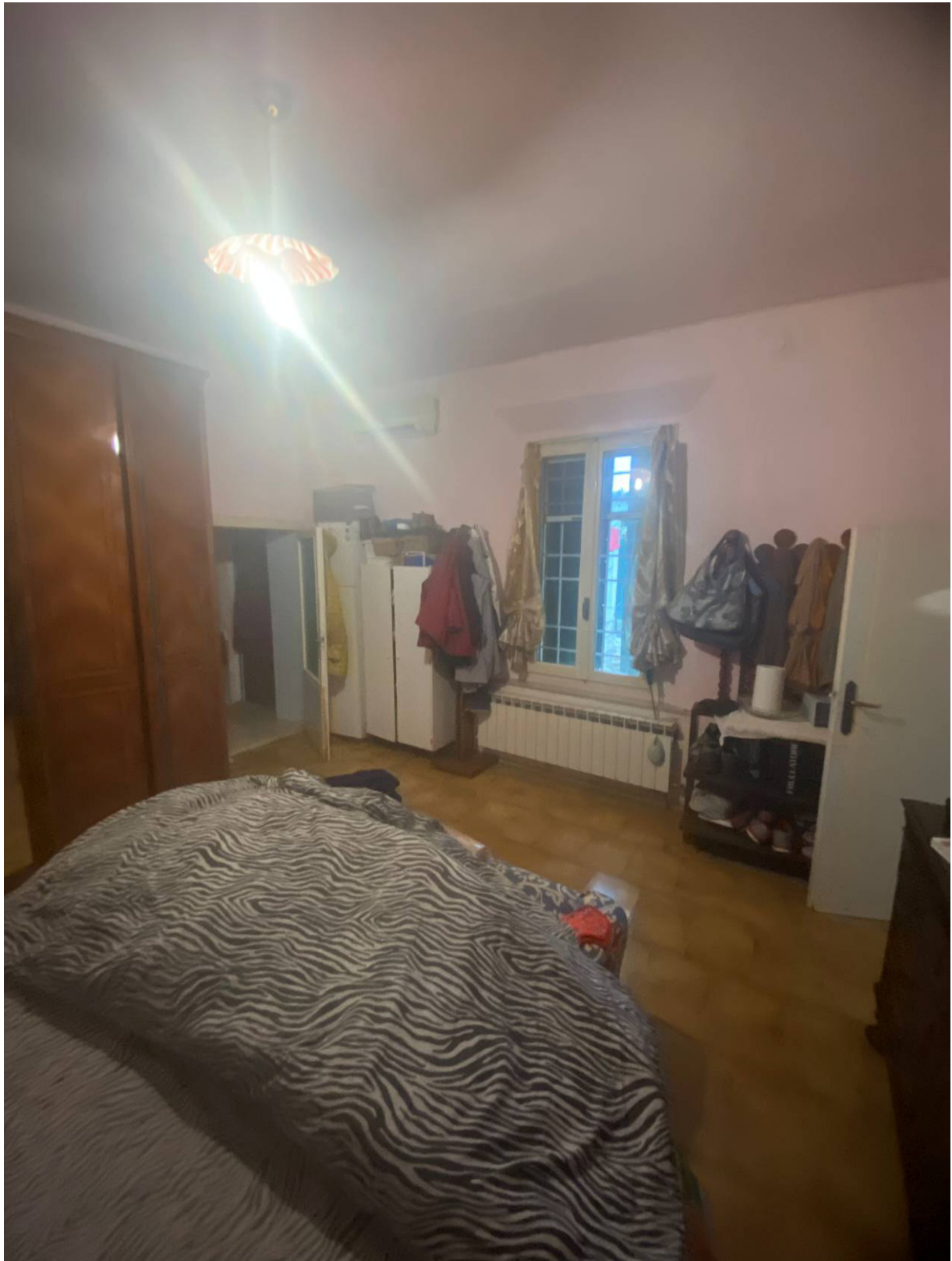
Fot.6 - Vista della camera da letto.