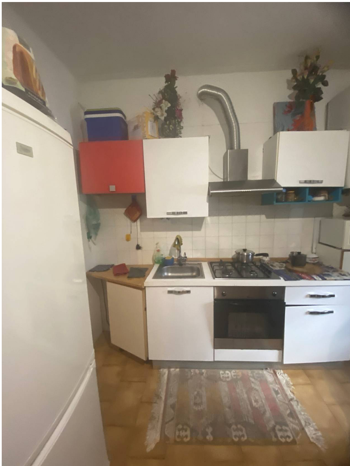
Fot.3 - Vista dell' angolo cottura all' interno dell' unità immobiliare.