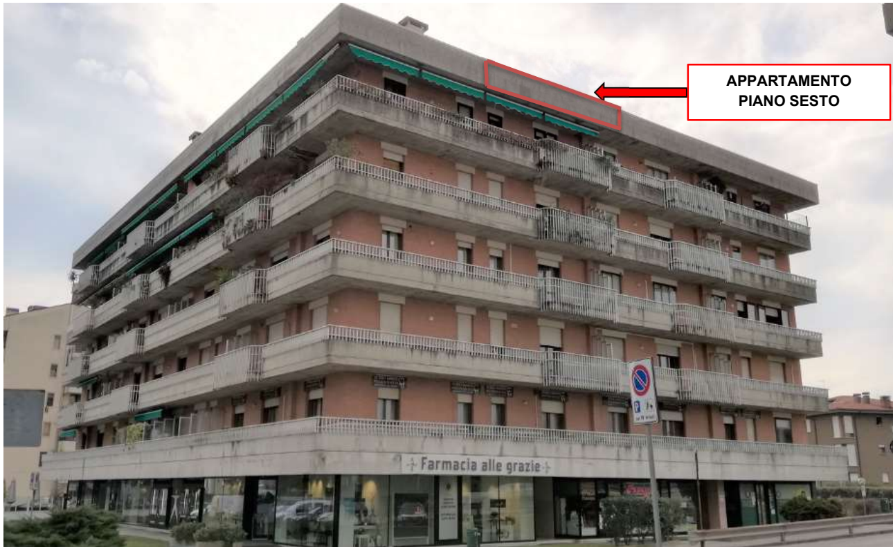
Foto 1 - Facciata principale vista da Via Passalacqua

Si riportano nel seguito le foto dell'immobile.