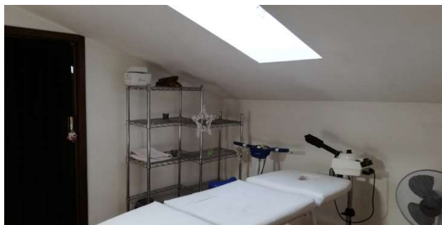
Foto 7 camera da letto