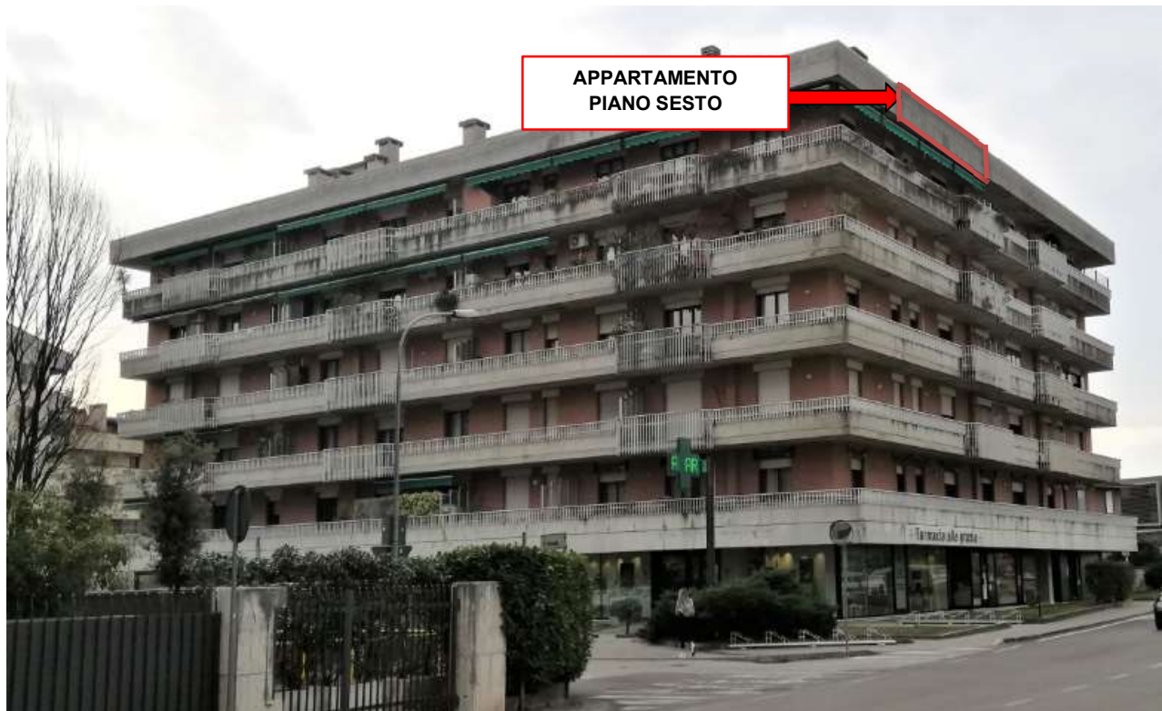
Foto 2 - Facciata principale vista da Via Passalacqua