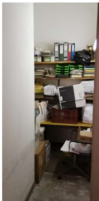
Foto 10 – Locali tecnici a piano interrato / Foto 11 – Locale cantina