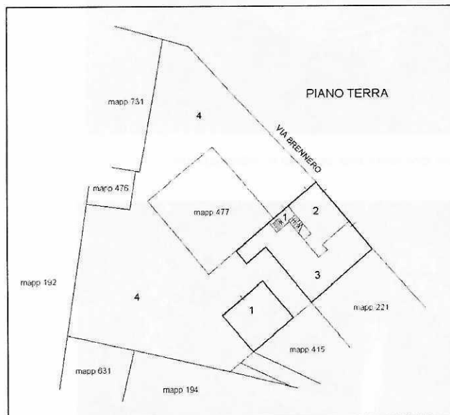
Stralcio dell'elaborato planimetrico catastale

Si riporta di seguito uno stralcio dell'elaborato planimetrico catastale dove si rileva la presenza del fabbricato sanato con configurazione planimetrica non corrispondente allo stato di fatto. Si può notare inoltre la presenza del bene comune non censibile, accatastato come subalterno 4.