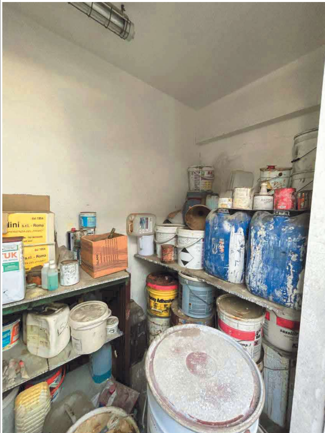
Descrizione: Ripostiglio nel fabbricato est foglio 41 mappale 1041 sub. 3