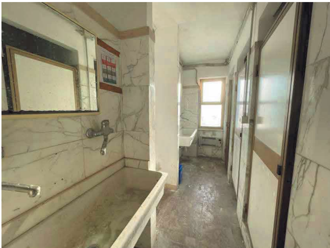
Descrizione: Interno servizi igienici e docce nell'appendice al fabbricato foglio 40 mappale 765