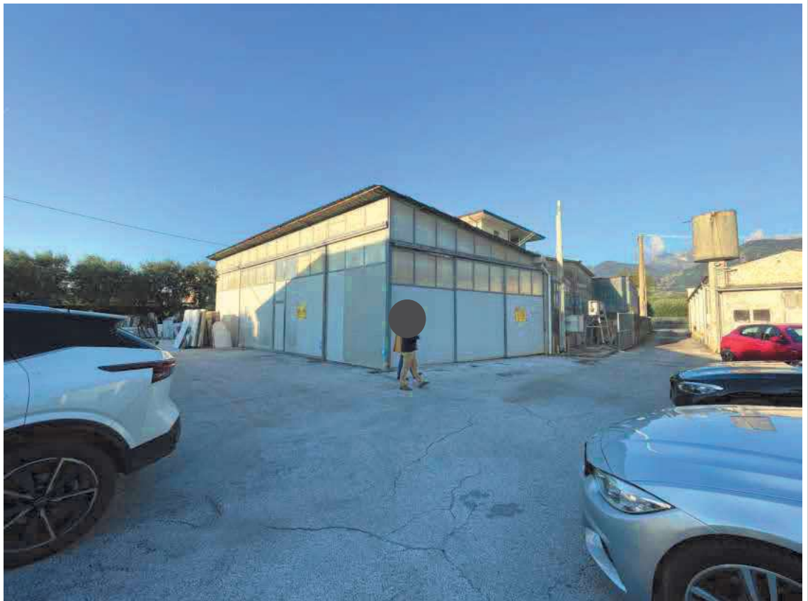
Descrizione: Fabbricato foglio 40 mappale 765 e piazzale - prospetto sud-est