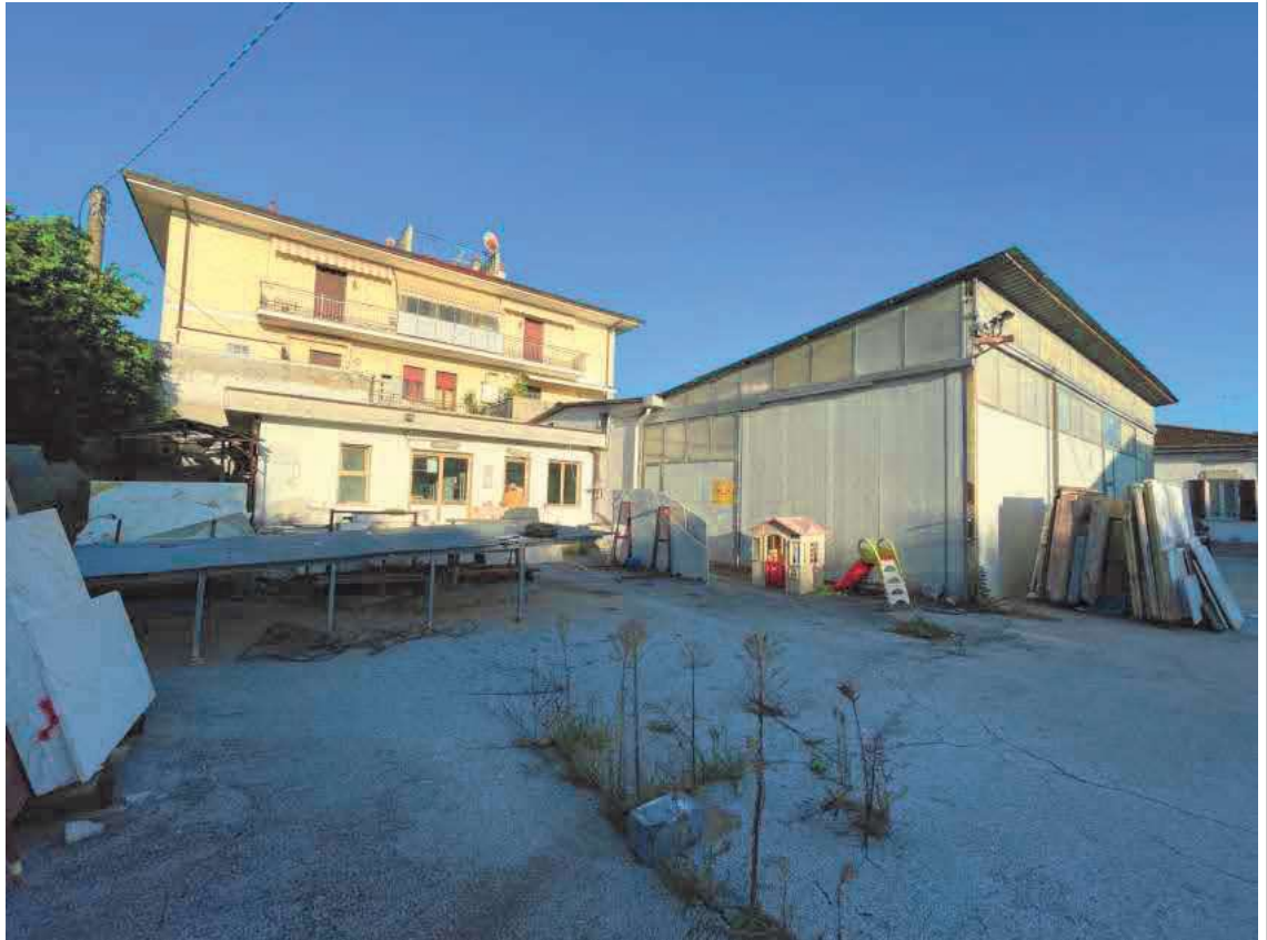
Descrizione: Fabbricato foglio 40 mappale 765 e piazzale - prospetto sud-ovest