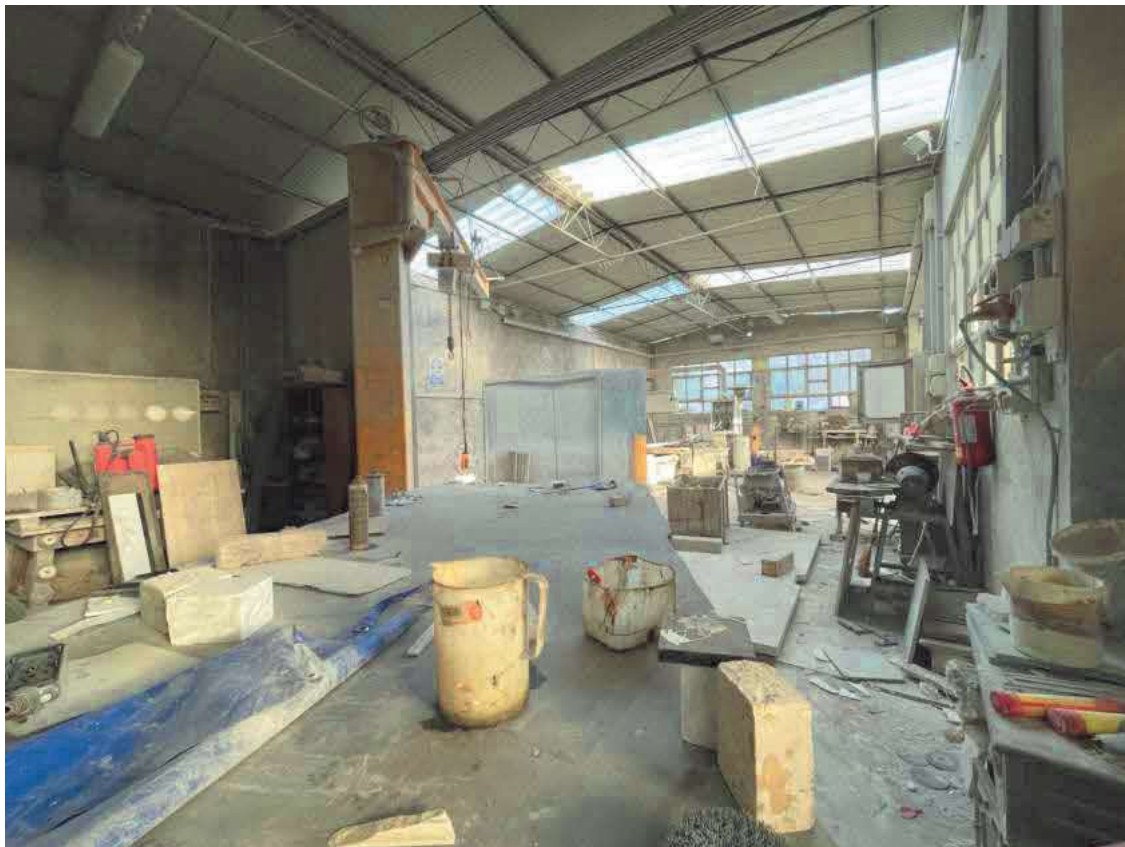
Descrizione: Interno laboratorio fabbricato foglio 40 mappale 765