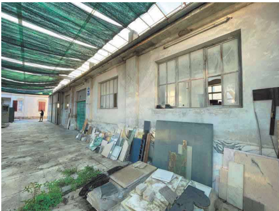
Descrizione: Fabbricato ovest foglio 41 mappale 1041 sub. 3