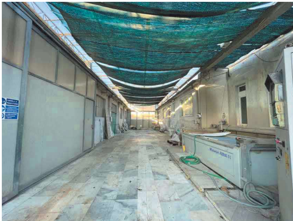
Descrizione: Tettoia foglio 41 mappale 1041 sub. 3