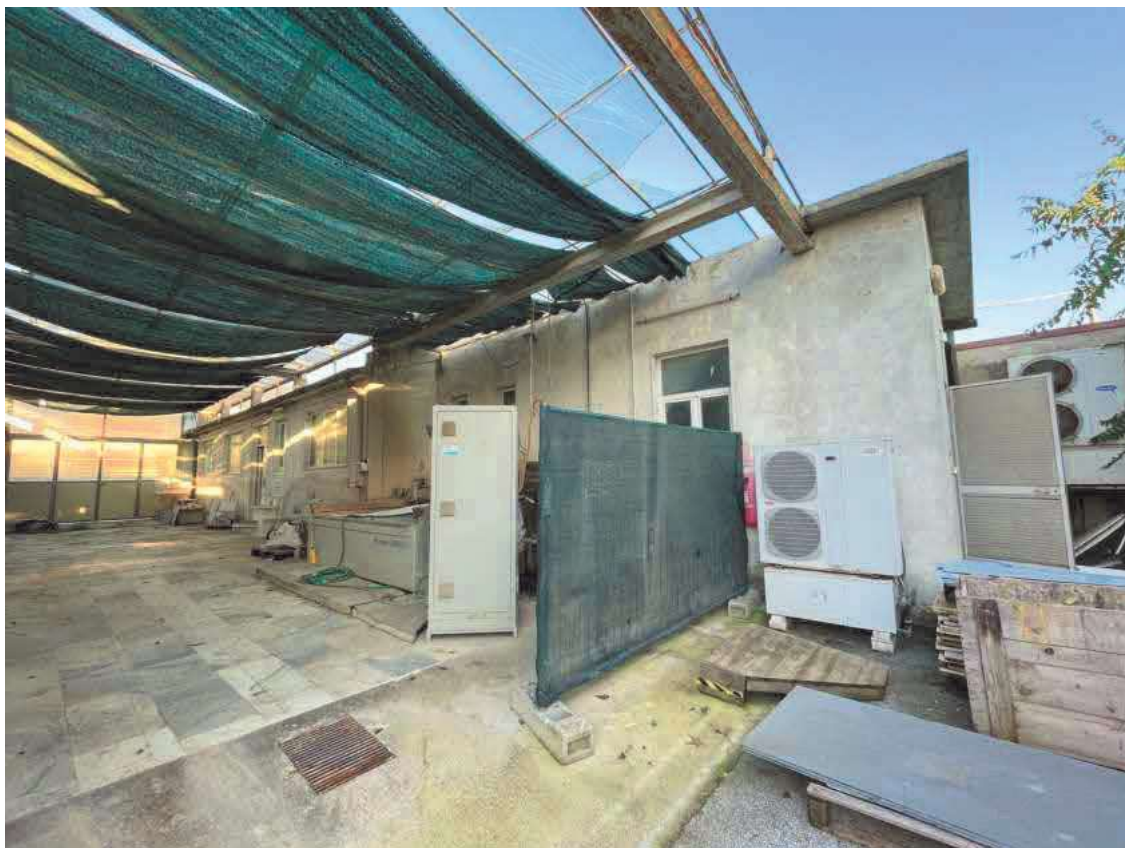
Descrizione: Fabbricato est foglio 41 mappale 1041 sub. 3