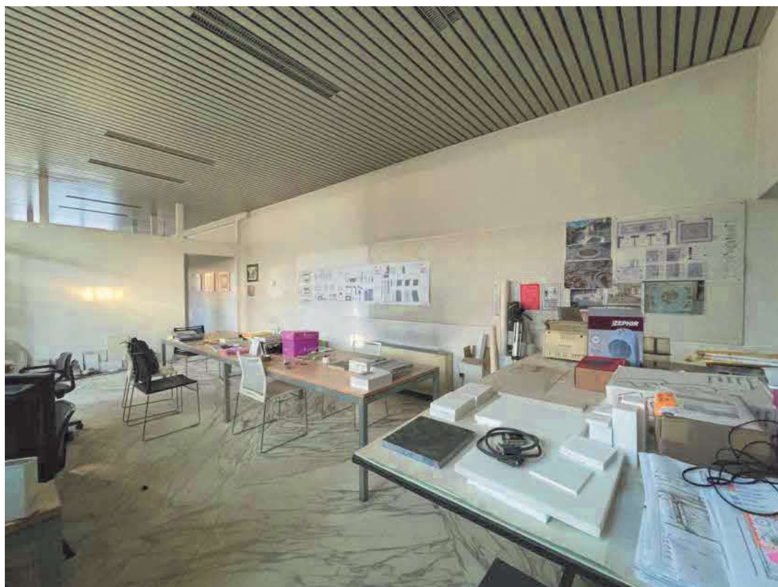
Descrizione: Interno tipo fabbricato est foglio 41 mappale 1041 sub. 3