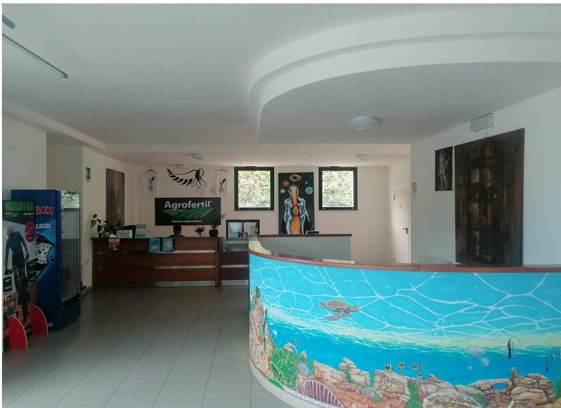
reception e zona bar