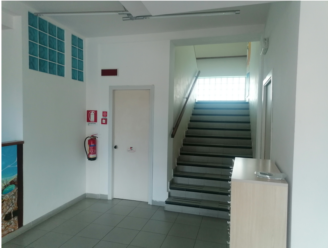
ingresso e scala