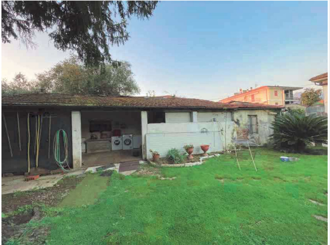
Descrizione: Accessorio esterno lato ovest, zona sud