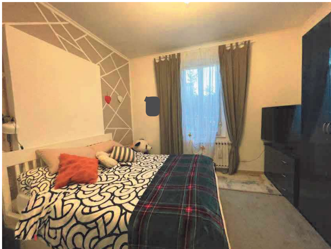
Descrizione: Interno camera