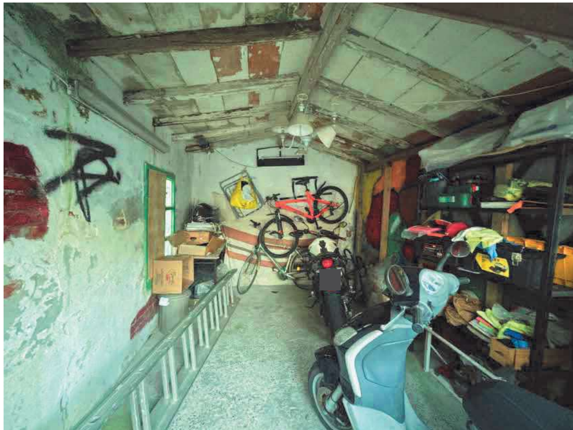
Descrizione: Interno rimessa