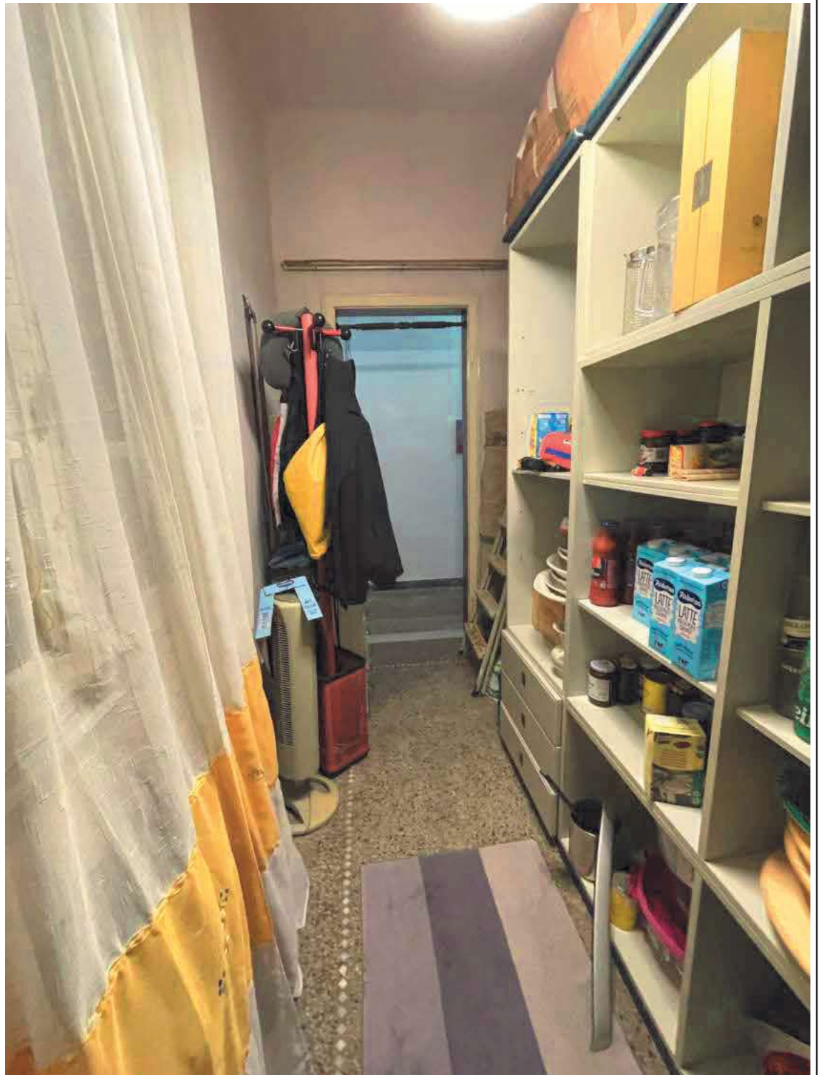
Descrizione: Interno ripostiglio