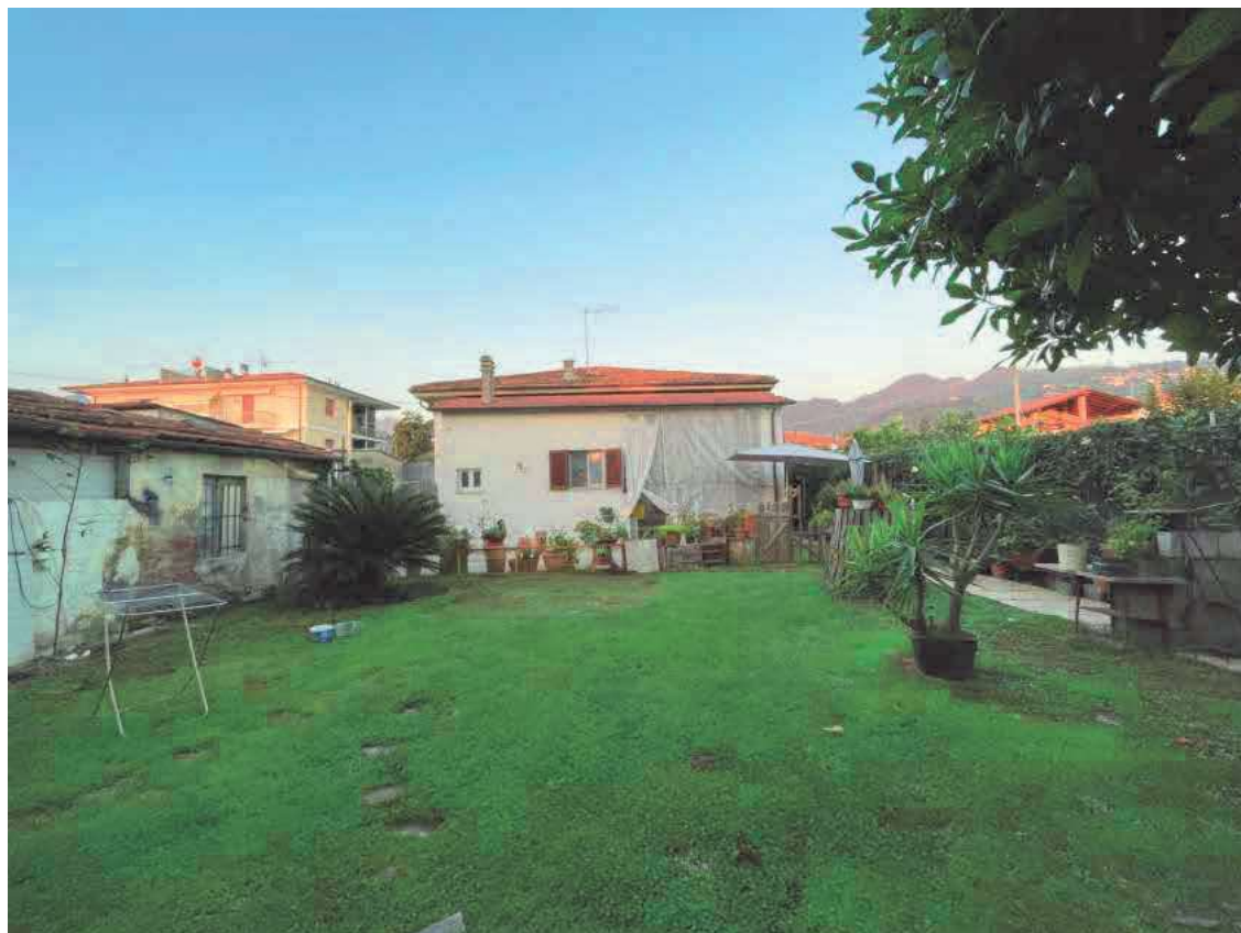
Descrizione: Prospetto sud e resede