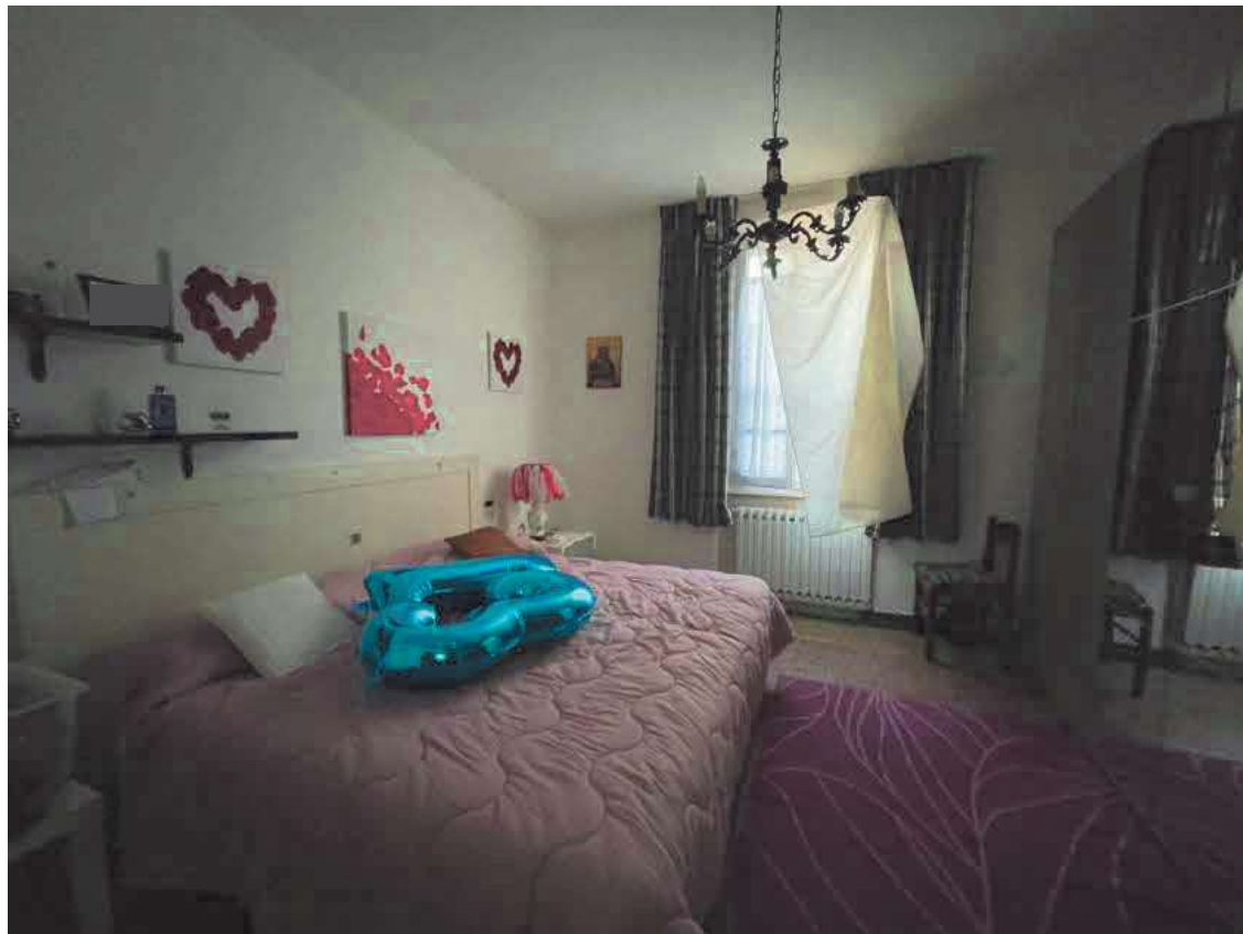
Descrizione: Interno camera