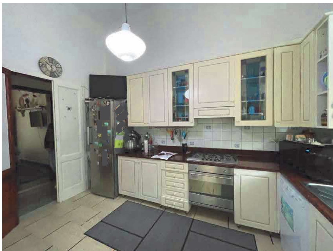
Descrizione: Interno cucina