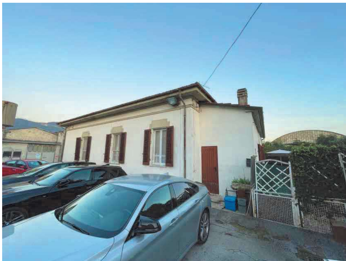
Descrizione: Prospetto ovest