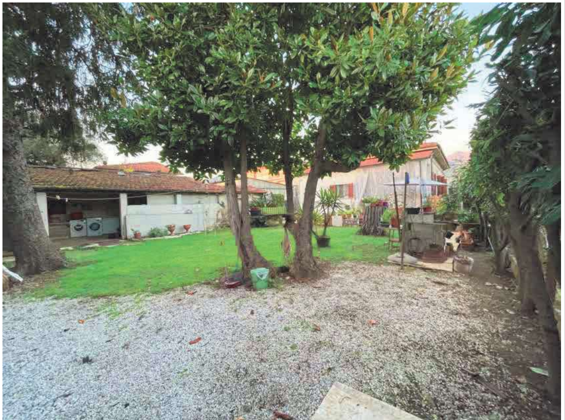
Descrizione: Accessorio esterno lato ovest, zona sud e resede