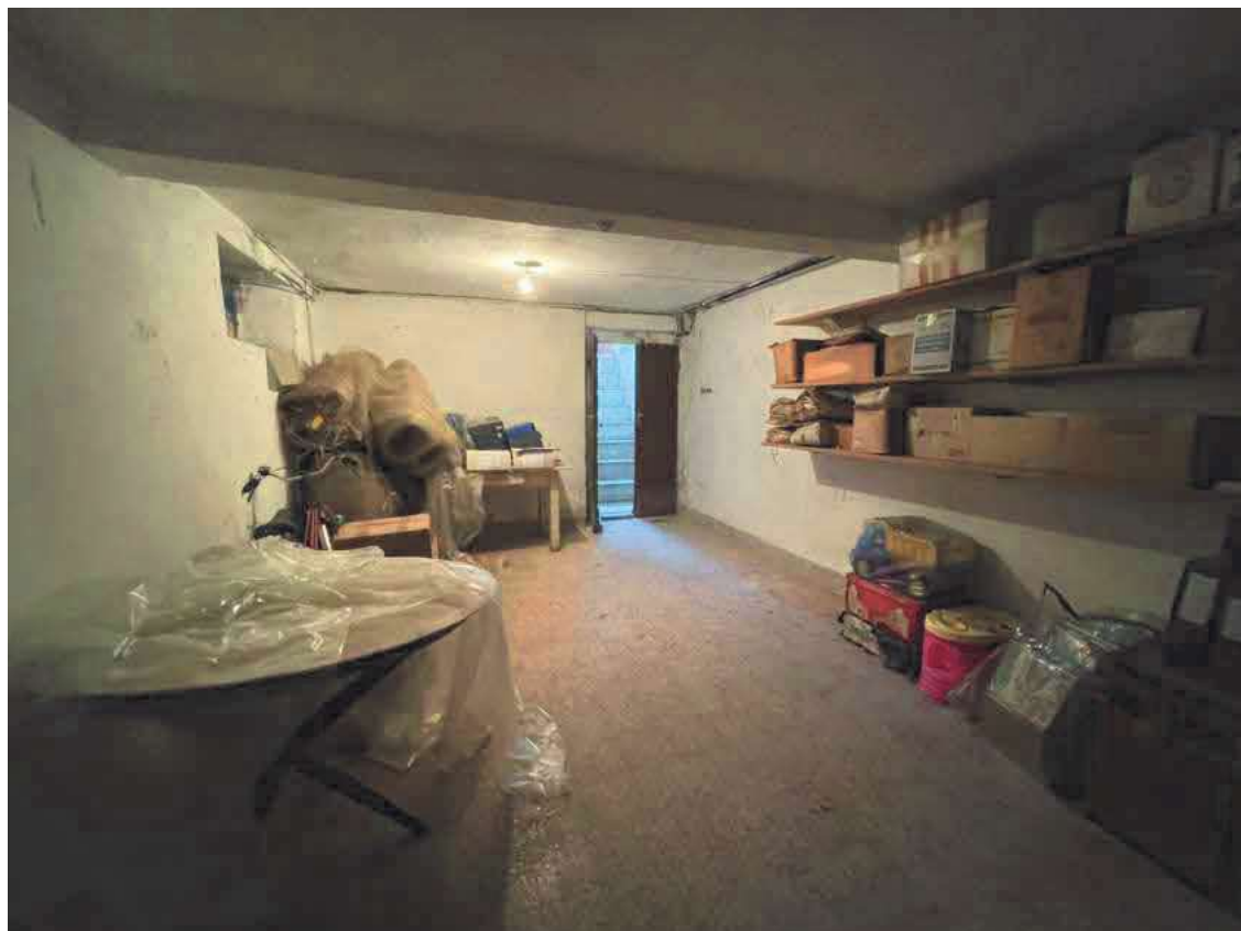
Descrizione: Interno cantina