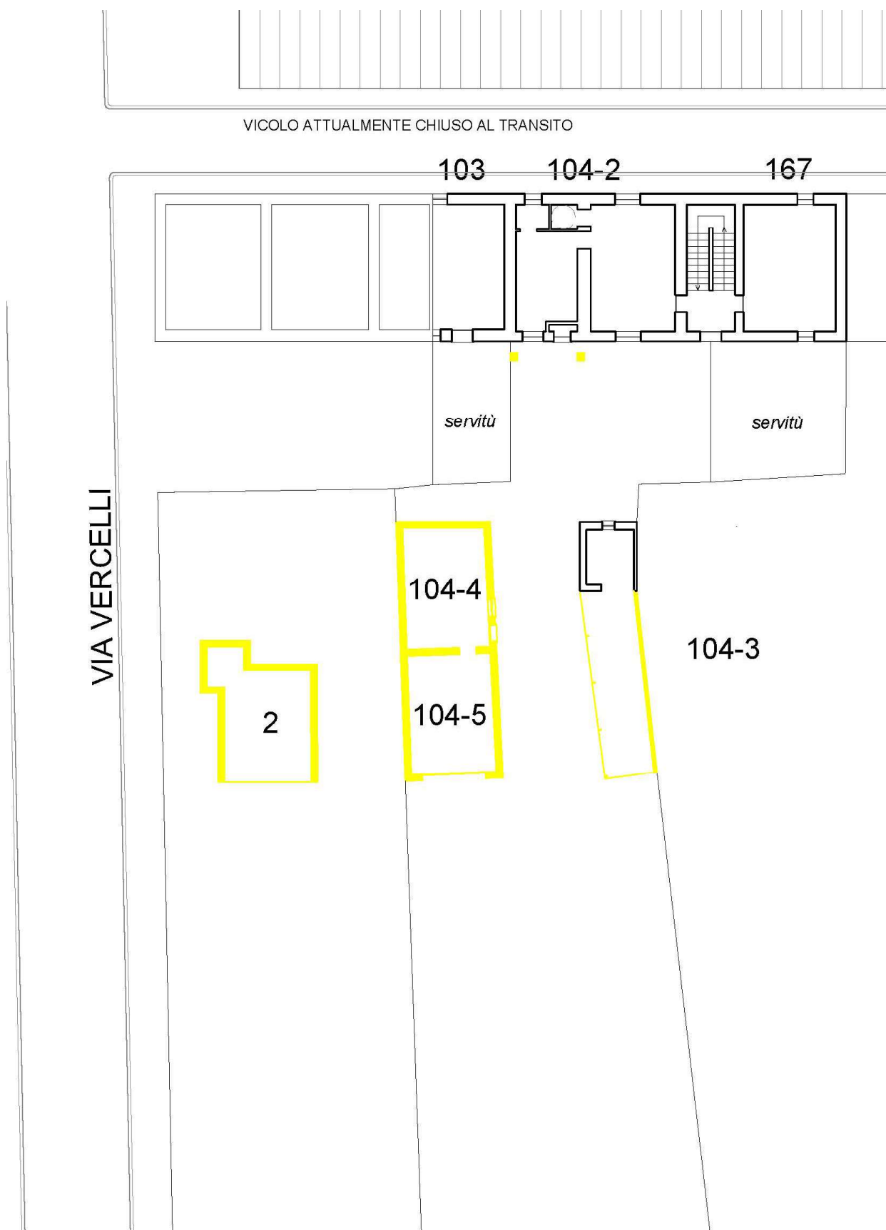
FIGURA 27: PIANO TERRA, PLANIMETRIA DI CONFRONTO. IL COLORE GIALLO INDICA LE DEMOLIZIONI E IL COLORE ROSSO LE COSTRUZIONI.