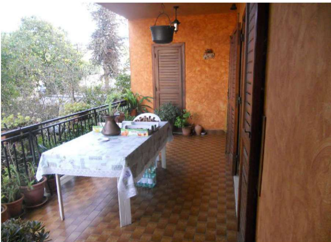
Foto n°12 - Balcone al piano primo antistante all'immobile pignorato