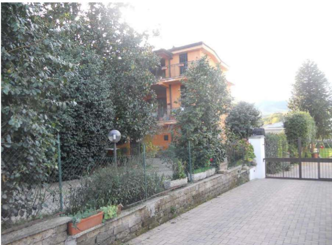
Foto n°4 - Vista del fabbricato dal confine della proprietà al civico successivo