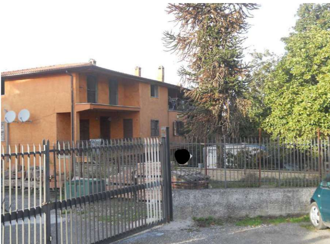
Foto n°2 - Vista da via Casale Romani della costruzione in cui è ubicato l'immobile pignorato