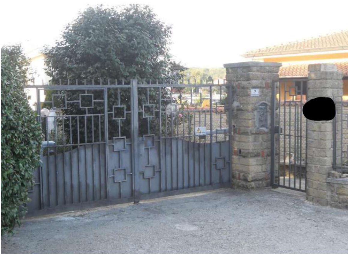
Foto n°3 - Ingresso carrabile e pedonale alla proprietà immobiliare al civico 7 della via