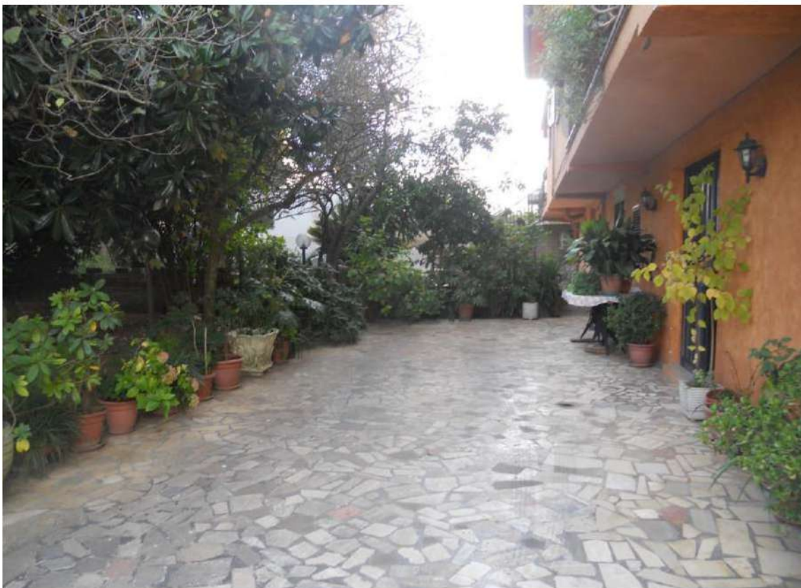
Foto n°9 - Corte del fabbricato ad est al piano terra che affaccia sulla strada