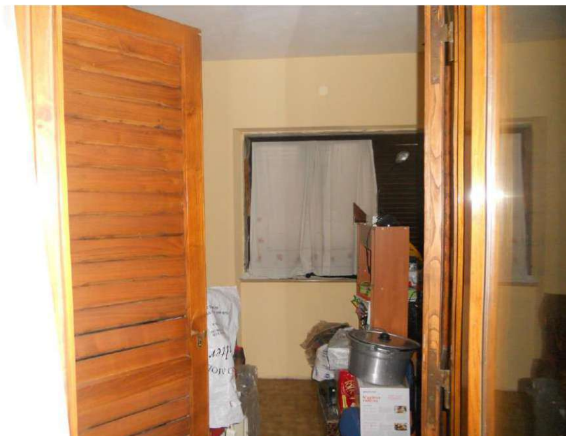
Foto n°21- Loggia della camera chiusa con tamponatura abusivamente (cfr foto n°7)