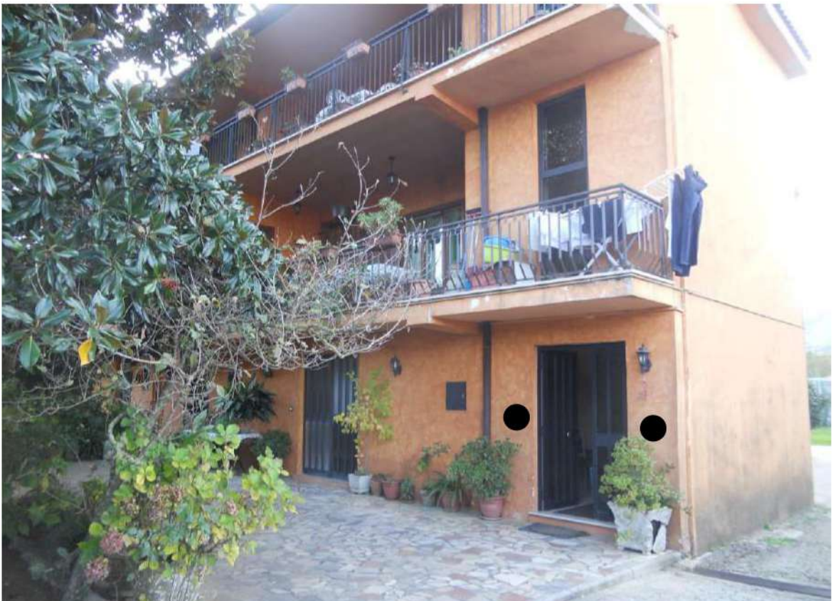
Foto n°6 - Prospetto est del fabbricato con a dx l'accesso alla scala che conduce ai vari livelli