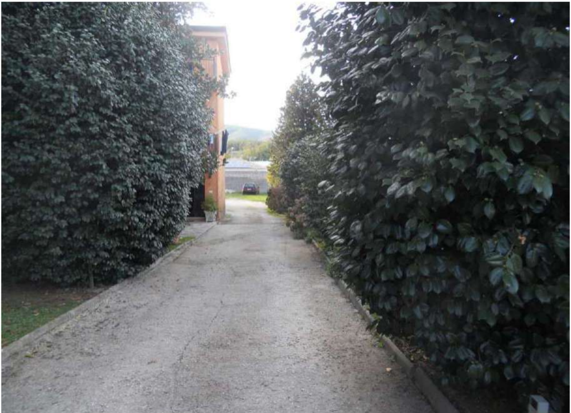
Foto n°5 - Viale di ingresso interno alla proprietà immobiliare al civico 7