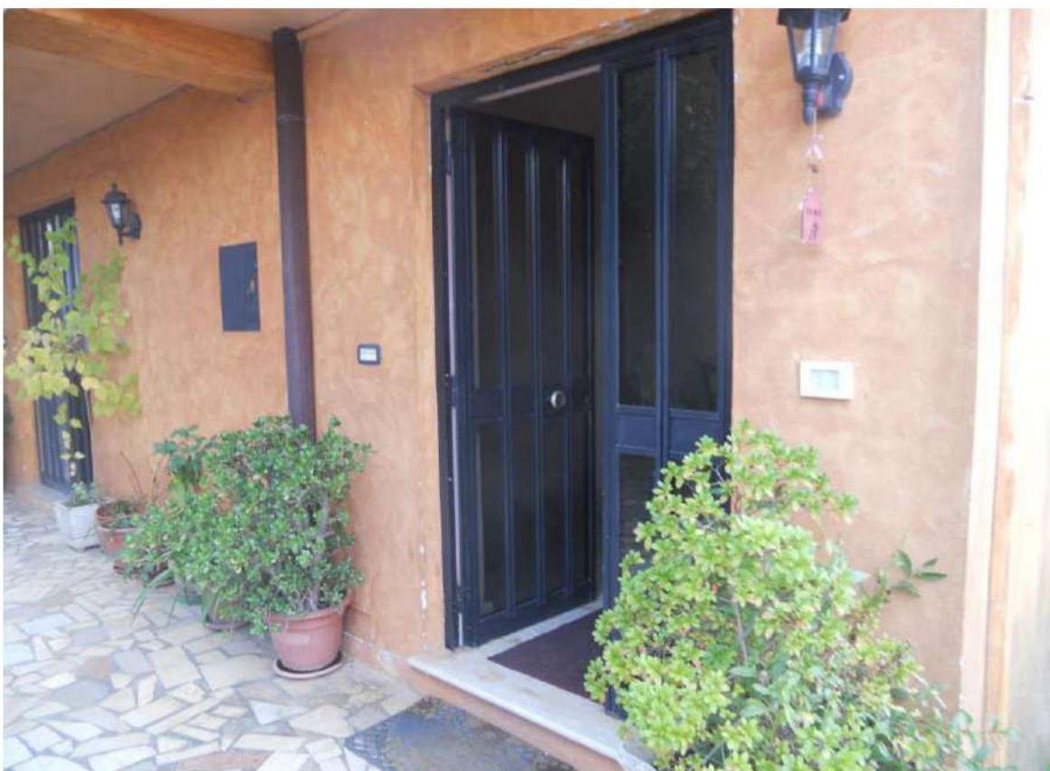
Foto n°10 - Ingresso alla scala interna che conduce ai piani del fabbricato