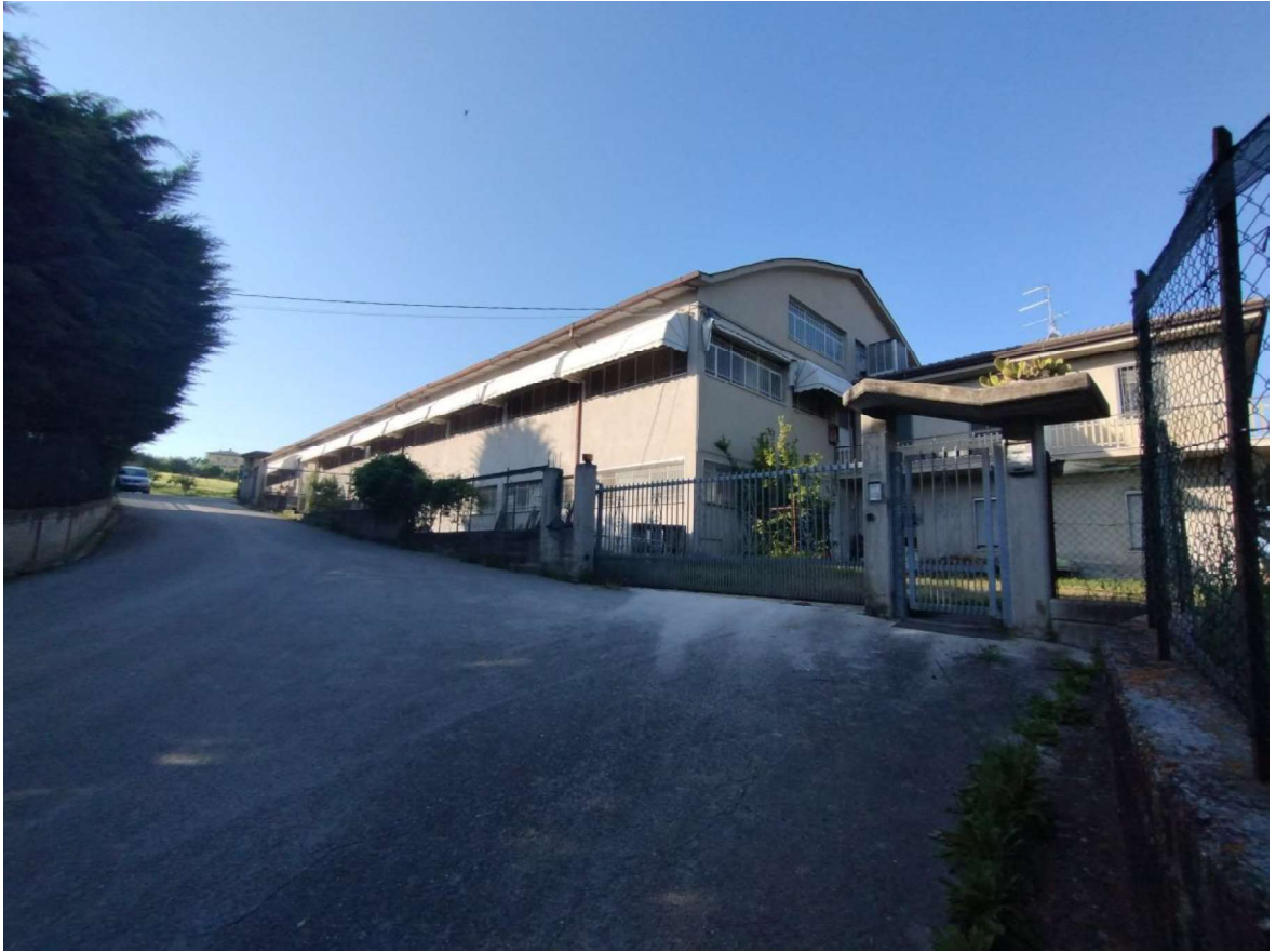
Foto n° 2 - Prospetti Nord e Ovest porzione Sub 15 “B.C.N.C. Corte”