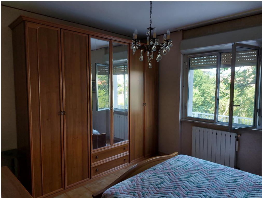
Foto 10_Camera matrimoniale