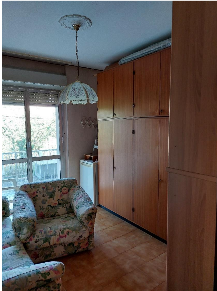
Foto 11_ camera singola