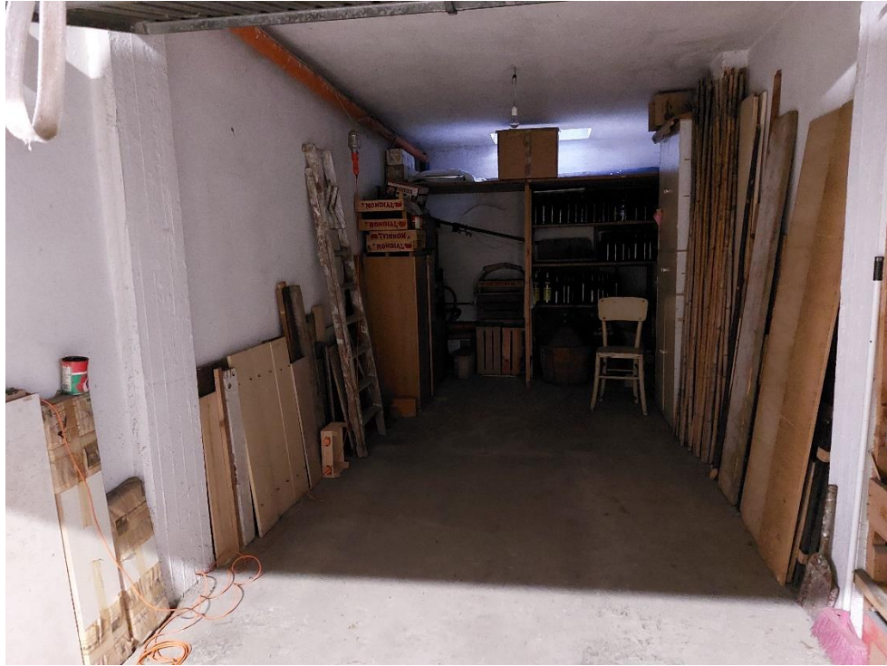
Foto 16_interno box