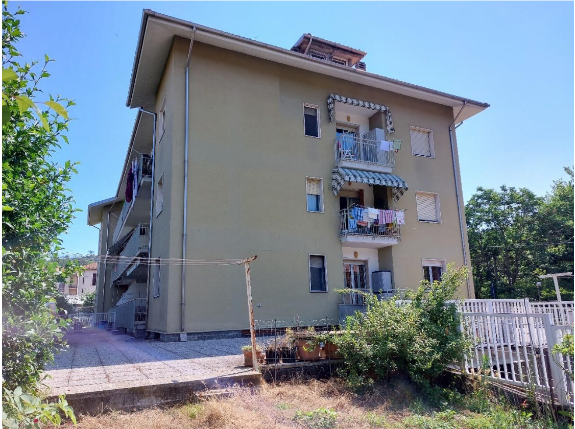
Foto 3 _vista esterni di proprietà