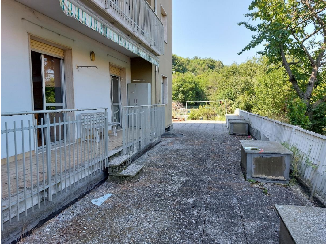
Foto 5 _particolare esterni