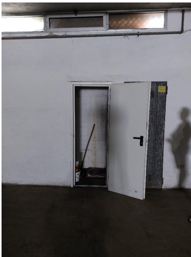
Foto 14_ porta di accesso alla cantina