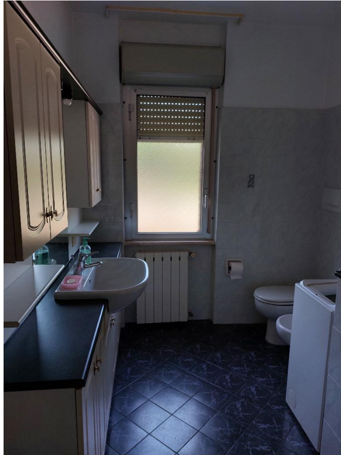
Foto 9_Servizi igienici