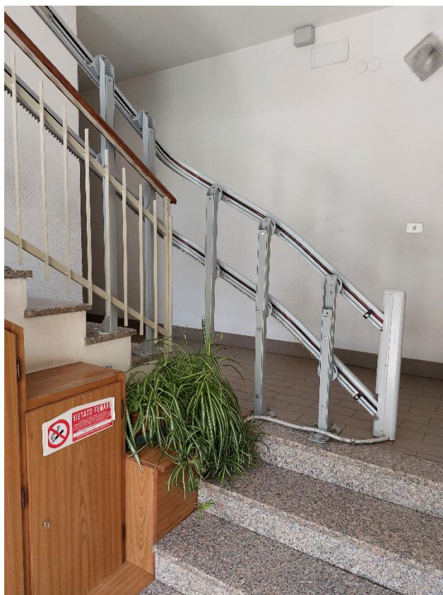
Foto 7 _ gradini di ingresso privi di superamento barriere architettoniche