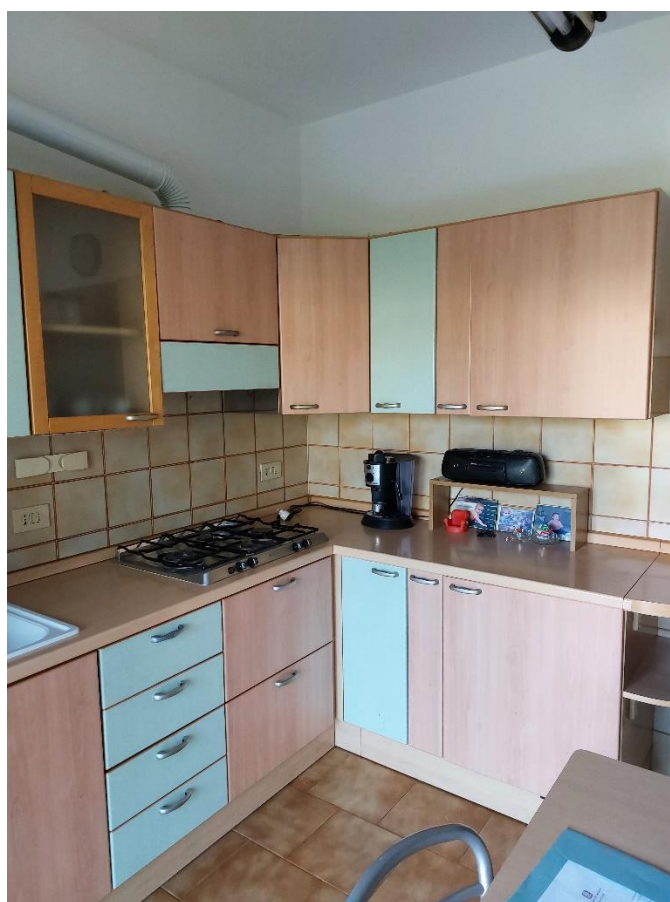
Foto 8 _ cucina