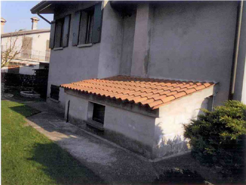
FOTO 2 – Demolizione completa dell'accessorio e ripristino dello stato originario dei luoghi