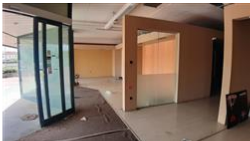
Interno piano terra