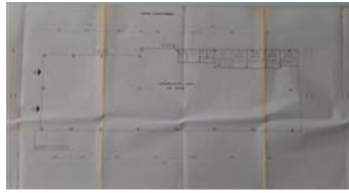
piano terra assentito