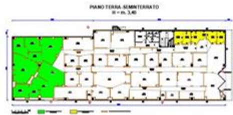
Piano seminterrato attuale