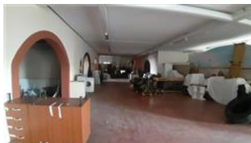
Interno primo piano