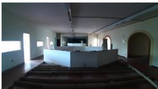
Interno primo piano