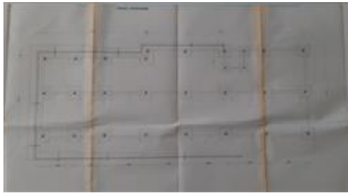
piano seminterrato assentito