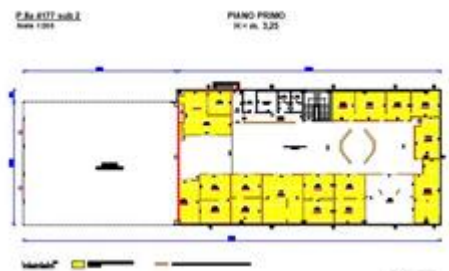
Piano terra/primo attuale