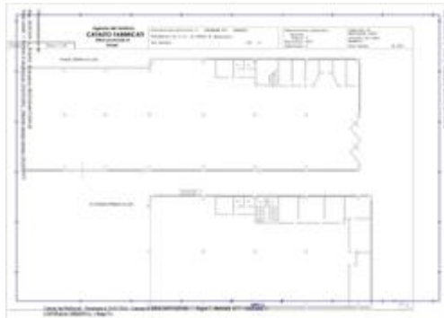
Piani seminterrato e terra catastale