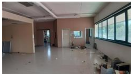
Interno piano terra