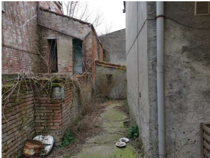
FOTO 33. rustici da cortile di proprietà -