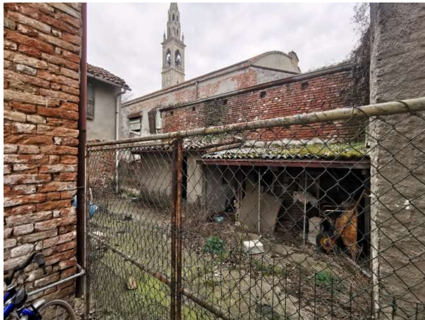
FOTO 14.vista interno cortile proprietà -