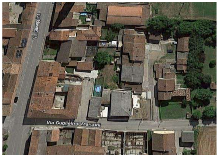
FOTO 2. veduta satellitare compendio -