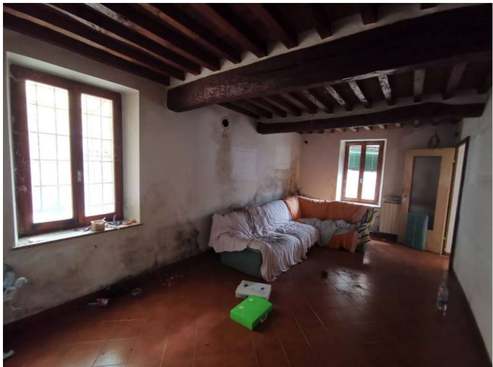
FOTO 20.vista soggiorno -