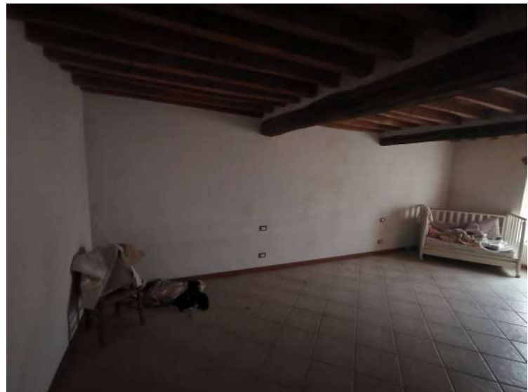
FOTO 28. camera -