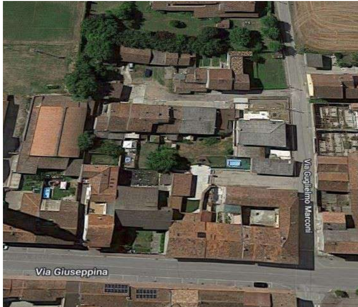
FOTO 3.veduta satellitare Via Giuseppina (Via principale) e Via G.Marconi -