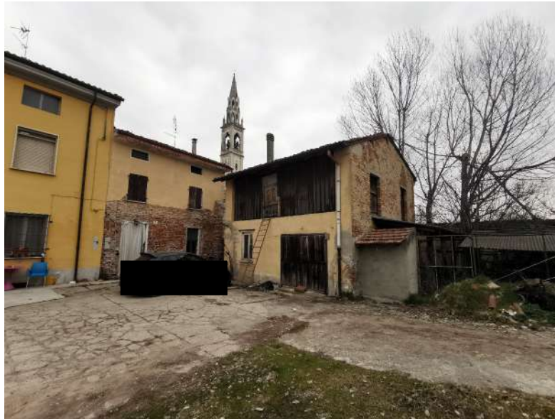
FOTO 11. vista compendio -