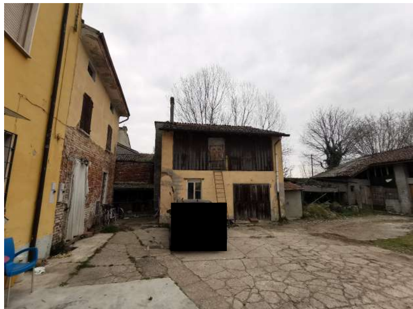
FOTO 10.vista da cortile -