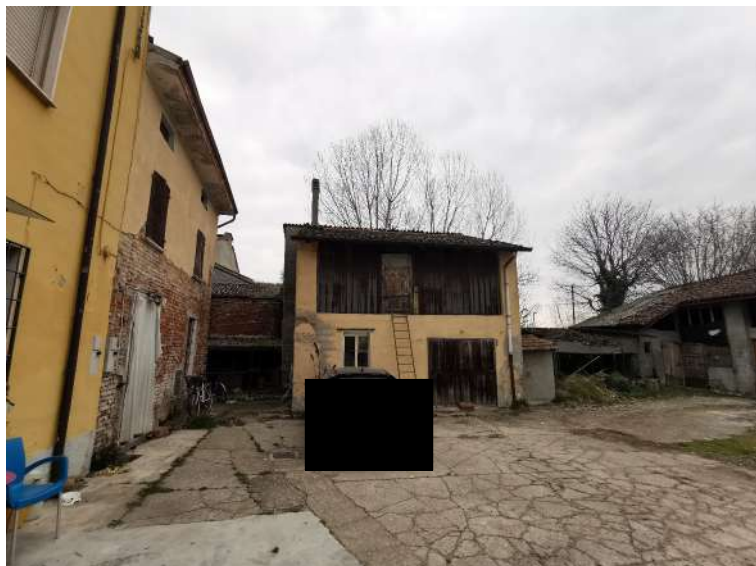
FOTO 8. vista immobili compendio da cortile comune (proprietà privata) -