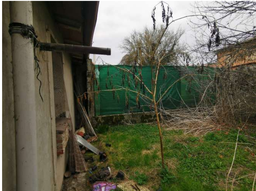
FOTO 36. abitazione da cortile di proprietà -