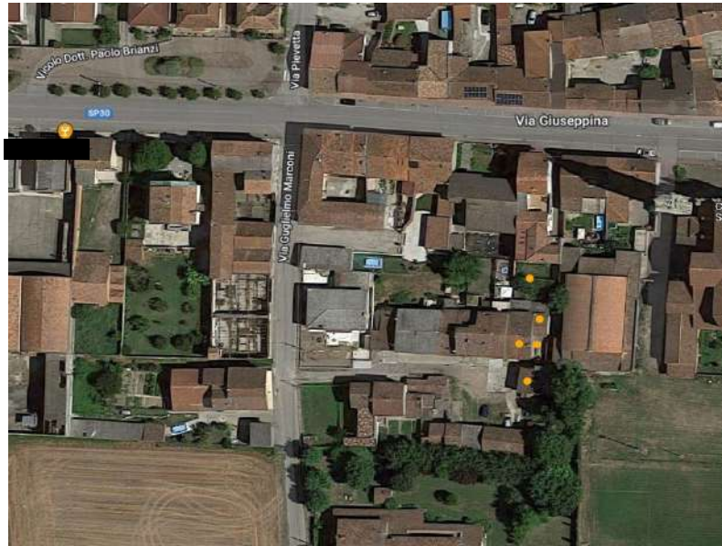
FOTO 1. veduta satellitare compendio -