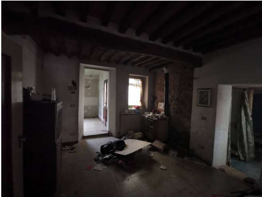
FOTO 21.vista pranzo -