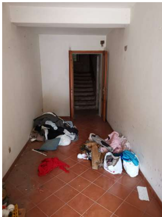
FOTO 16.vista ingresso -