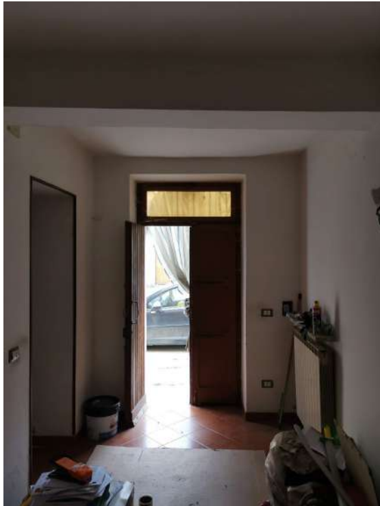
FOTO 17.vista ingresso -