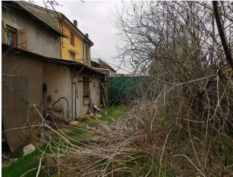
FOTO 35. abitazione da cortile di proprietà -