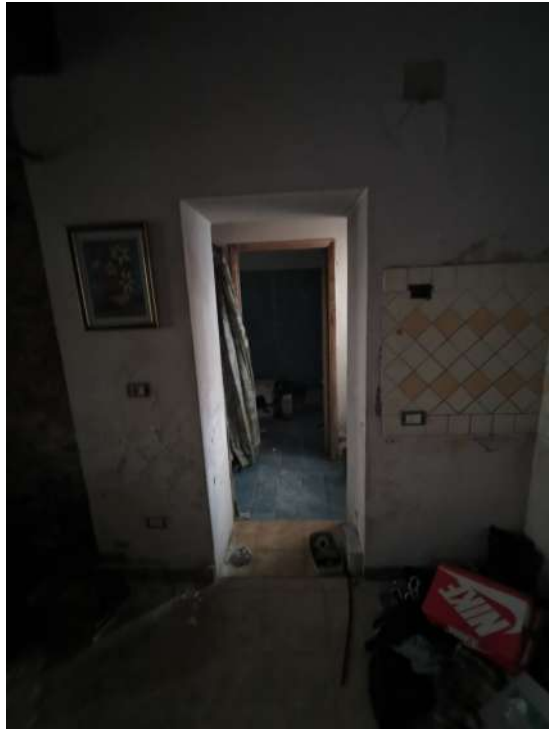
FOTO 23.vista disimpegno -