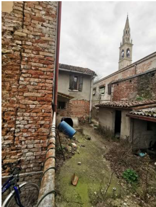
FOTO 15. vista interno cortile proprietà -