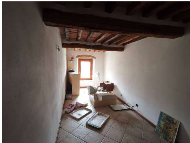
FOTO 30. ripostiglio -