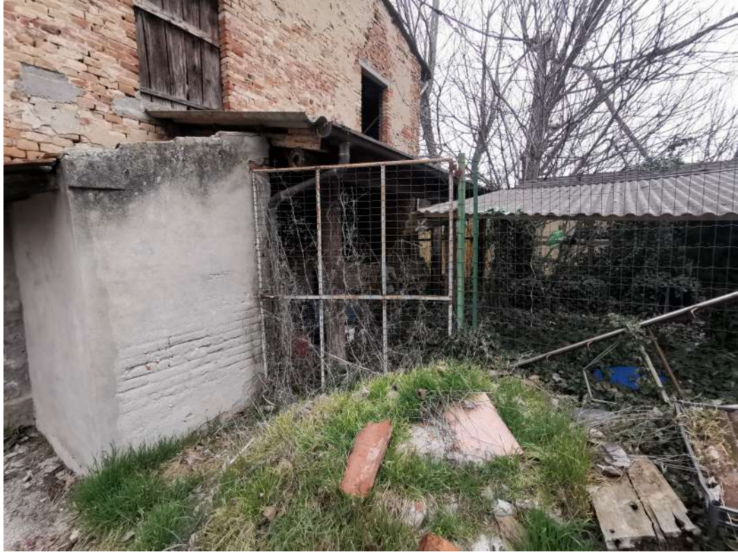
FOTO 39. vista area di proprietà di fianco al fienile (garage- cantina lavanderia PT) con tettoie non censite -