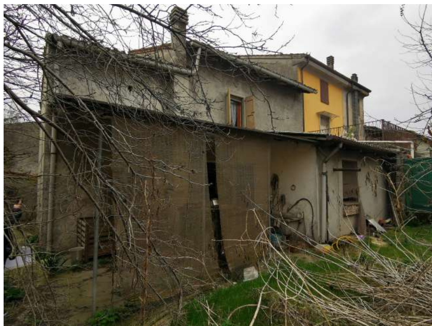
FOTO 34. abitazione da cortile di proprietà -