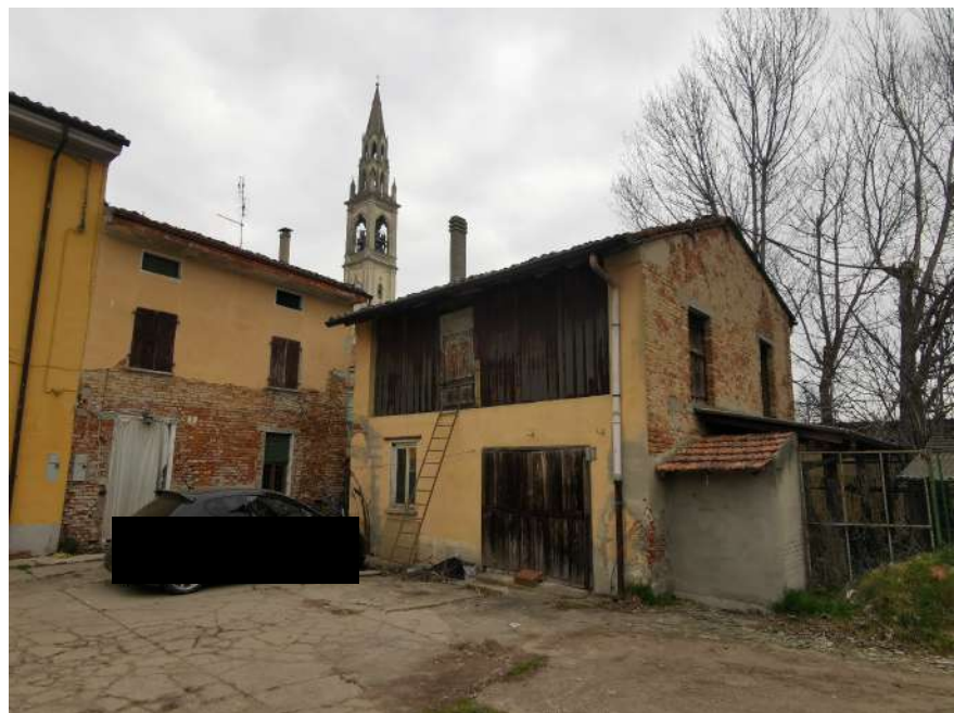
FOTO 12. vista comparto immobiliare -