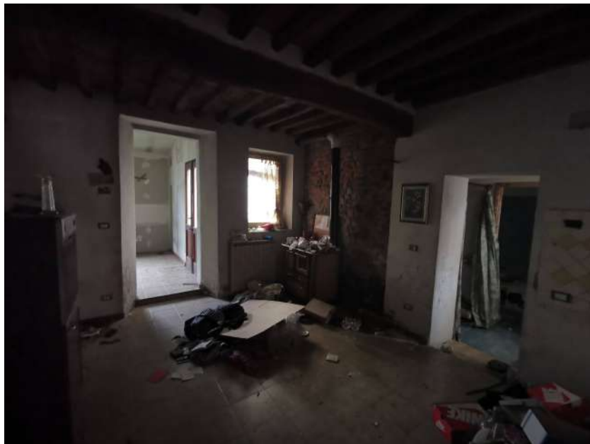
FOTO 22.vista pranzo -