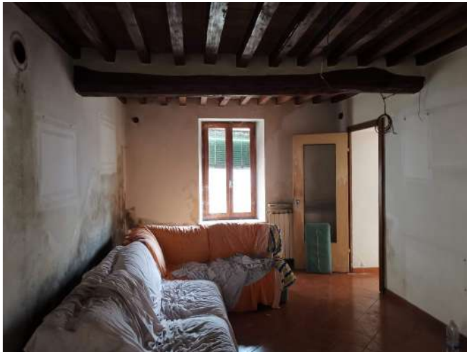
FOTO 19.vista soggiorno -