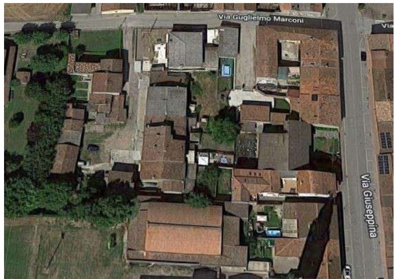
FOTO 4. veduta satellitare compendio -