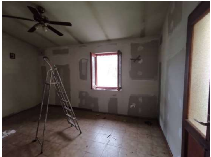
FOTO 26.locale sgombero -