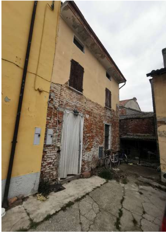
FOTO 9.vista ingresso abitazione da cortile comune -