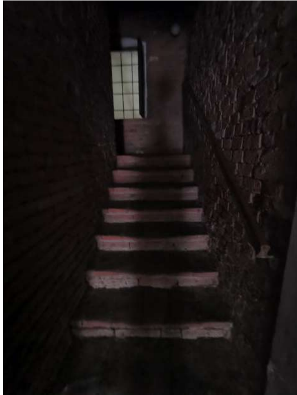
FOTO 27. vano scala -