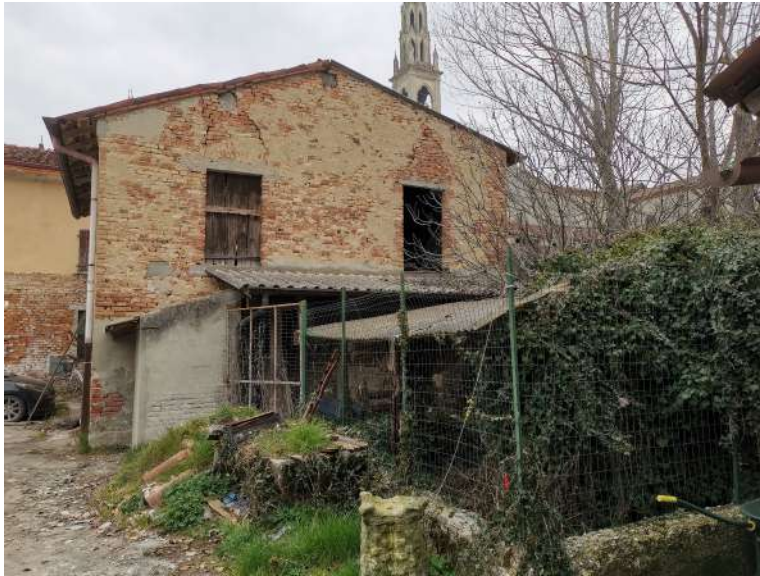
FOTO 13.vista rustici e tettoie non censite -