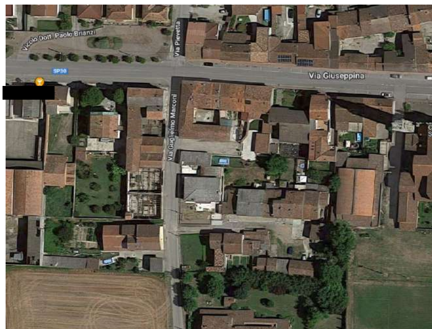
FOTO 5.vista satellitare -