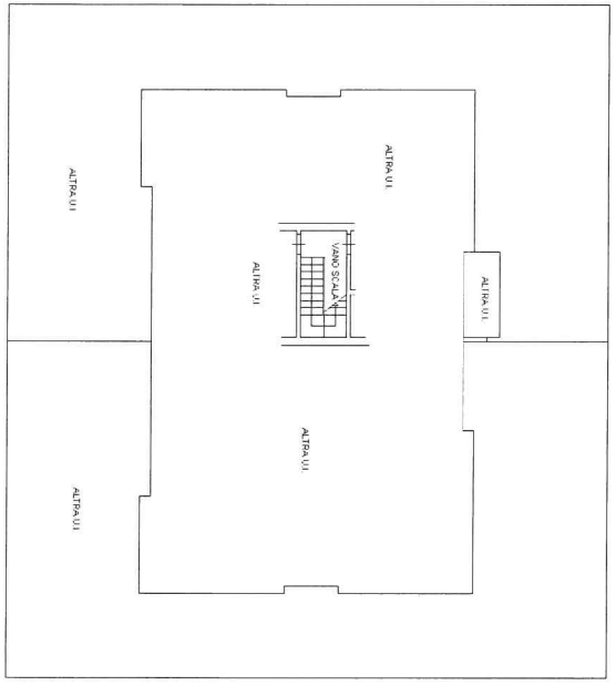
PIANO TERRA H. MI. 2,26