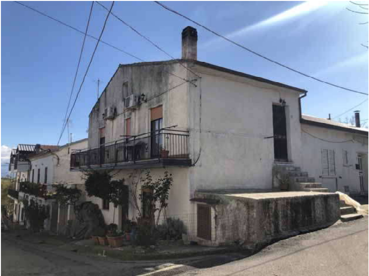
Foto 1 – Vista esterno del fabbricato angolo via Attilio Fava – via Nicola Mari.