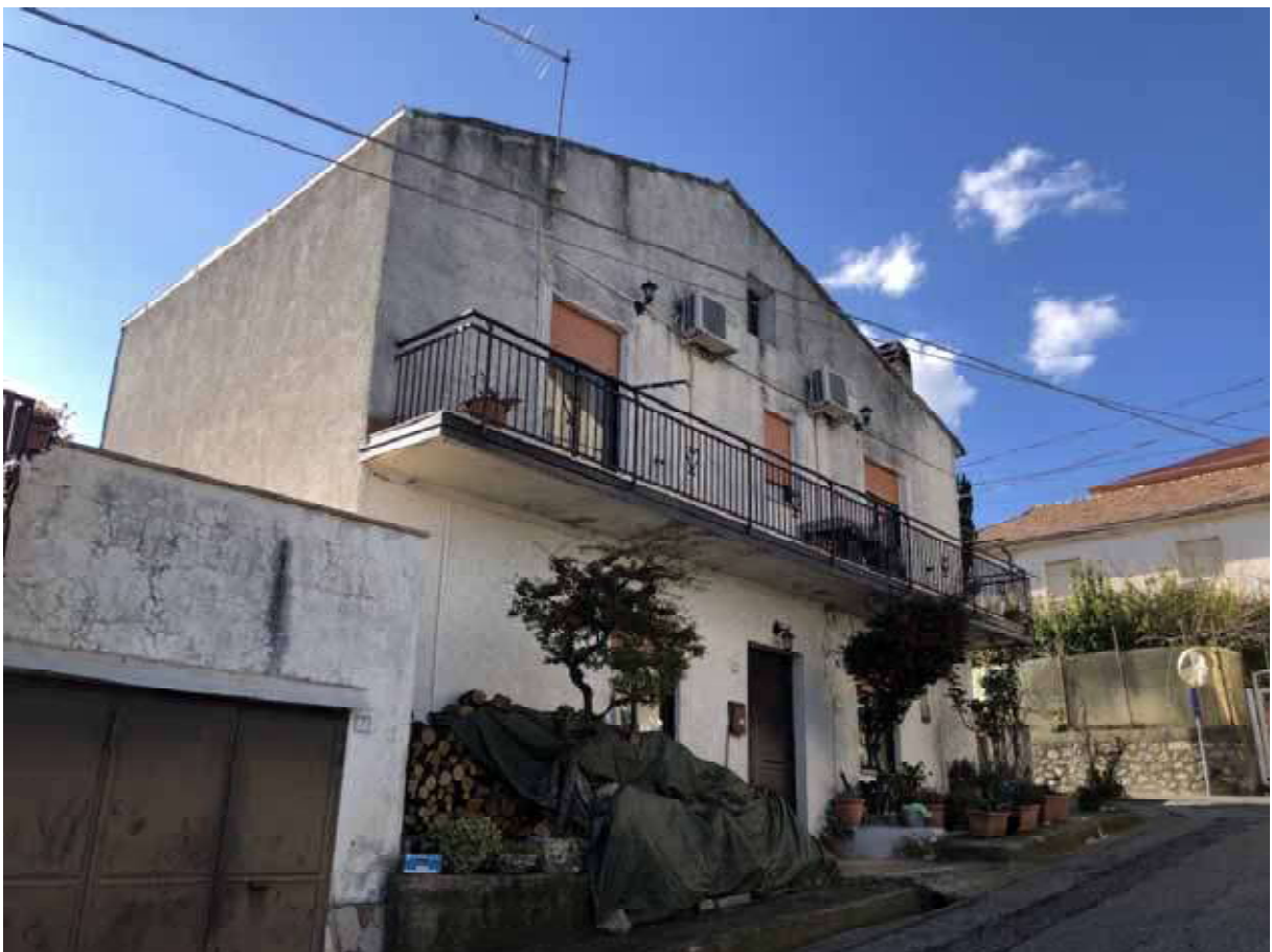
Foto 2 – Vista esterno del fabbricato facciata su via Attilio Fava.